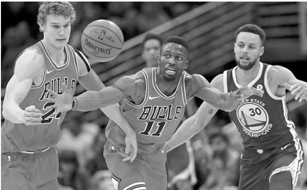
من مباراة شيكاغو بولز وغولدن ستايت

حقق غولدن ستايت وويريز حامل اللقب فوزه الرابع عشر توالياً خارج ارضه على حساب شيكاغو بولز ١١٩-١١٢، في دوري كرة السلة الأميركي للمحترفين، معادل رقمه القياسي ليصبح على بعد فوزين من معادلة الرقم القياسي في الدوري.