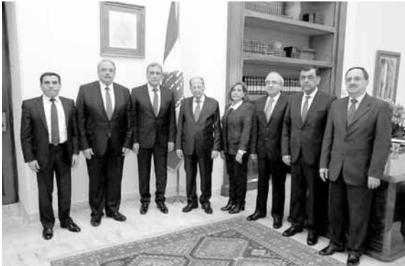
عون مستقبلا اعضاء مجلس شورى الدولة (دالاتي ونهرا)

أكد رئيس الجمهورية العماد ميشال عون، أن «أحكام المؤسسات القضائية والهيئات الرقابية وقراراتها يجب أن تحترم، لأن هذه المؤسسات انشئت لاحقاق الحق والفصل في النزاعات، بعيدا عن الضغوط والتشكيك بنزاهة أركانها وحيادهم».