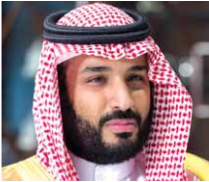
محمد بن سلمان

السعودية والعودة الى لبنان وعودته عن الاستقالة وممارسة عمله كرئيس لمجلس الوزراء اللبناني، ابلغ ولي العهد السعودي الامير محمد بن سلمان الرئيس الفرنسي ماكرون ان هنالك خياراً امام الرئيس سعد الحريري الذي يحمل الجنسية السعودية والجنسية اللبنانية.