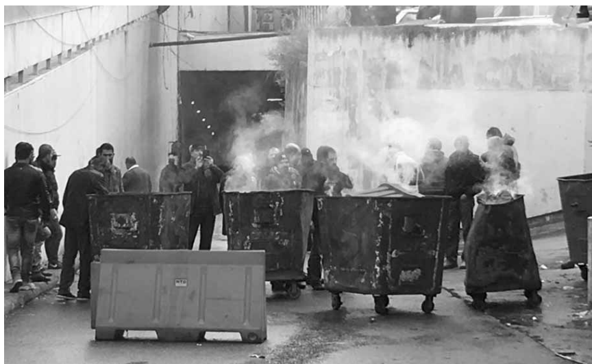
المياومون يحرقون الدواليب

عاد مياومو مؤسسة كهرباء لبنان إلى ساحة التصعيد، احتجاجاً على عدم تحقيق مطالبهم، ونفذوا اليوم اعتصاماً في ساحة رياض الصلح وقطعوا الطريق لبعض الوقت. ثم عادوا إلى حرم المؤسسة وحرقوا مستوعبات النفايات، وجالوا في مكاتب الموظفين طالبين منهم المغادرة.