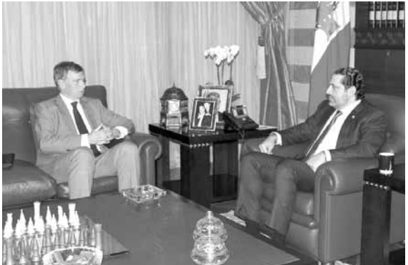
الحريري مجتمعا مع شورتر

استقبل رئيس مجلس الوزراء سعد الحريري مساء امس في «بيت الوسط»، السفير البريطاني في لبنان هيوجو شورتر الذي قال على الأثر: «بحثنا خلال اللقاء في المؤتمرات المقبلة لدعم أمن وازدهار لبنان. فبريطانيا هي أحد أكبر الداعمين للبنان من حيث «شراكتنا» الأمنية والمساعدات التي تقدمها. وأنا أتطلع لمواصلة هذه الشراكة في إطار قرارات الأمم المتحدة ذات الصلة وبيان مجموعة الدعم الدولية للبنان، كما ناقشنا أيضا مسألة الانتخابات النيابية المقبلة، التي يبقى من الضروري جدا أن تجري في موعدها المحدد. وقد أكدت للحريري، الرغبة في تأمين العدد الكافي من النساء المرشحات على لوائح التيار، من أجل ضمان زيادة تمثيل المرأة في مجلس النواب».