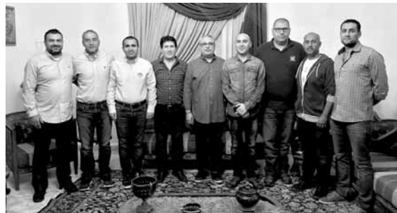
اللجنة الادارية الجديدة لنادي الشباب البترون

الغاني الجاري في تمام الساعة ٦ مساءً ويتخلل الافتتاح عروضاً مختلفة للالعاب الرياضية. والمرحلة الثانية تتضمن السعي لانهاء وانجاز ورشة اعمال المجمع الرياضي المقل للنادي والتي أشرفت على نهايتها وعلى أمل افتتاحه في هذا العام واستعداداً لاستقبال الفرق والبطولات المحلية لاحقاً وكونه يتضمن ملعباً لكرة السلة والطائرة وبالإضافة لصالات متعددة للتدريب لعدة رياضات.