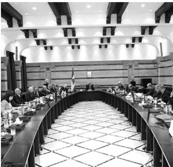
الحريري مترشحا للجلسة

تجاوز مجلس الوزراء قطع «اقتراح تمديد مهلة تسجيل المغتربين الراغبين في المشاركة في الانتخابات النيابية»، ففي ظل الشرخ العمودي حيال المسألة بين فريق التيار الوطني الحر من جهة وحركة أمل ومعها معظم مكونات ٨ آذار من جهة أخرى، سحب رئيس الحكومة سعد الحريري فتيل تفجير الحكومة، بسحبه البند ٢٤ المتعلق بالتعديل المذكور، من جدول أعمال مجلس الوزراء، وتقررت إحالته الى اللجنة الوزارية المختصة المتوقع ان تجتمع الاثنين المقبل، للبت به. وكان الرئيس الحريري مهَّد لخطوته، بمدخلته في مستهل الجلسة التي سعت الى تهدئة الأجواء وتفسيح الاحتقان وقال فيها «من يسعم ما يصدر في وسائل الاعلام من مواقف وتصريحات حادة بخصوص ما يطرح من مواضيع وملفات في مجلس الوزراء، يعتقد أن هناك مشكلا معقدا في ما بيننا وانا على خلاف، ولكن الحقيقة والواقع غير ذلك تماما». واذ اشار الى «أنا لسنا فريقا سياسيا واحدا وهناك جهات نظر مختلفة»، ولفت الى أن «هناك امورا تتطلب حولا قبل الأخرى»، تمنى على «الجميع التروي وتهذئة المواقف السياسية وكل الامور المطروحة يمكن ايجاد الحلول لها من خلال التحاور والنقاش الهادئ، وليس بانتهاج المواقف الحادة».