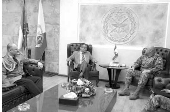
قائد الجيش مستقبلاً هوث

استقبل قائد الجيش العماد جوزاف عون في مكتبه في البرزة، السفير الألماني مارتن هوث يرافقه الملحق العسكري المقدم ريتشارد فون ستيتين، وجرى البحث في الأوضاع العامة في لبنان والمنطقة وعلاقات التعاون بين الجيش اللبناني وجيشي البلدين.