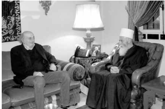
جنبلاط مستقبلا حسن

استقبل رئيس «اللقاء الديمقراطي» النائب وليد جنبلاط في دارته في كليمنصو مساء امس، شيخ عقل طائفة الموحدين الدروز نعيم حسن وعرض معه الأوضاع الراهنة.