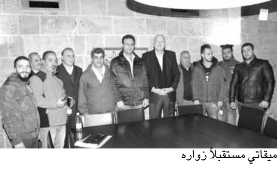
ميفاتي مستقبلاً زواره

إستغرب الرئيس نجيب ميفاتي امام زواره في طرابلس، عودة الحديث عن طلب تعديل قانون الانتخاب من قبل الحكومة بدل الانصراف الى استكمال الاجراءات الانتخابية وفي مقدمها شرح تفاصيل العملية الانتخابية للبنانيين، وقال: «كانه لا يكفيننا السجل الحاصل حول توقيع مرسوم الضباط حتى اطلت علينا الحكومة بمشروع خلافي جديد يتعلق بمشروع قانون معجل يرمي الى تعديل بعض المهل المحوطة في قانون الانتخاب لجهة اقتراع المغتربين. وهذا الطرح من شأنه ان يفتح الباب امام طروحات مضادة لتعديلات على قانون الانتخاب، وبالتالي ادخال اللبنانيين في دوامة جديدة من الخلافات بدل الانصراف الى معالجة الملفات المالية والاقتصادية والادارية الضاغطة». واعتبر «ان ما يحصل يطلق اشارات جدية حول محاولات منجدة لتأجيل الانتخابات على رغم تكرار الازمة الحكومية حول حصول الانتخابات في موعدها، كما انه يوحي ان الخلاف داخل مكونات الحكومة أخذ في التصاعد، لا سيما مع انكفاء رئيس الحكومة عن القيام بمبادرة قبل انه سيطلقها لحل الخلاف حول مرسوم الضباط»، مضيفا «نحن ننتطق في عملنا من مبدأ ان الانتخابات حاصلة في موعدها ونستكمل كل الاتصالات في شأن اللائحة ونخوضوها على اساسها، ولسنا معنيين بكل التسريبات التي تطلق من هنا وهناك. نحن من نقرر موعد الاعلان عن خطواتنا في الوقت المناسب، ولاحد يمكنه التأثير على قرارنا بموقف من هنا وتسريبه من هناك، ولنا مء الثقة باهلنا ومحبينا الذين هم الى جانبنا ونحن على الدوام الى جانبهم». وكان ميفاتي استقبل في دارته في طرابلس، وفودا شعبية ورؤساء بلديات وثقبات وائندية رياضية.