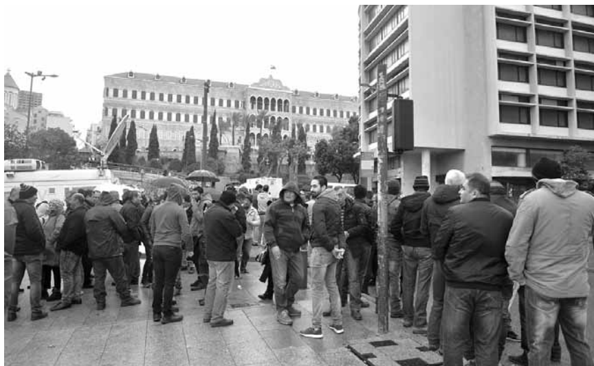
الاعتصام امام السراي