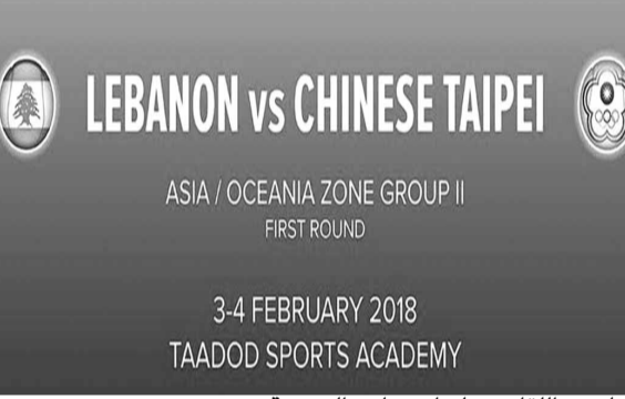
ملصق اللقاء بين لبنان وتاييه الصينية