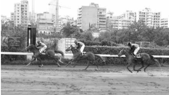
جياذ الدبغى وصلت الى الهدف على الشكل التالي: حسام (علاء) لعوب (مبارك) عروس اسمر