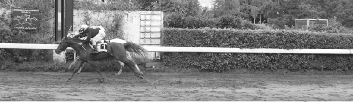
عيق الحوش فائزا على الهوى سلطان بفارق راس قصير