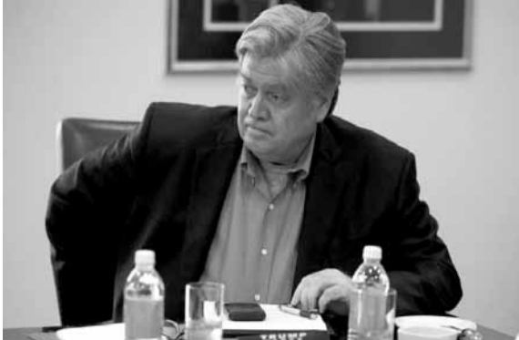
بانون المقر أن يمثل ستيف

بانون كبير المخططين الإستراتيجيين السابق في البيت الأبيض أمام لجنة الاستخبارات في مجلس النواب الأميركي بجلسة مغلقة للتحقيق معه في شبهات تدخل روسيا بالانتخابات الرئاسية عام ٢٠١٦.