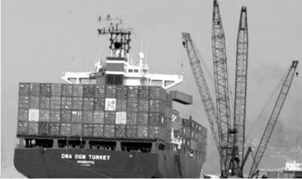
تراجع الصادرات الصناعية

في العام ١٩٥٦ صدر قانون بسيط من خمسة اسطر بتطبيق التسرية المصرفية في لبنان مما ادى الى انعاش القطاع المصرفي، وبالتالي تمنى ضمن اطار خطة مازنكي و غيرها ان نضع المميزات التفضلية التي نريد ان نعطيها للبنان، لا يمكننا ان ندير الاقتصاد دون ان نتطلع الى الادوار التي تتخذها الدول الاخرى المجاورة كقبرص ومالطا ودبي التي