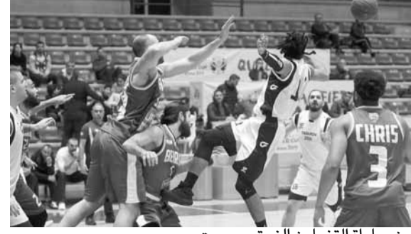
من مباراة التضامن الزرق وبيروت

فاز بيروت على مضيفة التضامن الزرق (٧٧-٧٠)، في المباراة التي جرت أمس الثلاثاء على ملعب مجمع نهاد نوفل الرياضي - المسرحي في زوق مكابيل، ضمن المرحلة السابعة إياباً من بطولة لبنان في كرة السلة للرجال لأندية الدرجة الأولى.