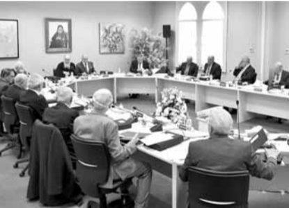
يوحنا يترأس اجتماع مجلس اماناء جامعة البلمند

إتقام مجلس اماناء جامعة البلمند في حرم الجامعة الرئيسي - الكورة، في قاعة اجتماعات مبنى الزاخم، برئاسة بطريرك انطاكية وسائر المشرق للروم الأرثوذكس يوحنا العاشر يازجي وحضور الأمانة.