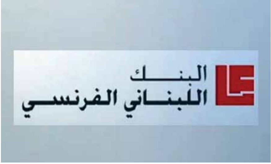
لوغو البنك اللبناني الفرنسي

مجلس ادارة البنك اللبناني الفرنسي عدم فتح فرع للمصرف اللبناني الفرنسي في العراق. لكن ابنة المرحوم الوزير فريد روفال التي هي رئيسة مجلس الادارة اصرت على القرار وقام مجلس الادارة بمسارعتها، لكن النتائج ليست مرضية وان فتح فرع لمصرف لبناني في بلد مختور وفيه حروب ووجود مثل تنظيم داعش وجبهة النصرة وحرب كردية عربية ودخول ايران الى العراق لا يجب ان يتم فتح فرع لمصرف لبناني في بلد مثل العراق حيث الحروب جارية وحيث المخاطر كثيرة وكبيرة وحيث النتائج غير مضمونة، وهذا ما حصل معنا.