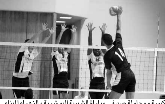
كبسة ومحاولة صد في مباراة الشبيبة البوشرية والزهاء الميناء

حققت الشبيبة البوشرية فوزاً لافتاً على ضيفه الزهاء الميناء القوي (٣-٢٥) و(١٩-٢٥) و(٢١-٢٥) في المباراة المخيرة التي جرت أمس الثلاثاء على ملعب مجمع ميشال المر، ضمن المرحلة الرابعة من بطولة لبنان في الكرة الطائرة للرجال لأندية الدرجة الأولى.