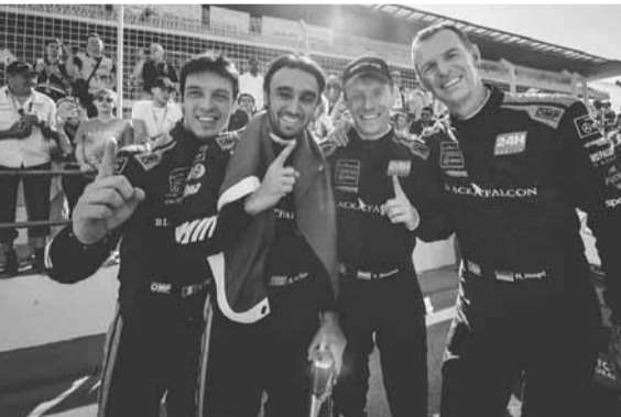
الفريق الفائز وبدا الفيصل الثاني من اليسار

قال: «أوجه الشكر إلى فريقتي وإلى زملائي، لقد قام الجميع بعمل رائع. إنني أخوض المنافسة منذ ١١ عاماً، وما أنا أخيراً أحز للقب للمرة الثانية».