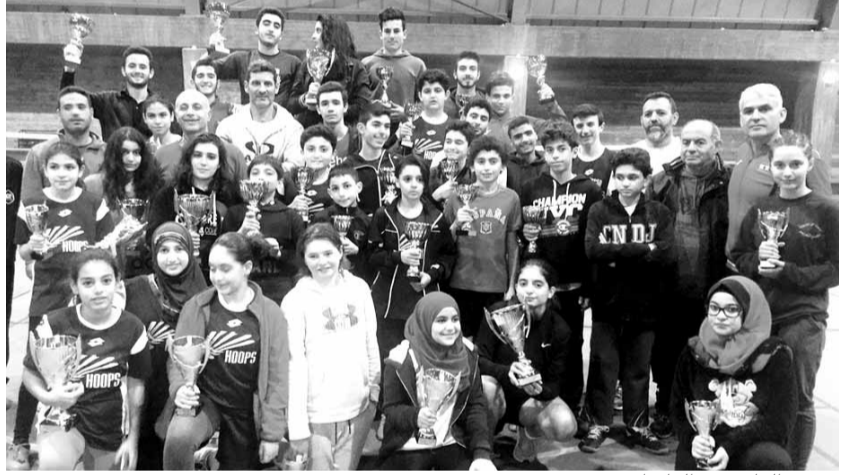
تتويج الفائزين والفائزات