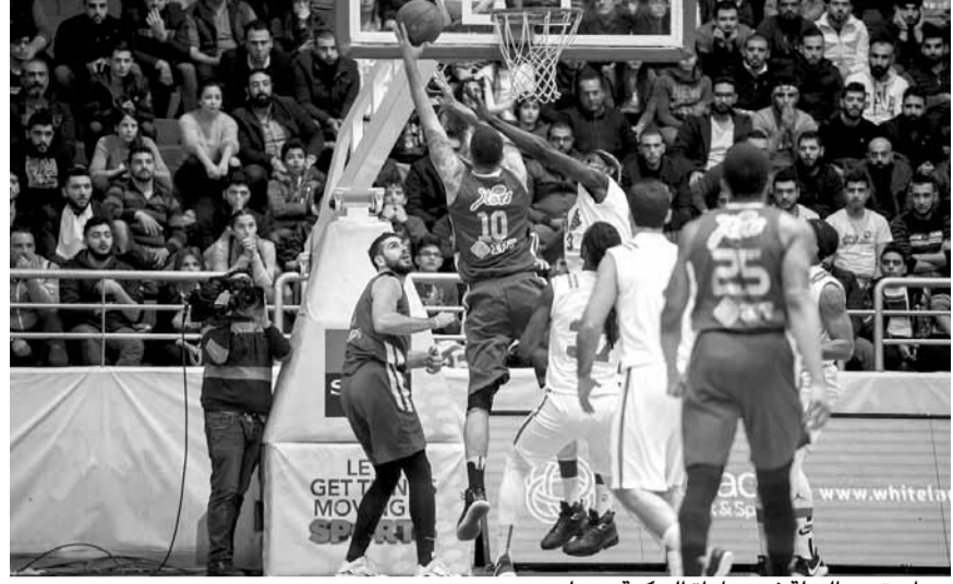
صراع تحت السلة في مباراة الحكمة وبيبلوس

ضم فريق الحكمة ضيفه بيبيلوس إلى قائمة ضحاياه، بفوزه عليه بفارق ٧ نقاط (٨٩-٨٢)، في المباراة التي جمعتهما في قاعة النادي الرياضي غزير، في ختام مسابريات المرحلة ١٥ (السادسة أياً) من الدوري اللبناني في كرة السلة. انتهت الرباع لمصلحة الفائز كالتالي: (٢٤-١٨) و(١٣-١٩) و(٣٨-٢٢) و(١٤-٢٣).