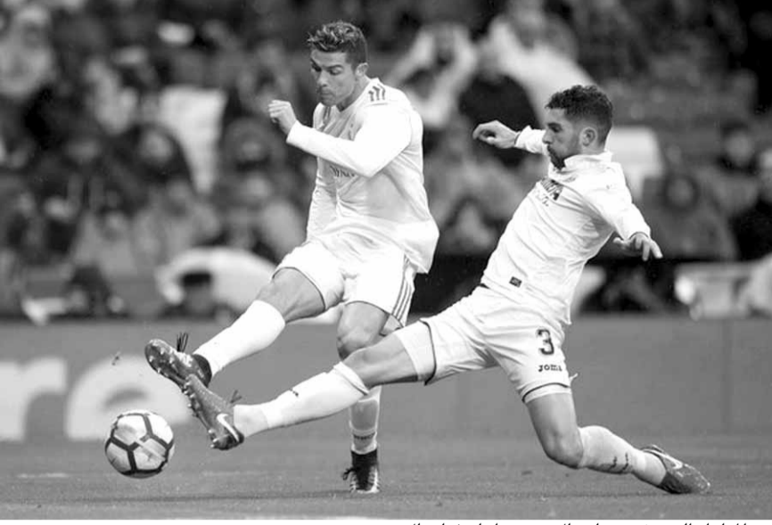
من المباراة التي خسرها ريال مدريد امام فياريال

تكسب غضب لاعبين في مركزين مهمين في الفريق، الحارس والهداف..