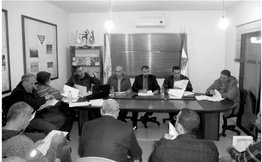
خلال جلسة الجمعية العمومية