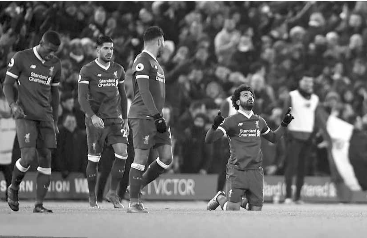
فرحة محمد صلاح بهدفه في مرمى مانشستر سيتي

ودخل سانت اتيان إلى اللقاء وهو يبحث عن فوزه الأول منذ ١٤ تشرين الثاني الماضي حين تغلب على ضيفه منزلاً (٣-١)، ونجح في تحقيق مبتغاه بقيادة مدربه الجديد جان لوي غاسيه، وذلك بفضل السلوفيني روبرت بيرييتش والبديل السنغالي حسن ديوسيه اللذين سجلا الهدفين (٤٥) من ركلة جزاء و٨٦ على التوالي.