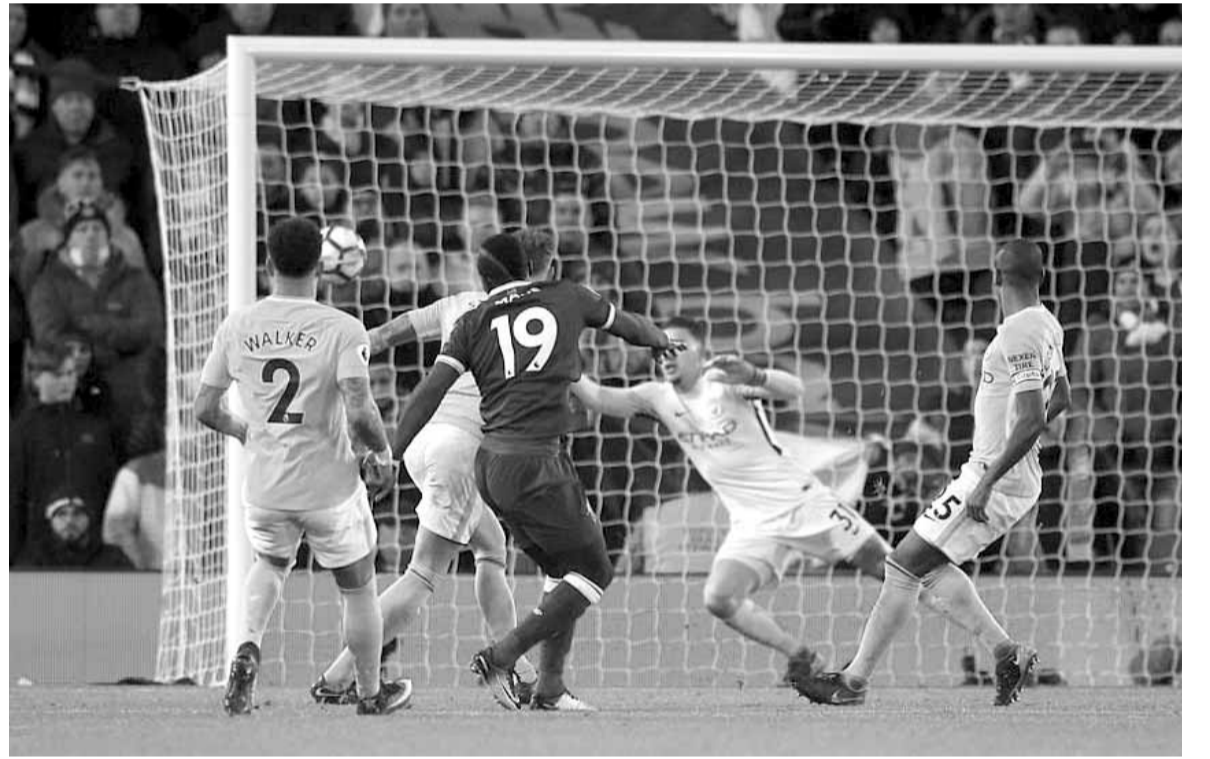
ساديو ماني يسجل هدف ليفربول الثالث

افتتح سيتي الشوط الثاني، برأسية من نيكولاس أوتامندي هزت العارضة، في الدقيقة ٥٢، ثم شن ليفربول بعدهما هجوماً ضاعفاً، على مرمى منافسه، أسفر عن ٣ أهداف سريعة. الهدف الثاني ليفربول جاء في الدقيقة ٥٩، عندما مرر تشامبرلين الكرة إلى فيرمينو، الذي تخلّص بطريقة بدنية من جون ستونز، قبل أن يسدّد من فوق الحارس إيديرسون، لتصلطم الكرة بالقائم وتدخل المرمى.