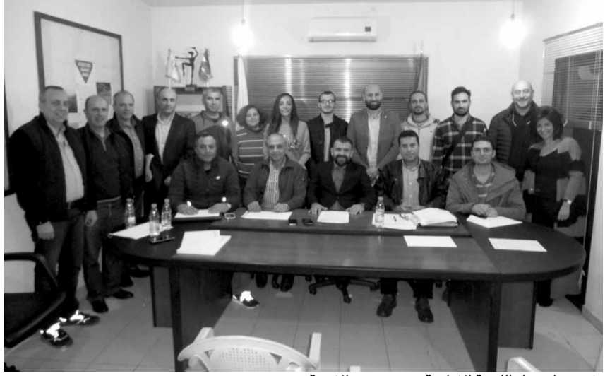
رئيس واعضاء اللجنة الادارية مع مندوبي الاندية