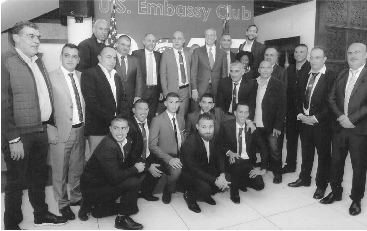
الجمهور الرياضي محاطين بالقائم بالأعمال الأميركي ورئيس أسعد النخل