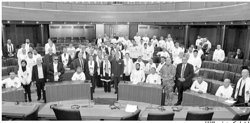
المشاركون في اللقاء

ورصد الموازنة المطلوبة له لدعم الاشخاص ذوي الحاجات الخاصة في المجالات كافة، واصدار المراسيم التطبيقية الخاصة بتنفيذها. بدورها، أشارت سفيرة الاتحاد الأوروبي في لبنان فرانسيسكا فارليزي الى ان «الدعم المالي لا يكفي فضحايا الاوغلام يحتاجون لمتابعة ورعاية دائمة. ولبنان مدعو لزيادة وتعزيز مشاركة ذوي الإعاقة في سوق العمل والقيام بتدريبهم وافساح المجال امام مشاركتهم الفاعلة في المجتمع».