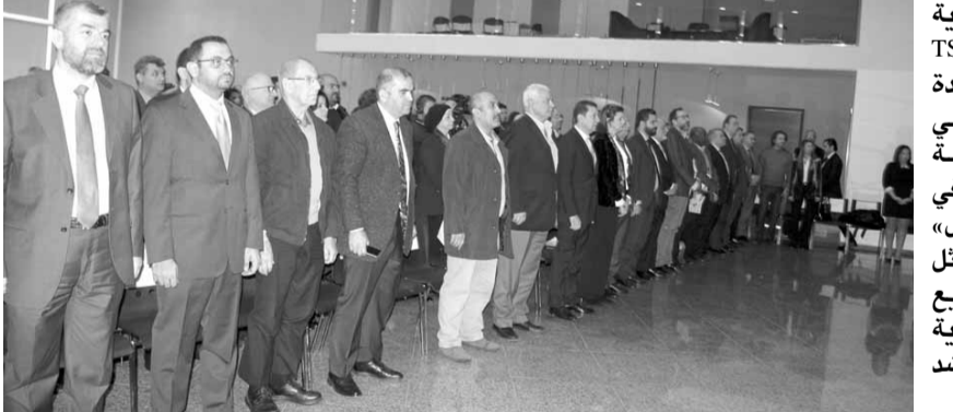
وأشار نقيب المهندسين بسام افتتاح الندوة

بقطاعات جديدة غير تقليدية وبالتالي المطلوب إيجاد مهارات يمكن أن تكون غير متوفرة بأعداد كافية في سوق العمل الشمالي. ومن هنا قمنا بتخصير هذه الدراسة التي ستعرض نتائجها عليكم اليوم لتبيان الحاجات الفعلية للمهارات والكفاءات المستقبلية المطلوبة بناء على قطاعات بينتها دراسة الجدوى التي حضرناها وهي القطاعات الجاذبة للاستثمار في المنطقة الاقتصادية مثل الصناعات الكيماوية والمغروشات والمنتجات المعدنية والكهربائية وتكنولوجيا المعلومات والاتصالات وغيرها».