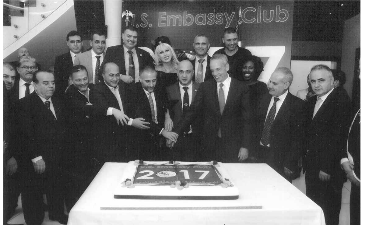
ثناء قطع قالب المناسبة مع القائم بالأعمال الأميركية ممثلة السفيرة اليزابيث ريتشارد ادوار وايت ورئيس أسعد النخل والشخصيات والليدي مادونا