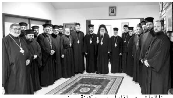
يوحنا العاشر في لقاء ابوي مع كهنة سديني

استهل بطريرك انطاكية وسائر المشرق للروم الارثوذكس يوحنا العاشر أولى مسحطات زيارته التاريخية الرعوية إلى أستراليا بقاء أبوي عقده مع كهنة سديني في دار المطرانية، في حضور المترولوجيت باسيليوس قدسية المطران الجديد على أبرشية أستراليا ونيوزيلندا والقيبيين، والوفد الكنسي المرافق والكهنة البالغ عددهم ١٥ كاهنا يخدمون في رعيا سديني. أشار يوحنا العاشر إلى أن «مسؤولية الكهنة اليوم هي مسؤولية كبيرة، لا سيما أن أبناء كرسينا الانطاكي باتوا قاطنين في كل أنحاء العالم يمدون جسر الروابط ما بين الشرق والغرب، وبالتالي فإن مسؤولية الكاهن اليوم هي مسؤولية تقضي بالعمل على تحفيز أبناء الكنيسة بتسكهم بقيمتهم وتعاليمهم وتقاليدهم الكنسية من أجل ان تبقى الكنيسة الانطاكية الصوت المدوي في كل اصقاع العالم». كما تطرق الى الأوضاع السائدة في المنطقة ولا سيما الى ملف الهجرة الدامي، مؤكداً أن «تزييف الهجرة هو تزييف قاس لكن ما يميزنا ان أبناء الكنيسة وبالرغم من كل تهجير وقساوة الايام، ما زالوا يبحثون عن كنيسة، يبحثون عن المنجى الدافء والحنن السلامي الذي يعطيهم الأمان والسلام الخلاصي»، لافتاً الى أن «أبناء الكنيسة