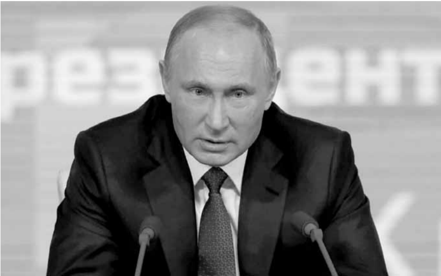
الرئيس فلاديمير بوتين خلال مؤتمر صحفي في موسكو