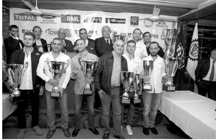
أبطال الراليات وملاوهم مع المشنوق والرئيسي والخازن وكرم

وزّع النادي اللبناني للسيارات والسياحة كؤوسه وجوائزه على أبطال الرياضة الميكانيكية بطولات العام ٢٠١٧ خلال حفله السنوي الذي اقامه في مقره بالكسليك برعاية رئيس الجمهورية العماد ميشال عون. تقدم الحضور وزير الداخلية والبلديات نهاد المشنوق ممثلاً راعي الحفل، العقيد وسام الراسي ممثلاً قائد الجيش اللبناني العماد جوزيف عون، ورئيس النادي المضيف الشيخ فؤاد الخازن، نائبه نبيل كرم، أمين عام النادي كميل اده، أمين المال جيلبير مسيسي وعضء مجلس الإدارة، ممثلو المؤسسات الإنسانية، ممثلو الشركات الراعية، عائلة الرياضة الميكانيكية وحشد من رجال الصحافة والإعلام.