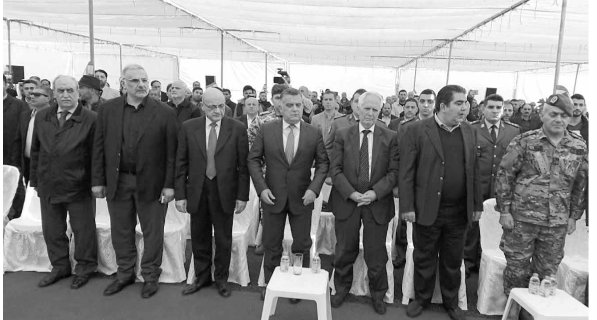
اللواء ابراهيم خلال افتتاح المعبر