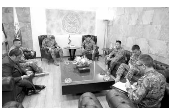
نائب وزير الدفاع الكازاخستاني عند قائد الجيش

استقبل قائد الجيش العماد جوزاف عون في مكتبه في البرزة، نائب وزير الدفاع الكازاخستاني اللواء Talgat MUKHGTAROV على رأس وفد مرافق بحضور السفير الكازاخستاني B.OMAROV، وتناول البحث الأوضاع العامة في لبنان والمنطقة وسبل تعزيز علاقات التعاون بين جيشي البلدين. كما استقبل وفداً من فعاليات مدينة صور وضواحيها، ثم كميل دوري شمعون، وجرى التداول في شؤون مختلفة.