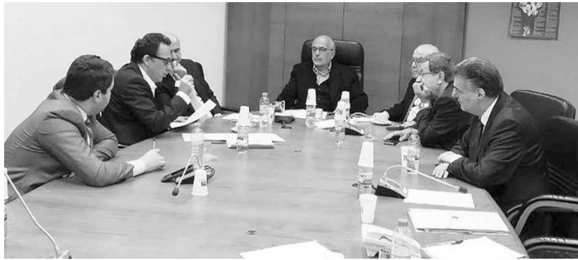
اللجنة مجتمعة بلا نصاب

اما موضوع الازمة مستجدة وقريبة من اجل ذلك نطلب منها بسرعة والحل المطروح جيد جدا ونحن مع هذا الحل ولكن يجب ان يكون متناسبا مع كمية النفايات التي تلم من السوق متمنيا على الحكومة ان تعقد جلسة مخصصة للبت بموضوع ازمة النفايات وهكذا يعرف المواطن الى اين ذاهب. من ناحيته، قال شهيبي: «التوسعة تساوي ضم ما بقي من قضاءي الشوف وعاليه الى الحل وان تكون التوسعة تضر منطقة على حساب اخرى».