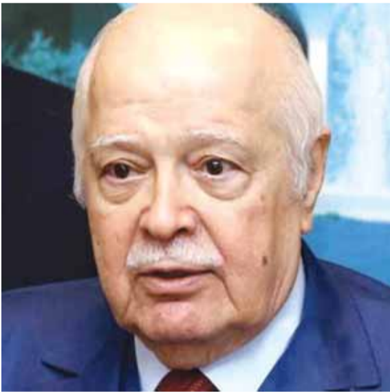
الرئيس عصام فارس

صدر العدد الأخير من مجلة الصياد وتم اختيار دولة الرئيس عصام فارس «رجل العام، وكل الأعوام»، تقديراً لمنجزاته ومبادراته ومواقفه من أجل بناء الدولة الحديثة والنهوض الاقتصادي والاجتماعي والتربوي والاداري والائتماني في الداخل، وإكباراً لدوره في حمل «الوطن الصغير الى العالم الكبير» على نحو ما هو مفصل في كتاب «عصام فارس وبناء الدولة الحديثة» للدكتور مناصف منصور.