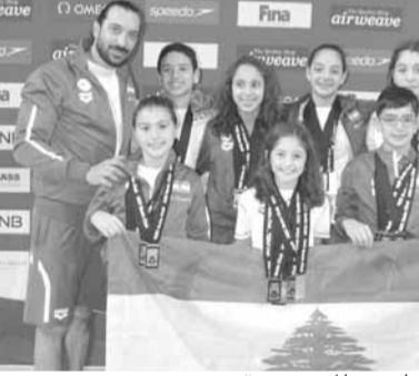
أبطال وبطلات النجاح مع المدرب صقر

يواصل سباحو وسباحات نادي النجاح - بيروت تألقهم في شتى المحافل الرياضية الدولية، فينتقلون من «نجاح» إلى آخر، رافعين اسم لبنان وحاصلين الألقاب والميداليات. وآخر نشاطات نادي النجاح، مشاركة في بطولة قطر الدولية ((H2O)) ببعثة مؤلفة من ٨ سباحين وسباحات برئاسة المدرب