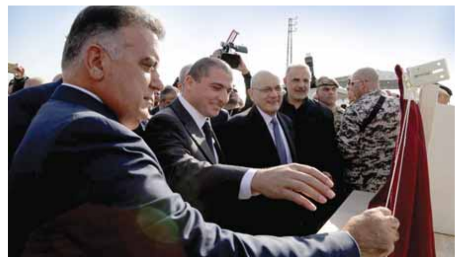
اللواء عباس إبراهيم يفتتح معبر جوسيه