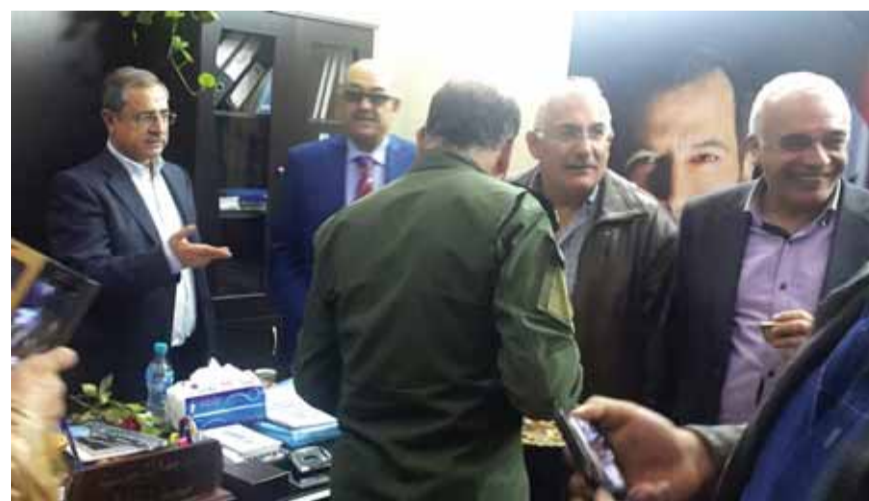
اللواء الشعار يفتتح المعبر من الجهة السورية