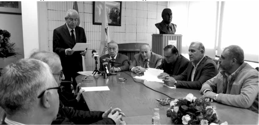
خلال اعلان التوصيات

بالتعاون مع وزارة الصحة العامة والصندوق الوطني لضمان الاجتماعي وتعاونية موظفي الدولة لتوحيد تعرفه العمل الطبي وافادة الصناديق التعاضدية من التعريفات المطبقة مع نقابتي اطباء والمستشفيات، ومتابعة المساعي لاقرار مشروع تعديل بعض المواد في المرسوم ٣٥/٧٧ والإفادة من دعم وزير الصحة بهذا الخصوص، والإفادة من تجربة وخبرة التعاضديات الفرنسية المطبقة منذ أكثر من مائة عام في مجال التغطية الطبية والاستشفائية تبعاً لبروتوكول التعاون الموقع بيننا بهدف تطوير العمل الإداري التعاضدي خصوصاً في مجال اعتماد نظام وقف الخضارة المشترك F de G والبدء بـ تنفيذ برامج التدريب العلمية الادارية المشتركة لمسؤولي الصناديق وغيرهم من المهتمين وذلك بالتنسيق مع جامعات متخصصة وبالتعاون مع الصندوق التعاضدي CMMS.