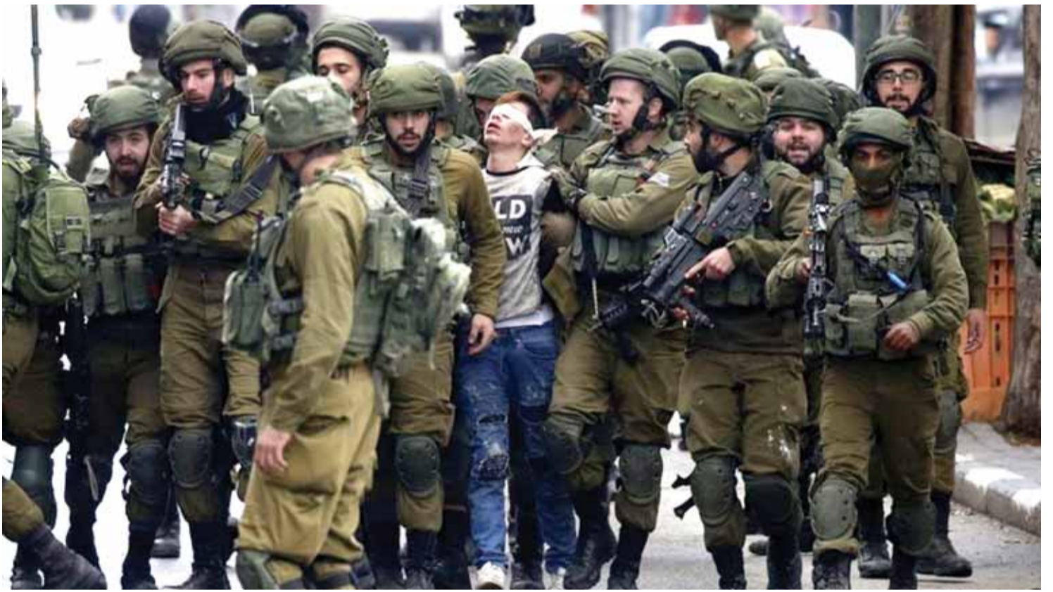
جنود الاحتلال يعتقلون طفلا بعد انتزاعه من امه

بالصدور العارية بالنساء اللواتي حملن اطفالهن في شوارع القدس القديمة، بالمقدسيين والمقدسيات الذين تظاهروا من المسجد الأقصى الى كنيسة القيامة الى مسجد قبة الصخرة، الى جبل الزيتون وموقع صلب السيد المسيح، تحصل انتفاضة كبرى في القدس المحتلة ضد العدو الإسرائيلي. ومن القدس الى رام الله، حيث هناك على مقربة من رام الله القيادة العسكرية التي تحمك الضفة الغربية المحتلة من فلسطين، قام الشبان العرب وحتى الأطفال في سن العاشرة والتاسعة بالتظاهر وهاجموا مركز القيادة العسكرية الإسرائيلية، ووصلوا الى مسافة عشرات الأمتار من القيادة الإسرائيلية، حتى وصل الامر بجيش الاحتلال الإسرائيلي الى ارسال قوة إضافية من ٤٠٠ جندي إسرائيلي وضابط للهجوم على الشبان واطلاق الرصاص المطاطي والرصاص الحي