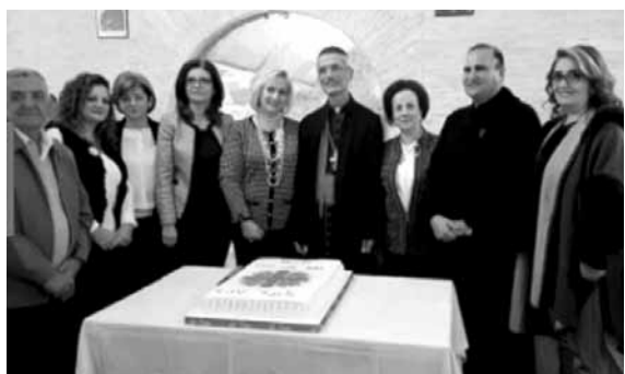
خلال قطع قالب الحلوى