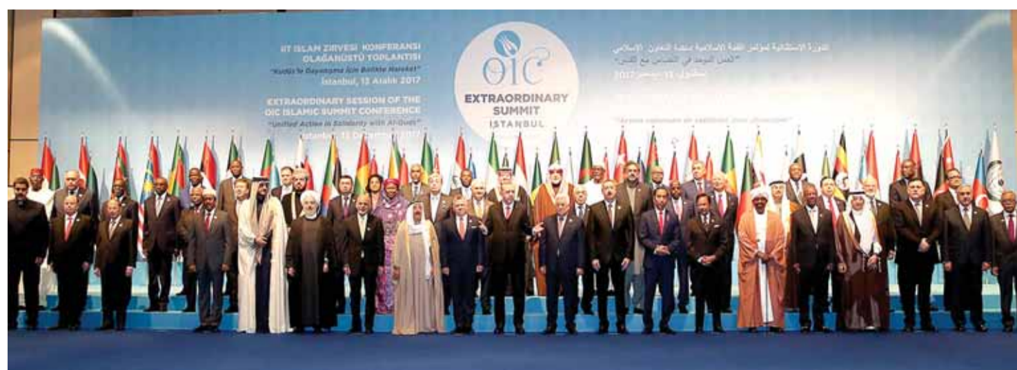
المشاركين في مؤتمر اسطنبول

وتأخذ فقرات من خطاب رئيس الجمهورية اللبنانية العماد ميشال عون، حيث قال ان الإسرائيليين مارسوا ابشع أنواع