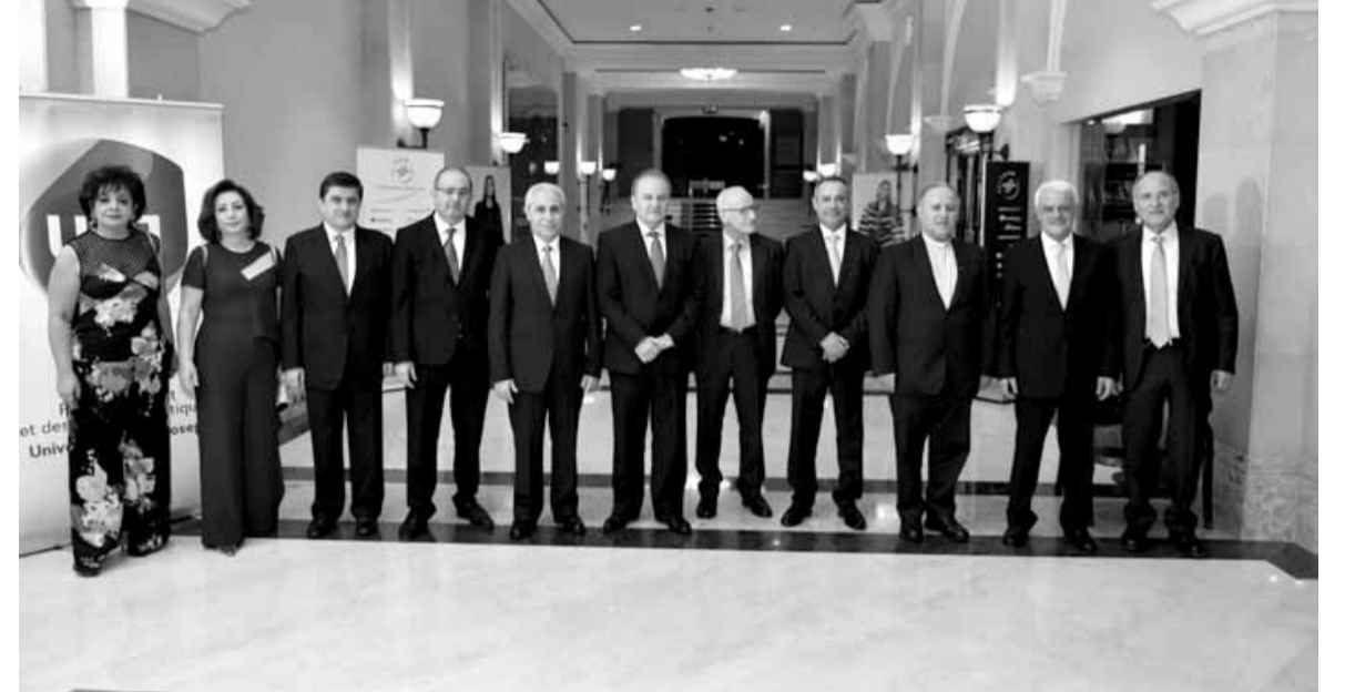
اعضاء الهيئة الادارية يستقبلون رئيس الجامعة اليسوعية الاب دكايش