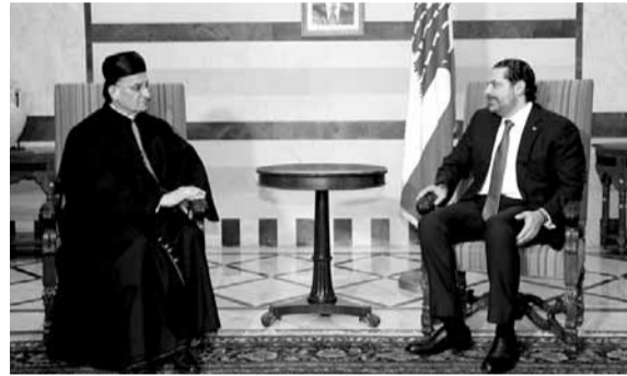
الراعي يزور الحريري

أكد البطريك الماروني الكاردينال مار بشارة بطرس الراعي في تصريح له بعد لقائه رئيس مجلس الوزراء سعد الحريري في السراي الحكومي «أننا نؤيد الحريري وندعمه، ووجوده على رأس الحكومة مهم جداً ويعطي ثقة اللبنانيين وكل لبناني مسؤول باعادة بناء لبنان.»