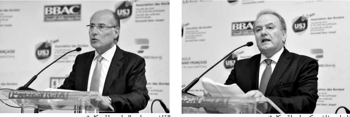
القاضي عباس الحلبي يلقي كلمته