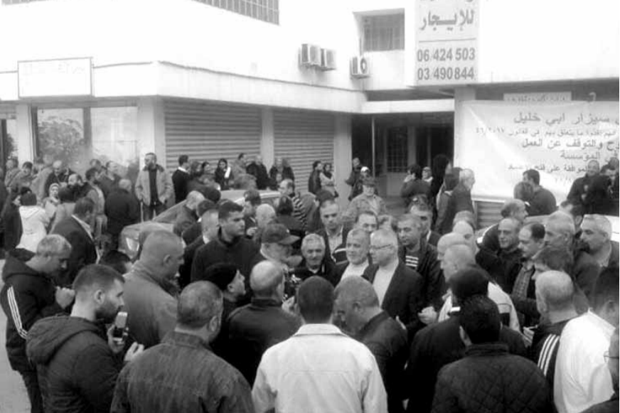
عمال المياه خلال الاعتصام