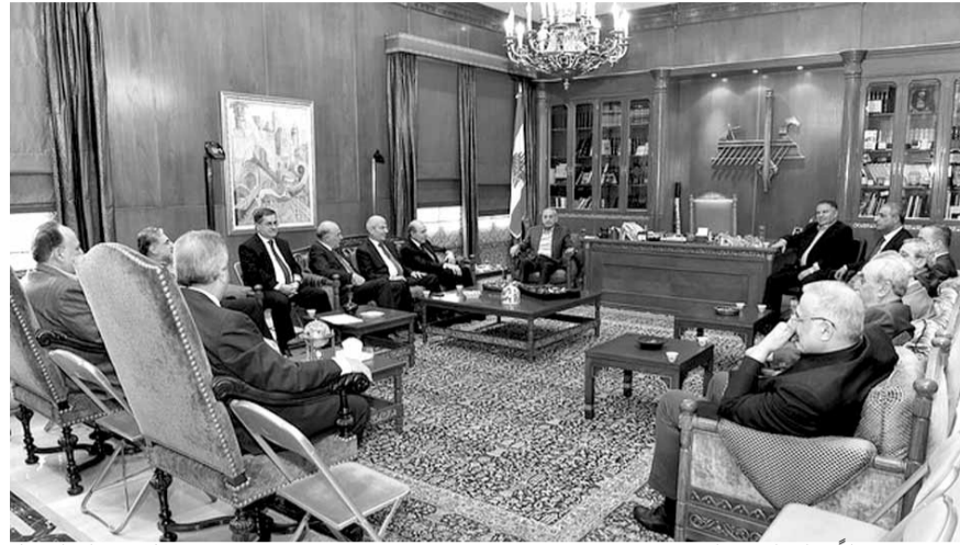
بري مستقبلاً ثواب الأربعاء