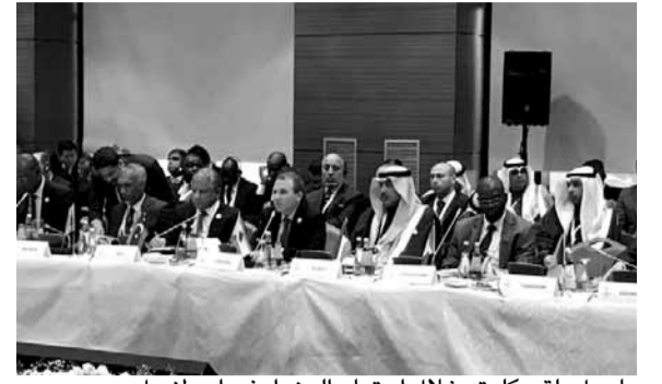
باسيل يلقي كلمته خلال اجتماع الوزراء في اسطنبول

● اعتبر نائب الأمين العام لـ«حزب الله» الشيخ نعيم قاسم، في كلمة القاها في حفل تكريم الأساتذة المتقاعدين في قاعة الجنان في اتحاد بلديات الضاحية، «أنا اليوم أمام مشهد أوجدته الرئيس الأميركي دونالد ترامب في المنطقة وفي العالم، عندما أعلن أن القدس عاصمة الكيان الإسرائيلي، وفوجئ البعض ولكننا لم نفاجأ، بل حمسنا الله كثيراً أن هذا المستور الذي لطالما أخفوه عن الناس لخدايعهم كشفوه فانتكشف..»