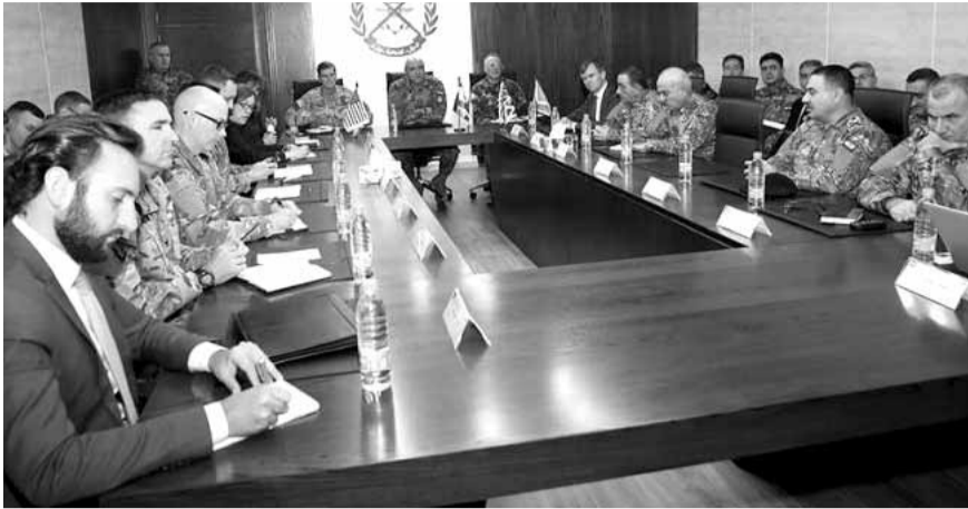
اجتماع بين قائد الجيش والوفد الاميركي

استقبل رئيس مجلس الوزراء سعد الحريري ظهر امس في مكتبه في السراي الحكومي، قائد القيادة المركزية الاميركية في الشرق الاوسط الجنرال جوزف فوتيل في حضور السفيرة الاميركية اليزابيث ريتشارد.