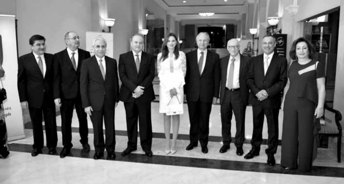
الهيئة الادارية مع معالي النائب محمد الصفدي وعقيلته