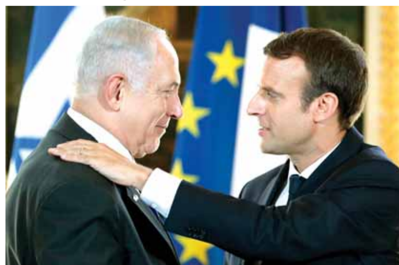
لقاء ماكرون وتنتياهو

واشار الى ان «طهران تحاول اقامة قواعد برية وجوية وبحرية في سوريا لقتال اسرائيل وتدميرها ولن نتساهل في ذلك».