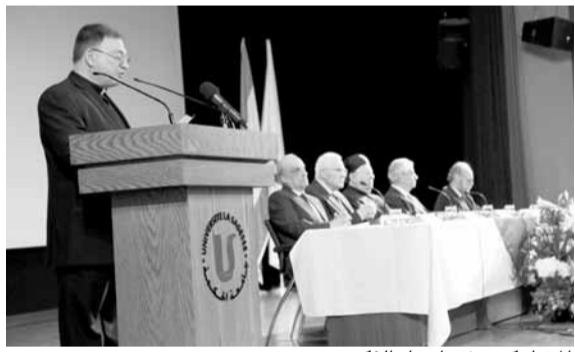
المشاركون في احياء الذكرى

وعاهد مطر، شبلي، بـ «أنا لن نتخلّى عن المعرفة كنزاً ولا عن المحبة سلاماً ولا عن الوطنية الصادقة ببرقاً ما حيننا، إلى أن يصبح الشرق كله منارة إنسانية وصانع رجاء للعالم المحيط. فكن لنا الشفيق والتصير الهادي».