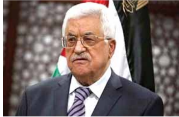
الرئيس محمود عباس