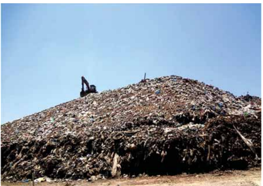
جبل النفايات في طرابلس

على انوفهم لعدم تشنق الرائحة البشعة والمؤذية لهم وهم يتحركون في العاصمة الثانية طرابلس.