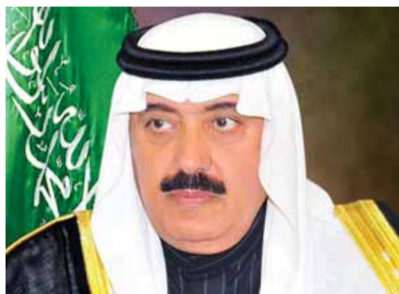
الأمير متعب بن عبد العزيز

قدم الامير متعب بن عبدالله قائد الحرس الوطني سابقاً استقالته الى ولي العهد السعودي وزير الدفاع محمد بن سلمان مرفقة برسالة رحمة طالبا من الملك سلمان الغفران والصفح عنه واخراجه من سجنه في فندق ريتز كارلتون في الرياض، على ان يذهب الى قريته ويقدم في قصره هناك. وقد تعهد الأمير متعب بعدم استقبال اي شخصية سعودية او ضباط من