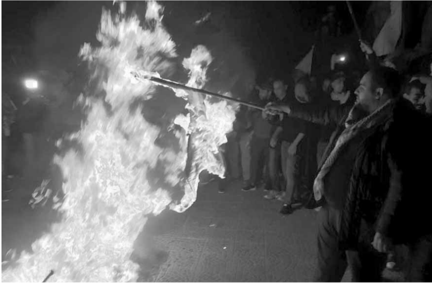
حرق العلم الإسرائيلي في صور

في دارته ببلدة بزعون- الضنية «المطلوب اليوم ليس البكاء والوقوف على الأطلال، بل لن ننفض للذود عن بلادنا».