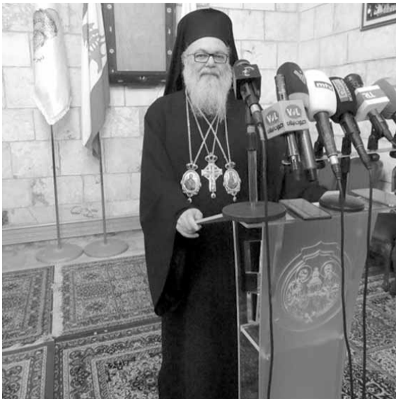
يازجي يلقي كلمته امام الاعلاميين

«لإيجاد الحلول السلمية لما يحدث في سوريا وعلى صون لبنان» يازجي : قرار ترامب يشعل فتيل الحرب ويقتل جميع المحاولات لإيجاد حل للقضية الفلسطينية