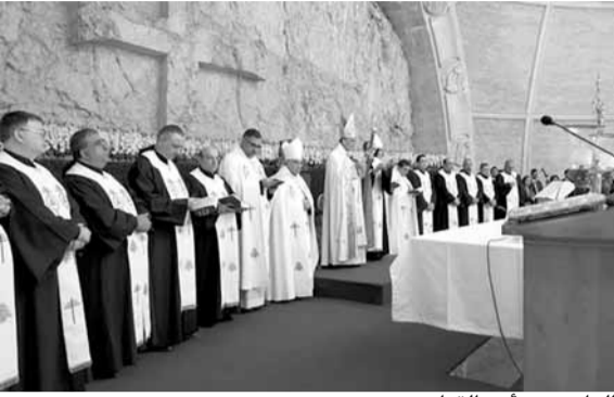
الراعي يترأس القداس

الراعي : قرار ترامب مخالف لقرارات الشرعية الدولية ويهدم جسور السلام بين إسرائيل وفلسطين والدول العربية