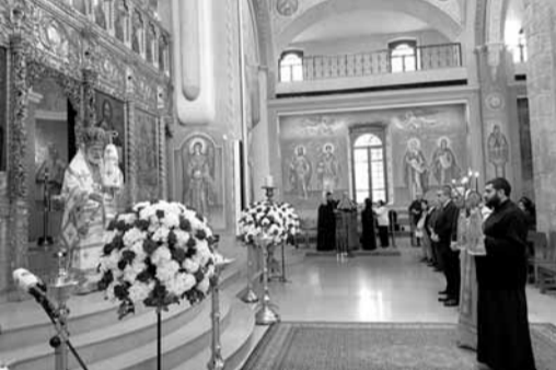
عودة يتراس القداس

بوطن لا يستقوي فيه مواطن مهما علا شأنه على الآخر، ولا يظلم رئيس مرؤوسا، ولا يقدم فيه أتباع الأحزاب على غيرهم بل يحظى الجميع بفرص متكافئة. نحلّم بوطن لا فساد يتغلغل في نفوس أبنائه وحكامهم، ولا كيدية تحكم تصرفاتهم، ولا مصلحة تقود سلوكهم، ولا حقد يملأ قلوبهم ولا ولاه لهم إلا لوطنهم، مضيقاً ما زلنا يا جبران نامل، كما كنت تأمل، أن يحل السلام في الأرجاء وفي القلوب. ولكن بأيّ سلام نحلّم والظلم يسود العالم والأقوى يفرض شروطه على الضعفاء، ومدينة السلام، مدينة النور والصلاة، القدس، مهد الديانات قد أصبحت ورقة يلعب بها الأقوياء ويقتاضون. واخوتنا الفلسطينيون، طيلة سنوات احتلالها، كانوا منشغلين بالتقاتل والتشتات واضهاد بعضهم بعضاً عوض التكاتف والتوحد في وجه العدو المغتصب المدينة المقدسة. والعرب غافلون يتلهون بمشاكلهم».