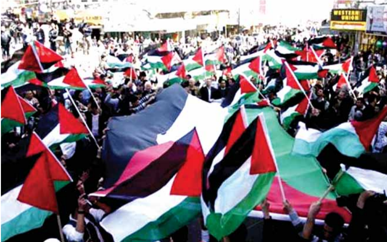
الاعتصامات مستمرة في رام الله