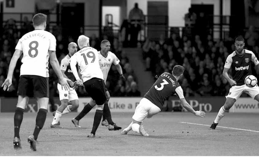
من مباراة واتفورد وست هام

في المقابل، انكس هامبورغ مجددا وخسر للمرة الثامنة هذا الموسم مقابل ٣ انتصارات وتعادل واحد، فتجمد رصيده عند ١٠ نقاط في المركز الخامس عشر.