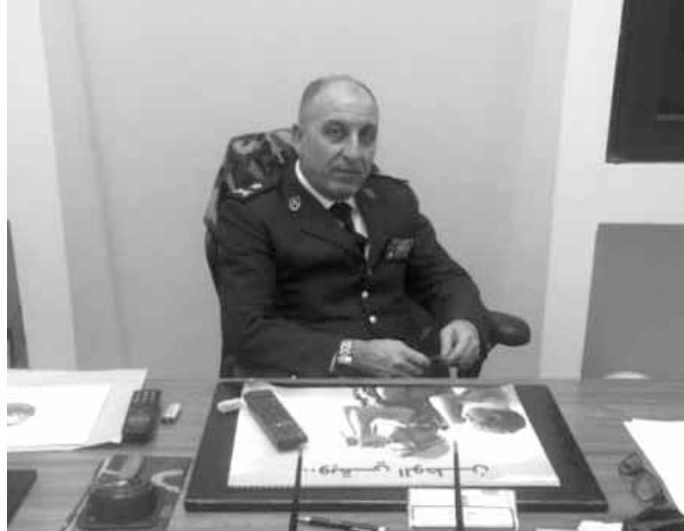
رئيس المركز العالي للرياضة العسكرية العميد جورج الهد