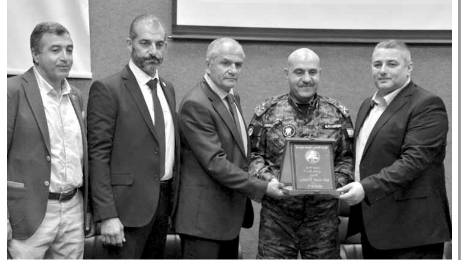
دع تقديرين من فواز ونصير الى العميد الخوري