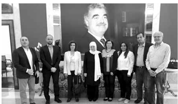
بهية الحريري مستقبلة وفد جمعيات المعوقين

التقى وفد من الإتحاد الوطني لجمعيات الأشخاص المعوقين في لبنان النائب بهية الحريري، حيث عرض الوفد للمصاعب التي تعاني منها الجمعيات في تحقيق الرعاية المستدامة والأمن الاجتماعي لأكثر من ١٢٠٠٠ طفل من ذوي الإعاقة على كامل الأراضي اللبنانية، بسبب عدم تطبيق سعر كلفة يناسب حجم الخدمات المقدمة والتكاليف التي فاقت قدرة الجمعيات على الاستمرار.