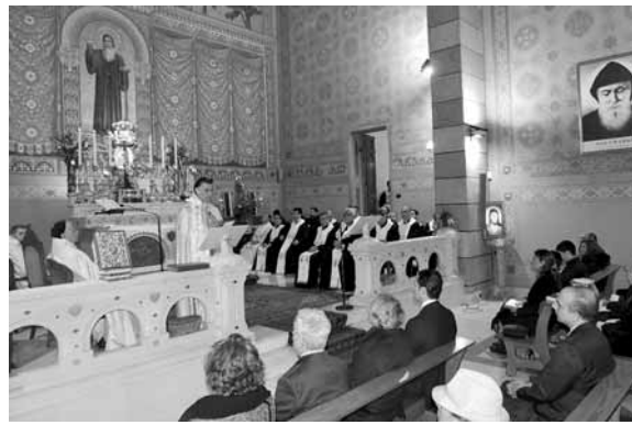
الراعي يترأس القداش في روما

فرحة اللبنانيين تأتي مَزُدوجة، الأولى بالعيد نفسه، والثانية في عودة رئيس مجلس الوزراء الرئيس سعد الحريري بعد فترة اسبوعين كان قد اعضاءها في المملكة العربية السعودية، حيث قدّم من هناك إستقالته..