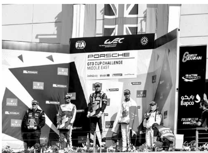
السائق العماني (الى اليمين) على منصة التتويج مع علم بلاده

من السباق ما كلفني خسارة بعض الوقت. ولكني أحرزت المركز الثالث في النهاية». واختتم: «اعتقد بان البطولة ستكون رائعة هذا الموسم. تملؤني الحماسة». وتنتقل البطولة إلى جولتيها الثالثة والرابعة على حلبة دبي أوتودروم في ٨ و ٩ كانون الأول المقبل.