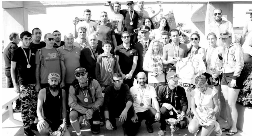
كبار الحضور مع الفائزين والفائزات