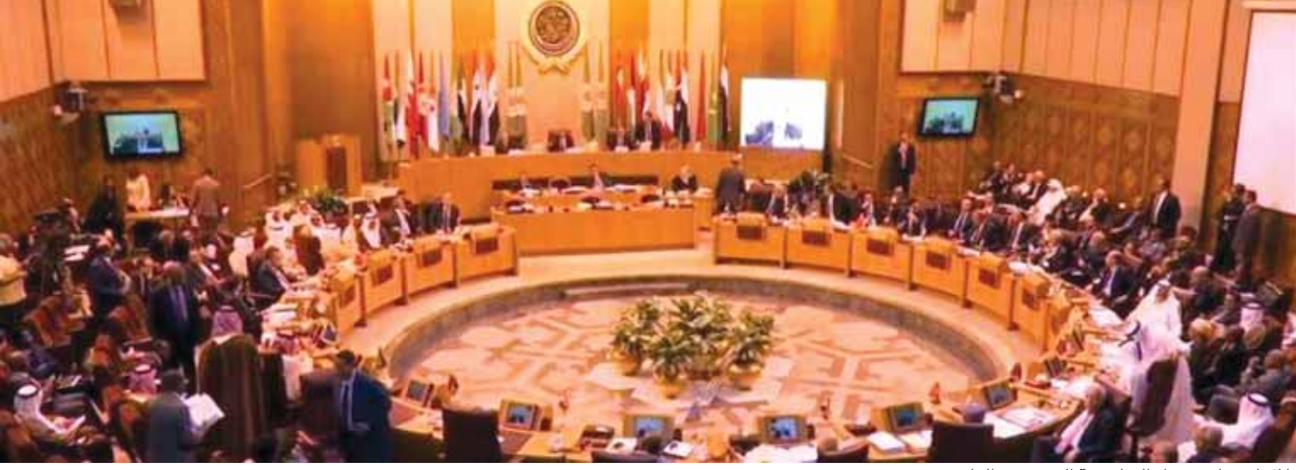
خلال اجتماع وزراء الخارجية العرب في القاهرة

ورفض لبنان تسمية حزب الله بأنه حزب إرهابي. والسؤال الآن هو، ماذا سيكون موقف السعودية، وما هو موقف الرئيس سعد الحريري المستقبل، والجواب يأتي الأسبوع القادم.