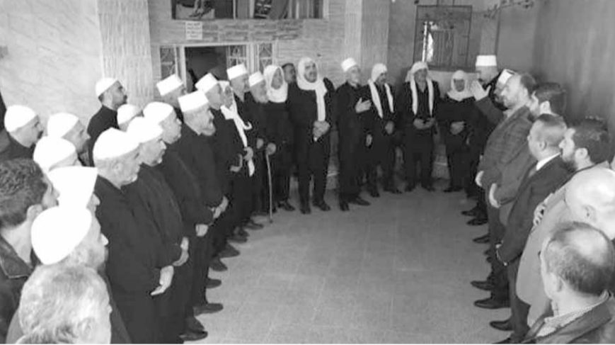
وفد «الديموقراطية» خلال جولته في سوريا

مسعود، ليتنقل بعدها إلى بلدة الريمة حيث قدم التعزية بالمازح شرف نورس جهاد معن، وقال الجوهري: «منذ اليوم الأول للمؤامرة الكونية على سوريا وكان إيمان رئيس حزبنا وقائدنا الأمير طلال يانه لا يمكن لأحد هزيمة سوريا، والنصر سيكون حليفها بكل تأكيد، فكيف لا، وقيادتها الحكيمة يرأسها الرئيس الأسد، وما نحن اليوم وبعد أكثر من ٦ سنوات على هذه المؤامرة مواقف الإنصاف تلو الإنصاف، وبجهود الجيش السوري والحلفاء، يتم دحر الإرهاب والإرهابيين تباعسا عن الأراضي السورية».