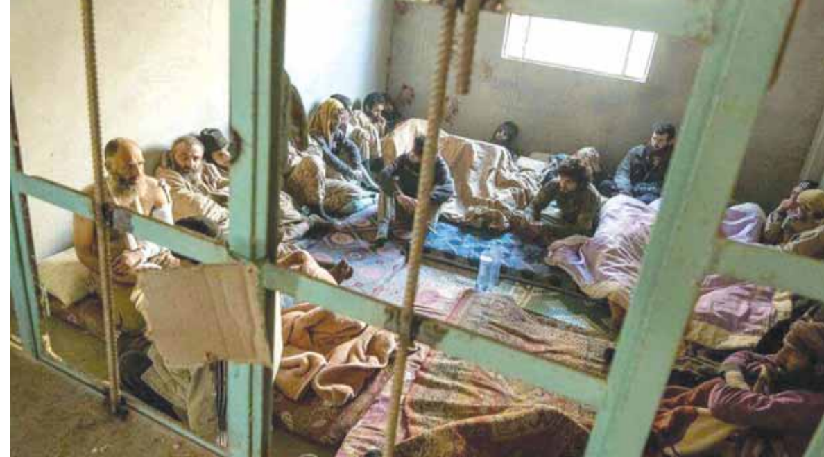
أسرى داعش في قبضة الجيش السوري وحزب الله في البوكمال

تواصلت المعارك العنيفة بين الجيش العربي السوري وحلفائه ومسلحي «داعش» في البوكمال، وتستخدم فيها مختلف أنواع الاسلحة المتوافرة لدى الطرفين، كون مدينة البوكمال تعتبر المعقل الأساسي الأخير لـ«داعش» في سوريا، مع وجود جيوب محصنة نسبياً في ريف دمشق ومخيم اليرموك. وقد نفذ الجيش العربي السوري وحلفاؤه هجوماً مضاداً لاستعادة المواقع التي خسروها من «داعش» خلال اليومين الماضيين، وتمكن الجيش السوري من السيطرة على ٩٠٪ من البوكمال وسط حرب (تتمة الخبر السوري ص ١٦)