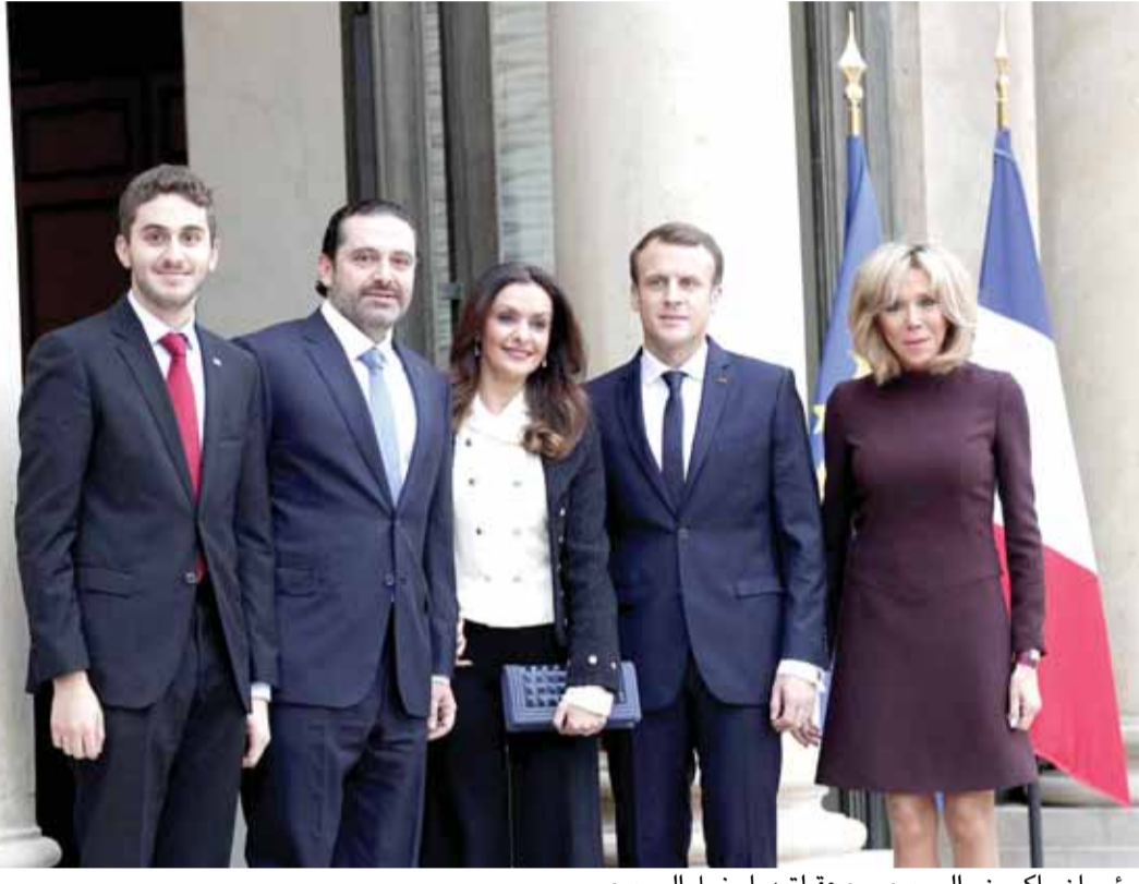
الرئيسان ماكرون والحريري مع عقيلتيهما ونجل الحريري

سافر الرئيس سعد الحريري من الرياض الى باريس بعد جهود فرنسية واتفاق بين الرئيس الفرنسي ماكرون وولي العهد السعودي محمد بن سلمان ووصل الى العاصمة الفرنسية باريس، حيث تم تكريمه بشكل كبير، وأقام له الرئيس الفرنسي مادية غداء. وحصل اجتماع ثنائي بين ماكرون والحريري، حيث عرض الرئيس سعد الحريري موقفه وعرض الرئيس الفرنسي ماكرون رؤيته، وبقيت المعلومات سرية ولم تظهر بعد. اما في بيروت، فينتظر الجميع عودة الرئيس سعد الحريري الذي سيحضر عيد الاستقلال، ويلتقي رئيس الجمهورية العماد ميشال عون ويعلم مواقفه ومطالبه السياسية، سواء بالعودة عن الاستقالة، أم إذا تم تكليفه بعد مشاورات نيابية لتشكيل الحكومة الجديدة. وفي المعلومات، ان الرئيس سعد الحريري يقبل اشتراك حزب الله في الحكومة، اذا وافق على سياسة النأي في النفس. ويأمل الرئيس الفرنسي ماكرون من الرئيس العماد ميشال عون تادية دور بإقناع المقاومة بالنأي في النفس في سوريا والعراق واليمن، وفق مطالب السعودية وموقف الرئيس سعد الحريري بالتحديد، الذي لن يقبل إعادة تكليفه تشكيل الحكومة ما لم يتم القبول بالنأي في النفس. اما بالنسبة الى المقاومة وحزب الله، فإنه يعتبر انه قام بحرب ضد التكفيريين في لبنان وانهى الإرهاب فيه ولكن تحت مظلة الجيش اللبناني والأجهزة الأمنية اللبنانية. ولم يبق أي تحرك عسكري داخلي على الساحة اللبنانية، باستثناء معركة جرود عرسال، التي اشتركت فيها المقاومة على جبهة والجيش اللبناني على جبهة أخرى. وبالنسبة للمطالب التي ينقلها او يطالب بها الرئيس سعد الحريري، فإنه ليس واردا ان ينسحب حزب الله من