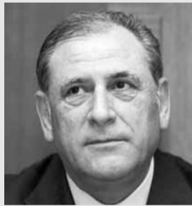
النيابة. ويخلص المصدر الى ان الامر يحتاج الى قرار سياسي وقضائي كبير لحل المشكلة واعادة الامور الى نصابها!!

يؤكد مصدر وزاري ان الخلاف داخل وزارة الاتصالات بين تيار المستقبل من جهة وبين القوى المسيحية الاخرى في ١٤ آذار عنوانه «فساد وفساد»، لكن جوهره الاساسي صراع على الحصص والمغانم الانتخابية لاقتضية في الشمال وكمار ومزايادات مالية وفي الشفافية بين المعنيين داخل اللجان