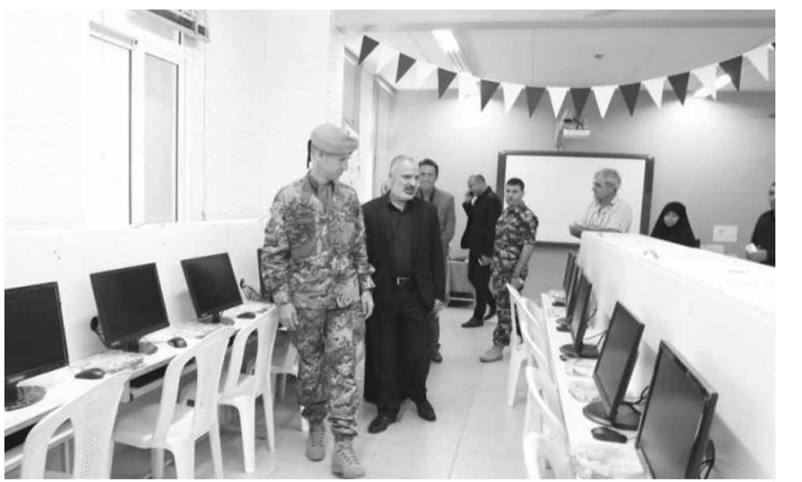
أجهزة كمبيوتر للمدرسة

قدمت الكتبة الإيطالية العاملة في إطار قوة الأمم المتحدة المؤقتة «اليونيفيل»، هبة إيطالية عبارة عن أجهزة كمبيوتر لفائدة مدرسة الإشراف التابعة لجمعية المبرات الخيرية في بنت جبيل. ورحبت المديرية رابعة بضيوف بالاحضور ونوهت بالجهود الكبيرة التي بذلها الجنرال أولاً لتقديم أجهزة الكمبيوتر كعربون وفاء من الكتبية الإيطالية والشعب الإيطالي الصديق.