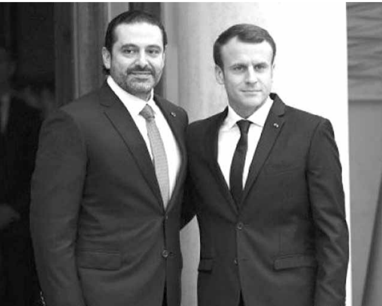
ماكرون والحريري من قصر الاليزيه

بعد أسبوعين عقب إعلانه الاستقالة، أجرى الرئيس سعد الحريري سلسلة لقاءات واتصالات دبلوماسية، حيث انتقل من المملكة الى فرنسا، ملتباً وعقيلته لارا، دعوة رئيسها إيمانويل ماكرون. وفي أول موقف علني له من خارج الأراضي السعودية، أعلن الحريري انه سيعود الى لبنان للمشاركة في عيد الإستقلال وسيحدد موافقه السياسية من كل القضايا بعد لقائه رئيس الجمهورية العماد ميشال عون.