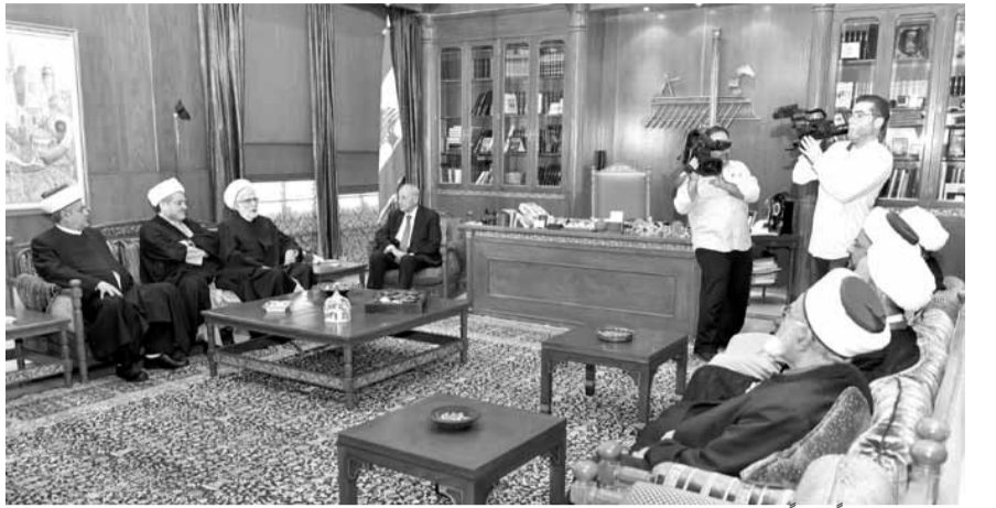
بري مستقبلاً وفداً من «تجمع العلماء»

وتريد أن نقول لإخوتنا في الجامعة أن يتضامنوا معنا لتحرير أرضنا في مزارع شبعا ودعم لبنان والجيش اللبناني على وجه التحديد الصامد في وجه العدو والذي استطاع أن ينتصر على الإرهاب».