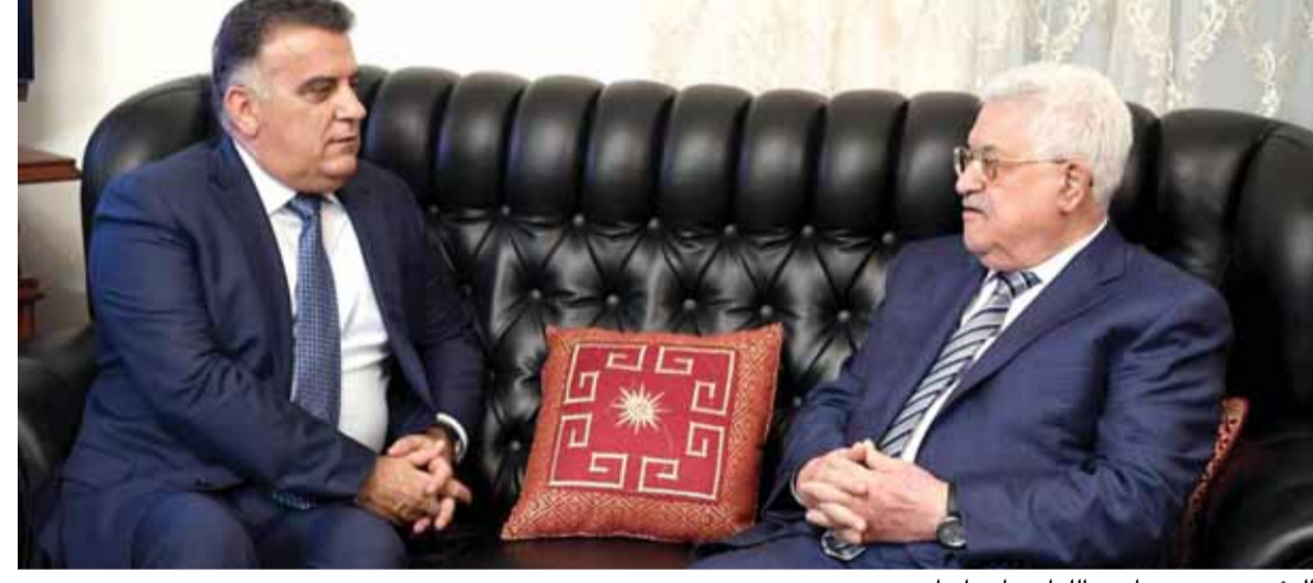
الرئيس محمود عباس والواء عباس إبراهيم

زار صهر الرئيس الأميركي ترامب السيد كوشنير الملكة العربية السعودية وقضى ٤ أيام محادثات مع ولي العهد السعودي محمد بن سلمان حيث تم الاتفاق على فرض تسوية على السلطة الفلسطينية والشعب الفلسطيني، وأساس القرار السعودي - الأميركي بالاتفاق مع إسرائيل هو الآتي: ١- نزع سلاح فتح وحماس. ٢- منع حق العودة عن الشعب الفلسطيني. ٣- بقاء المستوطنات الإسرائيلية في الضفة الغربية التي يسكنها ٦٥٠ ألف إسرائيلي مستوطن. ٤- بقاء الجيش الإسرائيلي على حدود الدولة الفلسطينية مع الأردن، وعدم إعطاء معابر تحت إدارة السلطة الفلسطينية. إزاء هذا الوضع، أبلغت واشنطن الرئيس محمود عباس، انه ان لم يرضخ لمطالب واشنطن والسعودية وبالتالي إسرائيل، فإن مكتب السلطة الفلسطينية سيتم اغلاقه في واشنطن، وبدأ التحضير لذلك على صعيد القرار الأميركي وتبلغت السلطة هذا القرار. كذلك انذر ولي العهد السعودي محمد بن