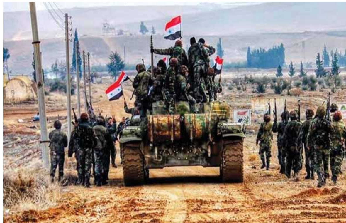
الجيش السوري وحلفاؤه يتقدم في ارياف دير الزور

واصل الجيش السوري وحلفاؤه عملياتهم العسكرية على مختلف محاور دير الزور، ووسعت قواتهما نطاق سيطرتها في الريف الشمالي الشرقي للمدينة على ضفة نهر الفرات الشرقية مستعدة مناطق جديد.