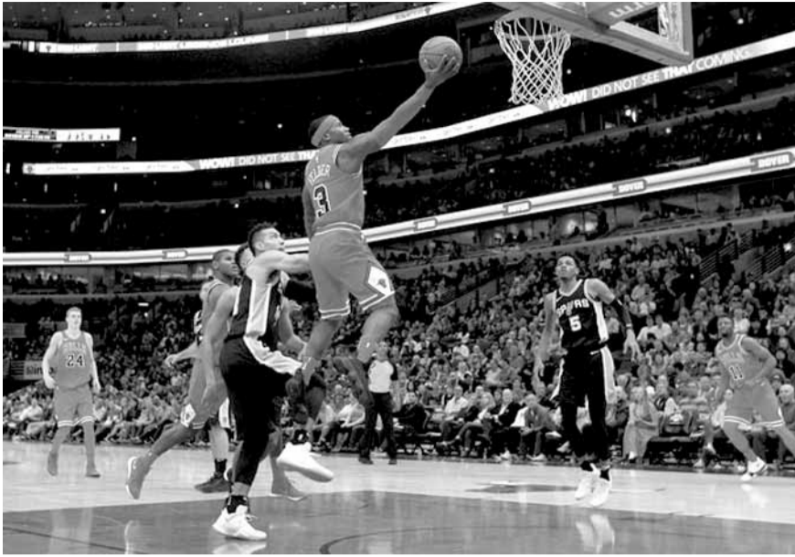
كاي فيلدر يسجل لشيكاغو في سلة سان انطونيو

تابع غولدن ستايت ووريزز حامل اللقب معاناته في بداية الموسم ومنى بخسارته الثانية في ٣ مباريات عندما سقط امام مضيغه ممفيس غريزليز ١٠١-١١١، فيما لم تكن حال وصيفه كليفلاند كافاليرز أفضل بسقوطه على ارضه امام اورلاندو ماجيك ٩٣-١١٤ ضمن الدوري الأميركي للمحترفين في كرة السلة.