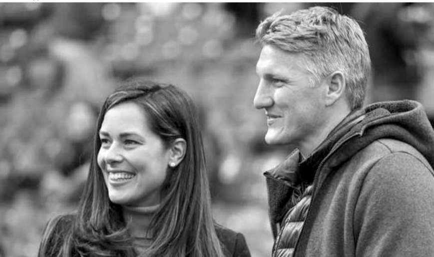
شفاينشتايغر مع زوجته آنا ايفانو فيتش

حوار مع يوروشبورت «قررت بداية أن أوقع لمدة سنة فقط لأنني أردت أن أعرف كيف ستسير الأمور».