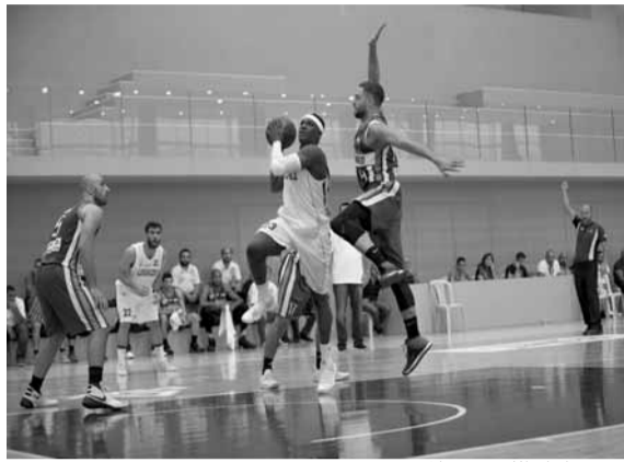
من مباراة اللويزة والمتحد