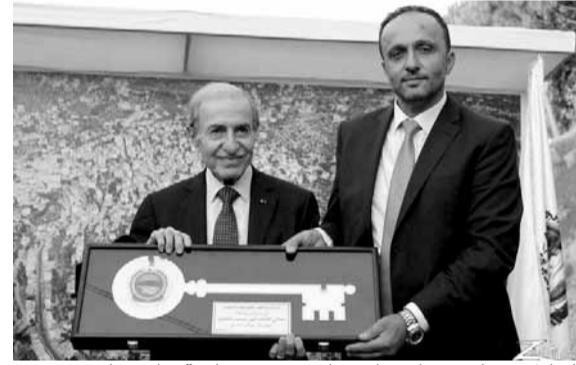
الخليل يتسلم «مفتاح حاصبيا» من رئيس بلدية حاصبيا

منوها بدور رئيس نبيه بري الداعم للمشاريع التي ترفع الحرمان عن كافة مناطق الاطراف، وبدور الزعيم الوطني ولید جنبلاط الذي ما غاب عن المنطقه يوما، بل انه السند الاول لمطالبها وحقوقها، مشيرا الى القرار الحاسم لرئيس الحكومة سعد الدين الحريري بدعم انتاج زيت الزيتون للعام الحالي مؤكدا ان القرار جاء لاقناع الرئيس الحريري وابعائه بحق المزارعين لهم، وتقديرا منه لتضحيات ابناء المنطقه وصمودهم بارضهم، منوها بجهود المجلس البلدي الذي اعاد لوجه حاصبيا اشراقه وتالق بعد مرحلة من الهمال والتقصير».