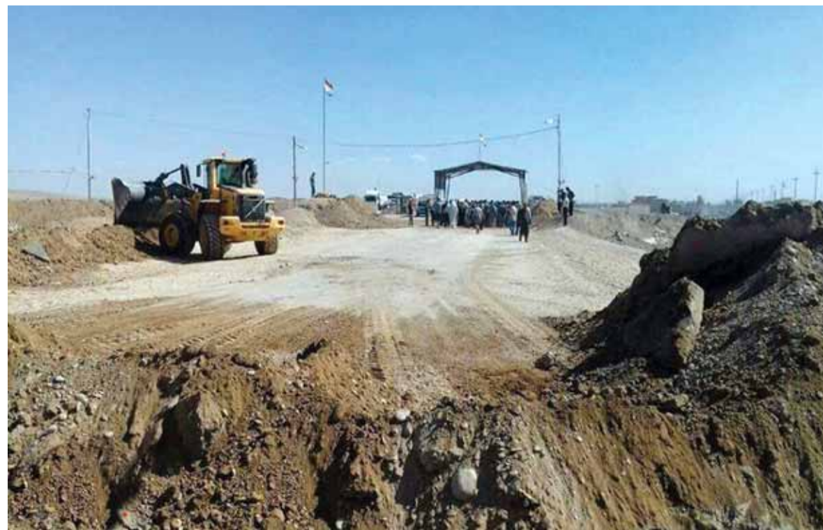
البشمركة يغلق الطريق بين الدهوك ونيوى بالسواتر الترابية

أفادت مصادر أمنية عراقية أمس بأن قوات البيشمركة الكردية أغلقت بسواتر ترابية الطريق الرئيسي بين محافظتي دهوك ونيوى شمال غربي الموصل، في ظل مخاوف كردية من قيام القوات العراقية بالسيطرة على معبر فيشخابور.