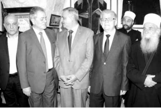
المشاركون في حفل التأبين

أقام رئيس «الحزب الديموقراطي اللبناني» وزير المهجرين طلال أرسلان، بدارته في خلدة، حفل تأبين وتقبل تعازٍ بقائد قوات الحرس الجمهوري السوري في دير الزور اللواء عصام زهر الدين، حضره عدد من السفراء: سوريا علي عبد الكريم علي، روسيا الكسندر زاسيبكين، الجمهورية الاسلامية الإيرانية محمد فتحعلي، وتونس محمد