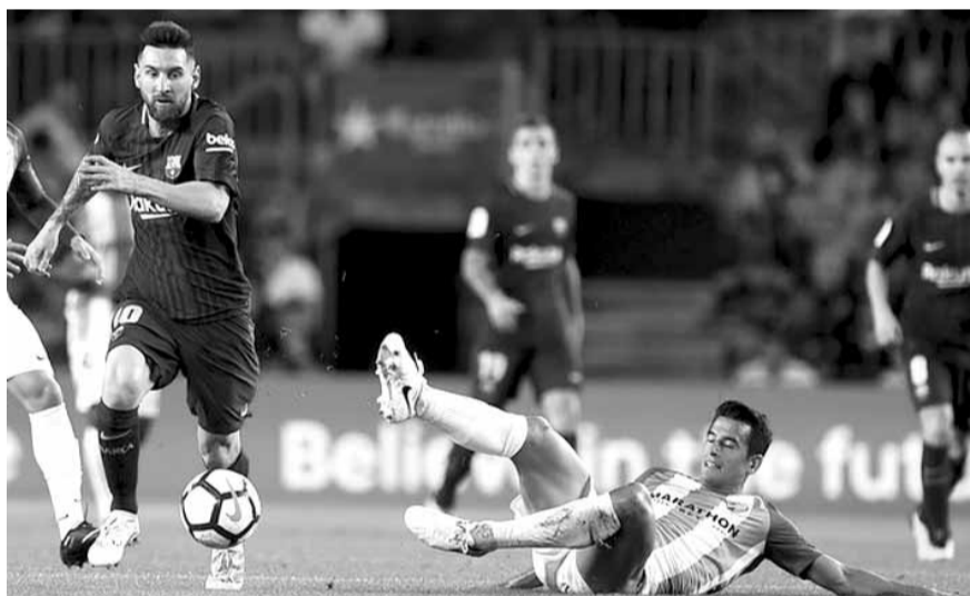
من مباراة برشلونة وملقة

سجل برشلونة أفضل بداية له في تاريخ الدوري الاسباني، بعدما انتصر على ملقة بهدفين نظيفين في الجولة التاسعة من الليغا.