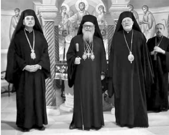
يوحنا العاشر يقيم صلاة الغروب

شدد بطريرك أنطاكية وسائر المشرق يوحنا العاشر أن «كنيسة أنطاكية لا تفرقها المسافات مهما اتسعت وأن أصالتها هي من أصالة الإيمان الرسولي الذي حملته الرسل على أرضها».