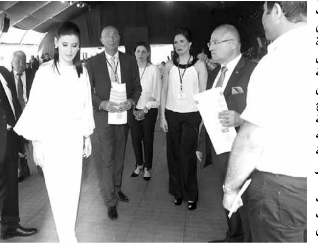
الحاج حسن يفتتح المركز

رئيس القوات ليس بعيداً عن القيام بخطوة تجاه زغرنا قد تفاجى كثيرين، لكن هذه الخطوة يبدو أنها سوف تتأخر أو تعطلت كما تقول الاوساط بفعل تصريح ستريدا جعجع، مع العلم ان القوات سارعت الى احتواء موقف النائب جعجع بعدما طلبت المردة اعتذاراً فوراً فكان لها ما أرادت، فيما أخذ رئيس القوات زمام المبادرة وعالج الخلل على طريقته فاعترف بساعة «تخل» مرت بها منطقة الشمال أدت الى جرح كبير ما كان احد يتمناه وبيان التواصل مع قيادة المردة والقواتيين توصل الى مداواة الجرح. وعليه يمكن البناء والقول ان تصريح جعجع وفق الاوساط جمد مفاعيل الخطوات الإيجابية وما حصل من اتصالات لكن لم يلغها بالكامل، علماً أن للمردة تحفظات كثيرة على «شطحات» النائب جعجع أكثر من «الحكيم» الذي يدوزن ويرتب كلامه السياسي تجاه المردة، فالنائب جعجع ارتكبت «قوات»، كخبرة في فترة «السماح» أو الفسحة التي اعطتها المردة للقوات، خصوصاً ان المردة التي دخلت الحكومة من وزارة الأشغال لم تضع «فيتو» على احد من الإخصام والحلفاء وفي مقدمهم القوات اللبنانية فريئس المردة كان واضحاً امام قياداته وفي تعليماته للمسؤولين والقيادات الحزبية بتفادي أي خلاف مع القوات او سحجال والافتتاح على الإخصام السياسة أكثر من الحفاء وعدم اغلاق ابواب الخدمات اسام احد، إلا ان مناشوات القوات لم تتوقف وبقيت اصداؤها تتردد حول حرمان بشري عناية وزارة