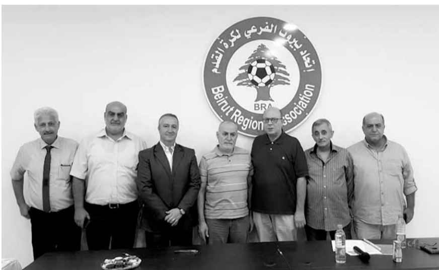
اللجنة التنفيذية لاتحاد بيروت الفرعي لكرة القدم