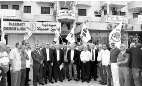
خلال الوقفة التضامنية في منيارة القبض عليهم وتسليمهم للقضاء المختص.

القتلة هم هم بالامس واليوم، يحاولون كلما سحت لهم الفرصة تنفيذ اعتداءاتهم وان اتخذت في كل مرة اشكالا مختلفة. وان الكتاب، إذ يحمل السلطة مسؤولية هذه الاعتداءات وتداعياتها، يدعوهما الى الاسراع في اعتقال المعتدين ومحاكمتهم وانزال اشد العقاب بهم وبمن يقف خلفهم. وعليه، تلقى رئيس الكتاب السياسي في «الكتاب الجميل، اتصالا من وزير الدولة لشؤون النازحين النائب معين المرعبي.