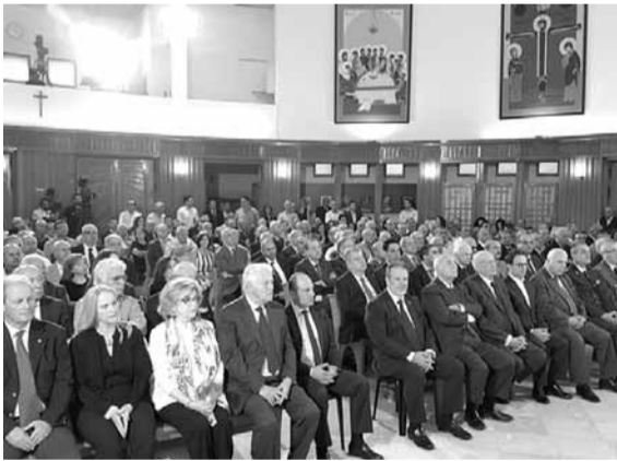
المشاركون في الذكرى

أحيا حزب الوطنيين الأحرار الذكرى السنوية الـ٢٧ لإستشهاد داني شمعون وزوجته أنغريد وولديه طارق وجوليان، بقداس الهي في دير مار أنطونيوس الكبير في السوديكو، ترأسه رئيس الدير الأب فريد ضومط، بمشاركة مطران جبل لبنان للسربران الأورثوذكس جورج صليبيا، ولغيف من الأباء، وخدمته جوقة المحبة. حضر القداس شخصيات سياسية وحزبية وأمنية، وأعضاء المجلس الأعلى في حزب الأحرار وعائلة شمعون والمحازيين.