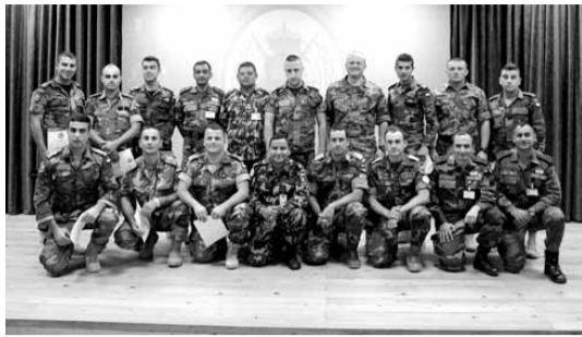
العناصر الذين خضعوا للدورة

نظمت قيادة القطاع الشرقي في قوات الطوارئ الدولية «اليونيفيل» دورة مشتركة حول «آلية اتخاذ القرار العسكري»، في مركز الأمم المتحدة في مرجعيون لمدة خمسة أيام، وشارك فيها عناصر من «اليونيفيل» ومن الفوج الخامس واللواء السابع في الجيش. وأقيم في موقع الأمم المتحدة في قاعدة ميغيل دي ثيرفانتيس في مرجعيون، حفل اختتام الدورة، وحضر الإحتفال المقدم لإما والمشاركون من وحدات «اليونيفيل» والجيش. وفي كلمته أشاد لاما بأهمية هذه الدورة بالنسبة إلى العسكريين، وذلك لما تخللته من تبادل للخبرات»، مهنيًا منها «متابعتهم الدورة بنجاح تام»، مشيراً إلى أنها «ستساهم في تقوية أواصر العلاقة، ورفع مستوى التنسيق بين الجيش اللبناني واليونيفيل». وقال: «إن الجيش اللبناني يعتبر شريكاً استراتيجياً بالنسبة لليونيفيل، بحيث ساهمت هذه الشراكة في المحافظة على الأمن والاستقرار في المنطقة. والنشاطات التي تقوم بها اليونيفيل، تنسق مسبقاً مع الجيش اللبناني بهدف التعاون. فاليونيفيل والجيش اللبناني والشعب اللبناني، لديهم مصلحة مشتركة في الحفاظ على الاستقرار في جنوب لبنان، ومنع أي انتهاك للقرار ١٧٠١، الصادر عن مجلس الأمن الدولي».