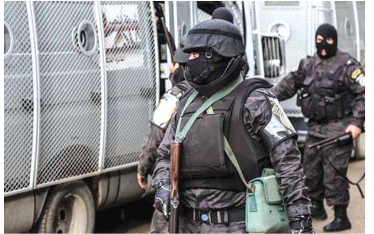
مدهامات للشرطة المصرية