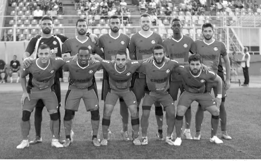
فريق السلام زغرتا

حقق الراسينغ أول فوزه في الدوري اللبناني لكرة القدم، وذلك بتغلبه على النبي شيت ٢-١ في المباراة التي جرت أمس السبت على ملعب أمين عبد النور في بجمدون، ضمن المرحلة الخامسة.