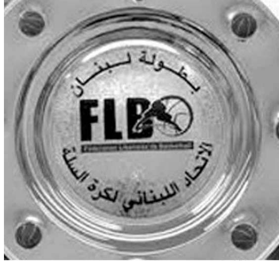
درع بطولة لبنان