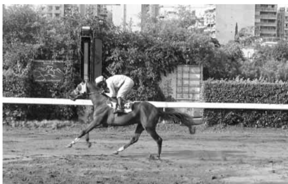
قاهر الخيل: إذا قاده خياله عدنان بخلاص وترو لا مجال لخسارته... أما إذا كان فيها وما فيا... دوماج ولكن قاهر الخيل لن يفهر...