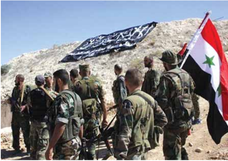
عناصر الجيش السوري امام شعارات لداعش في «القريتين»

استعاد الجيش السوري مدينة القريتين الواقعة في ريف حمص الشرقي، من قبضة مسلحي تنظيم «داعش». وذكر وكعالة «سانا» أن وحدات من الجيش بالتعاون مع القوات الحليفة أعادت الأمن والاستقرار إلى مدينة القريتين بعد القضاء على مجموعات من مسلحي