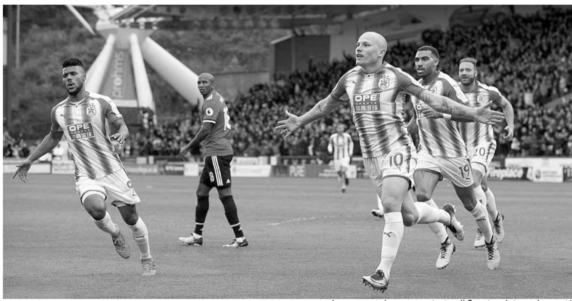
لاعب هادرسفيلد وفرحة الهدف في مرمى مانشستر يونايتد