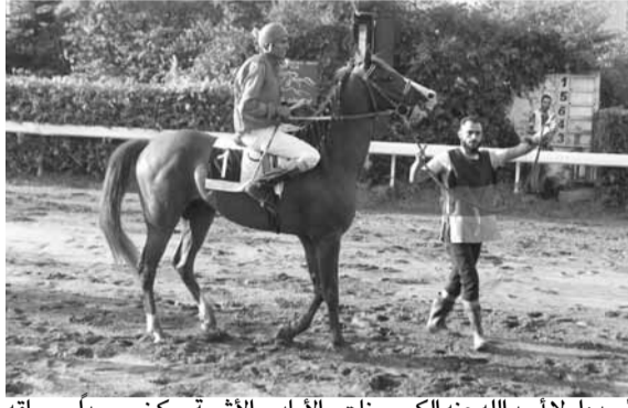
أبعـد: أو لا أبعـد الله عنه الكوميينات والآيادي الأثيمة، ركض جيدا بسباقه الماضي ولا يزال بنفس الفورمة والقبالية الظاهرة للفوز بإبعـد... وأبعـد.