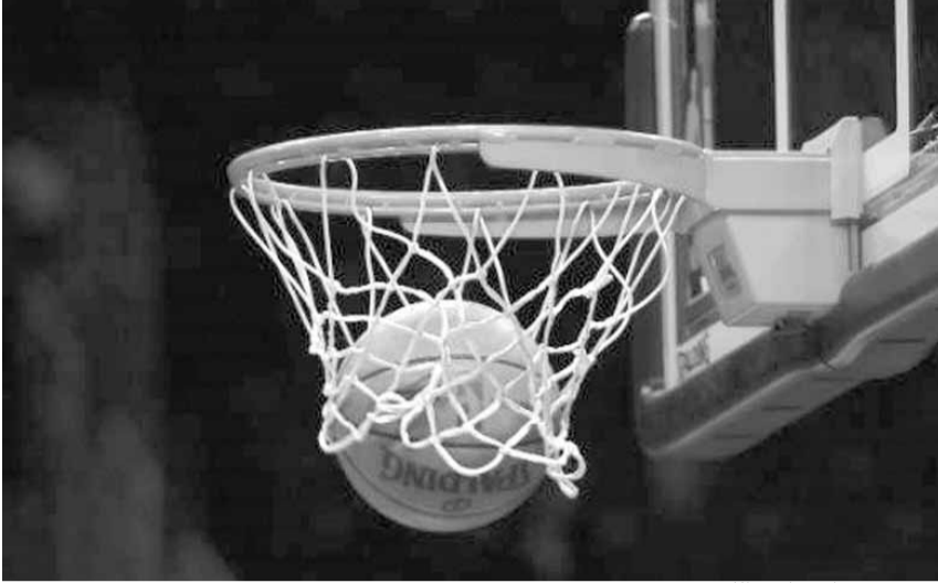
هل يحرز ناد بقاعي للقب؟