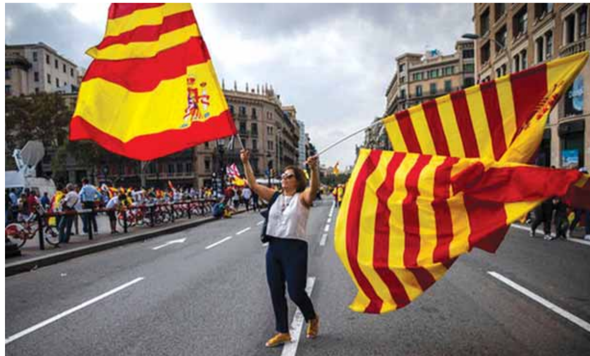
اسبانية ترفع علم اسبانيا وكاتالونيا

أعلن رئيس الوزراء الإسباني ماريانو راخوي أن حكومة البلاد قررت عزل قادة إقليم كاتالونيا الذاتي للحكم عن السلطة، وفقاً للمادة ١٥٥ من الدستور، وذلك لمعالجة الأزمة بين مدريد وبرشلونة. وفي مؤتمر صحفي عقده بمدريد، أوضح راخوي أن تطبيق المادة ١٥٥ يقتضي إمكانية إقالة جميع القادة الكاتالونيين بسبب تجاوزهم القانون، ليتولى إدارة الشؤون في هذا الإقليم الذاتي الحكم وكيل خاص معين من قبل مدريد، وذلك إلى حين إجراء انتخابات جديدة هناك.