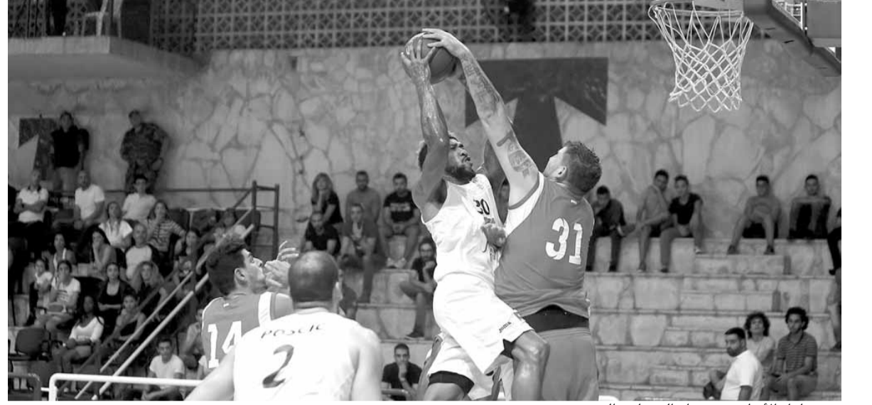
من مباراة الأنطوني بعهدا والتضامن الزوق

وسعد الحكمة إلى المركز الثالث بفوزه على الهومنتمن (٢-١)، فيما فاز المرية على الأهلي صيدا (٢-١).