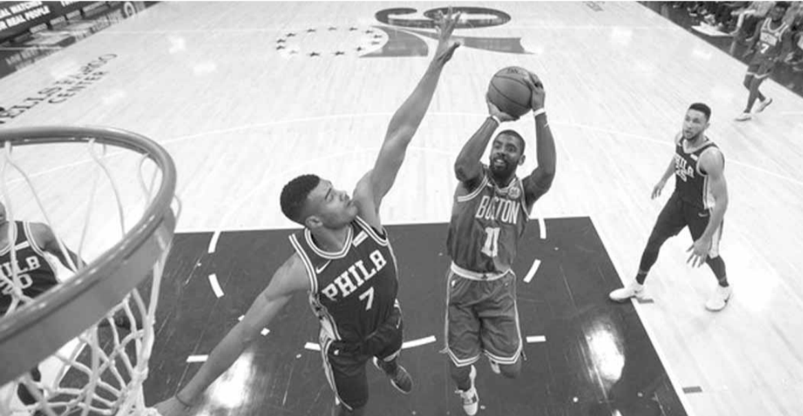
كايري ايرفينغ في محاولة تسجيل لبوسطن

الربع الأخير. الا ان هذا الربع شهد خروج لاعب كليفاند ديريك روز للاصابة.