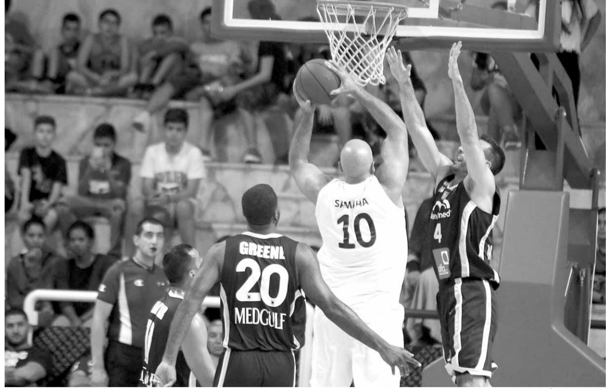
من مباراة الأنطوني بعدا والرياضي بيروت

افتتح بطل لبنان لكرة السلة الرياضي موسم ٢٠١٧/٢٠١٨ بفوز كاسح على فريق الأنطوني الصاعد حديثاً الى الدرجة الاولى، بنتيجة (٩٢-٥٢)، في حين حقق الحكمة فوزاً مهماً على المتحد على أرض الأخير في طرابلس بنتيجة (٧٦-٦٦). في المباراة الاولى، استضاف الأنطوني العائد الى الدرجة الاولى بطل لبنان وآسيا الرياضي، ولم يواجه الأخير اي صعوبة في تخطي مضيفة. وسرعان ما تقدم الرياضي في الربع الاول بفارق ٩ نقاط (٢٣-١٤)، وفي الربع الثاني وسع الرياضي تقدمه الى ١٨ نقطة منهياً الشوط الاول بنتيجة (٦٦-٢٨). صاحب الأرض استسلم تماماً أمام هجوم الرياضي الناري الذي بدأ بتوسيع الفارق أكثر وأكثر، فنتهى الربع الثالث بنتيجة (٧٦-٣٩).