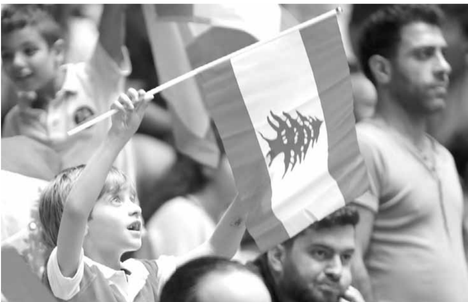
طفل يلوح بالعلم اللبناني خلال إحدى مباريات منتخب لبنان في بطولة آسيا

تُوِّج السويسري روجيه فيدري المصنف الثاني عالميا، بلقب بطولة شنغهاي للتنس للأساتذة أسس الأحد، بعد فوزه على منافسه الأكبر الإسباني رافاييل نادال المصنف الأول عالميا. ففي المباراة النهائية للبطولة المقامة في الصين، فاز فيدري المصنف الثاني بالبطولة على المصنف الأول نادال بمجموعتين متتاليتين (٦-٤) و(٦-٣). وحقق فيدري الفوز في المباراة، بعد ساعة واحدة و١٢ دقيقة، محققاً رابع انتصار على نادال هذا العام. وقدم فيدري أداءً متميزاً، وتفوق تماما على نادال،