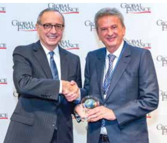
سلامة يتسلم الجائزة

كرمت مجلة «غلوبال فاينانس» حاكم مصرف لبنان رياض سلامة بمنحه درعاً تقديرياً في العاصمة الأميركية، وللسنة الثانية على التوالي، لتصدره لأحة أفضل حكام مصارف مركزية في العالم الذين تميزوا بنبلهم درجة «A» المرموقة.