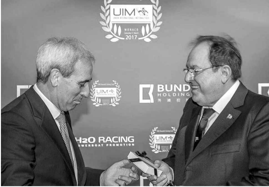
بطاقة البلاينيوم رقم ١ من شيولي الى شاغوري