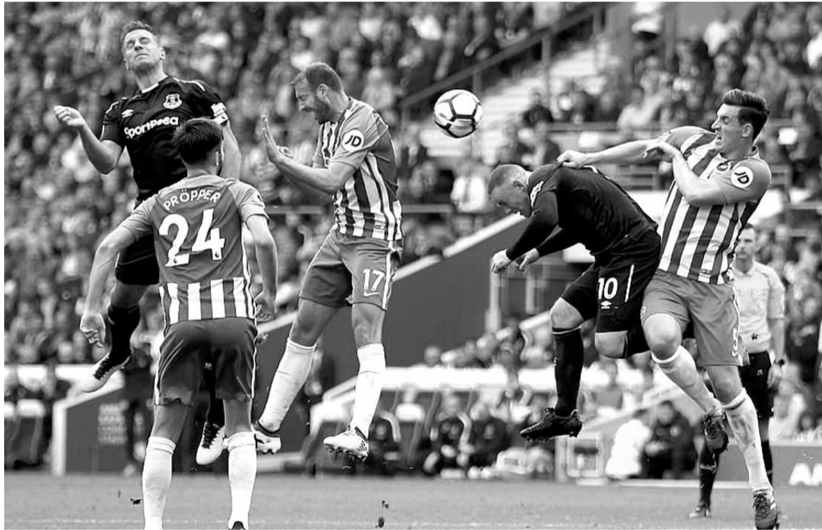
من لقاء برايتون وايفرتون في الدوري الانكليزي الممتاز