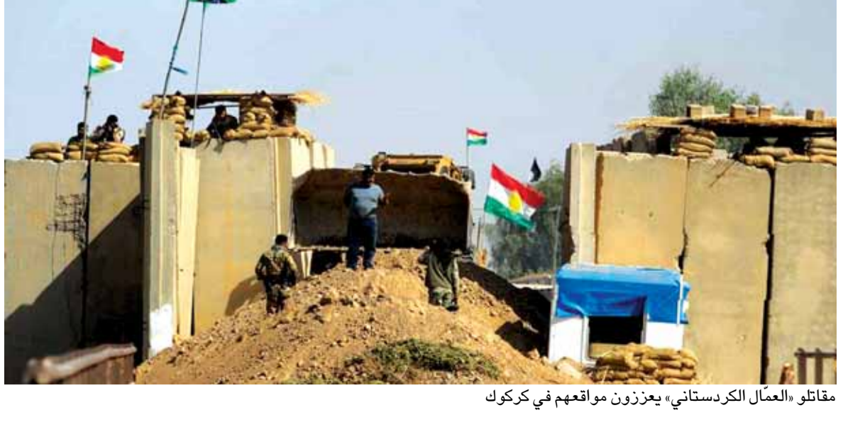
مقاتلو «العمال الكردستاني» يعززون مواقعهم في كركوك

اعتبرت الحكومة العراقية امس وجود «مقاتلين من حزب العمال الكردستاني التركي» في محافظة كركوك المتنازع عليها مع الاكراد تصعيداً خطراً وكإعلان حرب». واعلن المجلس الوزاري للامن برئاسة رئيس الوزراء حيدر العبادي في بيان ان وجود «مقاتلين» هو «تصعيد خطر» و «إعلان حرب» وحذر من «عناصر مسلحة خارج المنظومة الامنية النظامية في كركوك واقام قوات غير نظامية بعضها ينتمي الى حزب العمال الكردستاني التركي». واعتبر ذلك «تصعيداً خطراً لا يمكن السكوت عنه وانه يمثل اعلان حرب على باقي العراقيين والقوات الاتحادية النظامية». واتهم المجلس القوات «التابعة لإقليم كردستان» بانها «تريد جر البلاد الى احتراب داخلي من اجل تحقيق هدفها في تفكيك العراق والمنطقة بغية انشاء دولة على اساس عرقي». وندد بـ«امتداد مسلحي الاقليم الى مناطق خارج الحدود المعروفة في اطار الدستور بقوة السلاح والتهديد واضطهاد وتهجير ابناء المناطق التي تسكنها غالبية غير كردية ومنع (تتمة الخبر العراقي ص ١٦)