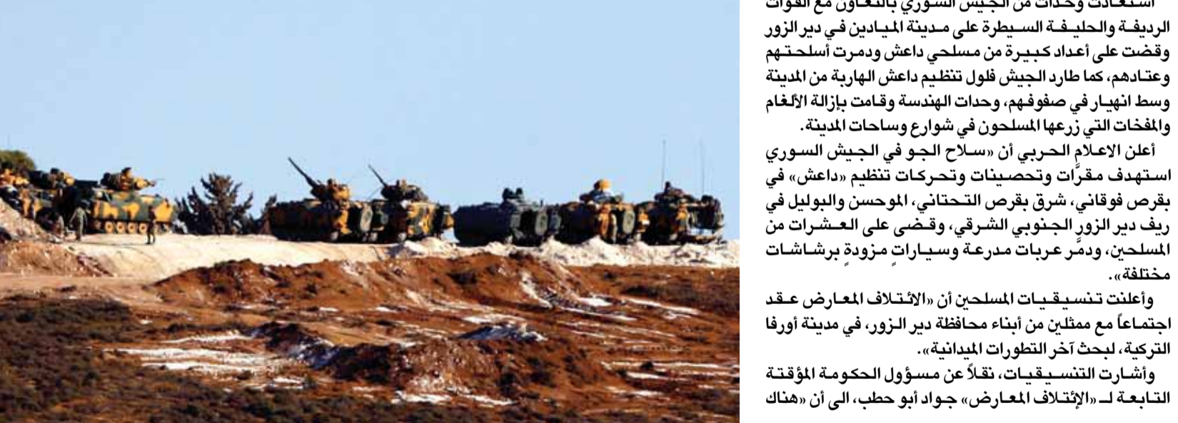
القوات التركية تعزز تواجدتها في ادلب