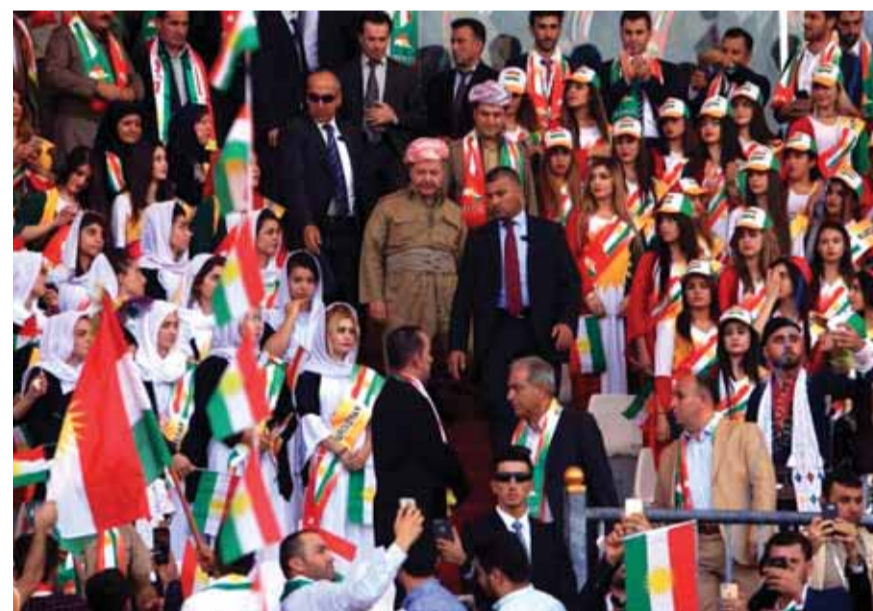
البارزاني خلال مهرجان شعبي تحضيراً للاستفتاء

نجحت الضغوط الدولية والإقليمية في دفع رئيس إقليم كردستان مسعود البارزاني الى تأجيل المؤتمر الصحافي بشأن الاستفتاء على الاستقلال، بحسب ما أشارت رئاسة وزراء الإقليم في أربيل. وقال المكتب الإعلامي لرئيس وزراء كردستان العراق إن «المؤتمر الصحافي سيعقد اليوم، وسيتم الإعلان عن المكان والزمان لاحقاً». وفي الأثناء تحدثت صحف عراقية عن وصول الوفد الكردي ظهر امس، إلى العاصمة بغداد للباحث حول ملف استفتاء إقليم كردستان المقرر إجراؤه غداً. ويرجح البعض أن البارزاني قد أجل كلمته إلى ما بعد اللقاء المرتقب في بغداد والذي قد يفضي إلى تغيير موقف أربيل بشأن تنظيم الاستفتاء ولاسيما في ظل تزايد الضغوط الداخلية الإقليمية والدولية. ويتعرض البارزاني لضغوط وتحذيرات دولية متزايدة للعدول عن رأيه وتأجيل الاستفتاء المرتقب في الخامس والعشرين من أيلول الحالي.