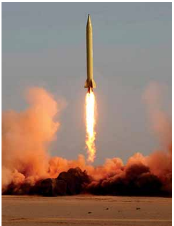
خلال اختبار الصاروخ الباليستي

ذكرت إيران امس انها اختبرت بنجاح صاروخاً باليستياً جديداً يصل مداه إلى ألفي كيلومتر وانها ستواصل تطوير ترسانتها رغم الضغط الأميركي لوقفها.