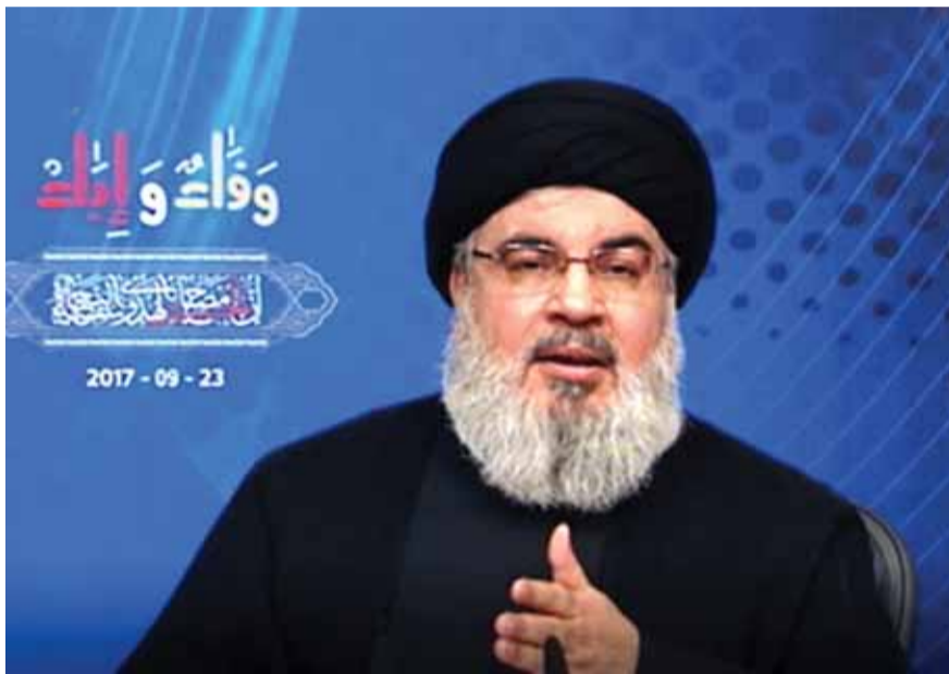
السيد نصر الله متحدثاً في المجلس العاشر في

أكد الأمين العام لـ«حزب الله» السيد حسن نصر الله ان «المقاومة ضد إسرائيل كانت تجسيدا للتكليف الالهي الذي يحقق المصلحة الوطنية والمصلحة العربية ومصصلحة المنطقة»، مشيراً الى انه «بعد التضحيات طردت هذه المقاومة الاحتلال الاسرائيلي واسقطت مشروعه في لبنان، واسقطت اسرائيل الكبرى في المنطقة».