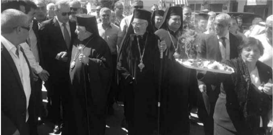
خلال استقبال العبسي والوفد المرافق له

زار بطريرك انطاكيا وسائر المشرق للروم الملكيين الكاثوليك يوسف العبسي، بلدة القاع، برفاقه وزير الدولة لشؤون التخطيط نائب رئيس المجلس الأعلى للروم الكاثوليك ميشال فرعون وحشد من المطارنة، وأقيم له في ساحة مار الياس استقبال شعبي حاشد تقدمه رئيس بلدية القاع بشير مطر وأعضاء المجلس البلدي، مختابر القاع وفاعليات البلدة السياسية والاجتماعية وحشد من الاهالي، بمشاركة فرق من الكشاف والخيالة، وسط نثر