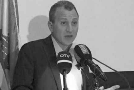
باسيل يلقي كلمته في مؤتمر «الطاقة الاغترابية»

في الولايات المتحدة الأميركية في فندق بيلاجيو في لاس فيغاس، وأعلن في كلمته ان «جولته على المغتربين اللبنانيين في أميركا الشمالية تهدف الى توحيد الجهود لمنع أي مشروع لتوطين النازحين أو اللاجئين في لبنان، كما تهدف الى تشجيع المغتربين على استعادة الجنسية اللبنانية لمن لم يحصل عليها بعد، وتحفيزهم للمشاركة للمرة الأولى في الانتخابات النيابية»، مضيفاً «عندما حذرنا في العام ٢٠١١ من مخاطر نزوح السورييين بلا ضوابط، تعرضنا لشتى الاتهامات بالعنصرية، وحتى الآن لا يزال الخلاف قائماً حول عودتهم فنحن نريدها آمنة وهم يريدونها مؤجلة»، وقال «لن نقبل الدمج أو التوطين، فالسوريون اخوان لنا، لكن عودتهم الى بلادهم حق لهم وستنصر في هذه المواجهة لمصلحة لبنان ومصالحة اللبنانيين».