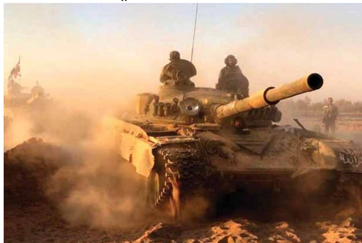
الجيش السوري يتقدم شرق الفرات

ذكرت الرئاسة الفرنسية عن مقتل جندي فرنسي على الحدود السورية العراقية دون ذكر الأسباب. بالمقابل التحقت القوات السورية المتقدمة على الضفة الشرقية لنهر الفرات مع القوات السورية المتقدمة من ريف الرقة الشرقي بعد سيطرة الجيش السوري على قرية معدان عتيق التي تبعد ٧ كيلومترات عن مدينة معدان التي تعد أكبر تجمعات الإرهابيين في ريف الرقة الشرقية، قرب الحدود الإدارية بين محافظتي الرقة ودير الزور، كما فرضت القوات السورية سيطرتها على العديد من القرى على الطريق العام للريف الشرقي.