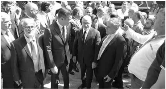
فيناوس خلال زيارته حلبا

والقى الوزير فيناوس كلمة استهلها بشكر الجميع على حضورهم وبلدية حلبا ورئيسها على اتمام هذا اللقاء، وقال: «انبت الى هذه الوزارة وموازنتها الكل يعرف قيمتها وانا الى جانب منطقة عكار وسأضاعف حصتها، وانا قلت امام مجلس النواب بان حصة الأسد لعكار، فهي محرومة وبالحد الأدنى كابن زغرنا ومن مدرسة سليمان فرنجية ان تنصف عكار. وانا كوزير اشغال لن اترك الوزارة قبل ان اضع في عكار ٥٠ و ٦٠٠ مليار ليرة وهي تستحق أكثر وهي لها علينا ونحن نحاول ان نرد لها ما علينا». ولفت الوزير فيناوس الى «ان اجتماعا سيعقد الأسبوع المقبل بعد ١ يوماً في الوزارة يحضره عدد من رؤساء البلديات في عكار»، وقال: «سنستمع للاحتياجات ونضع الخرائط مع المهندسين المختصين وننطق على الخطوات التي ستتم، ونحن طمنا بـ ٣٤ مليار ليرة من الموازنة لوزارة الاشغال العام ٢٠١٨ اذا قرت كاملة اعدنا لهذا في عكار بانه لن يبقى طريق في عكار بدون زفت، وانا لم نقر كاملة عندها سنعود ونلتقي بكم لوضع الاولويات»، وختم بالقول: «اتمنى عليكم جميعاً ان تعتبروا بان وزارة الاشغال بابها مفتوح للجميع».