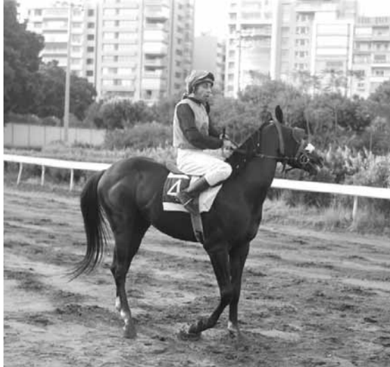
فرار: لا يزال بنفس الفورمة والحالة التي فاز بها الاسبوع الماضي انه قادر على التجديد والفوز والفرار من مطاردية.

اقدن: ابن الست - شيرين - ساجدة اخيار الخيل: شيرين - ابن الست - ابن الشول - ساجدة اللوتري: ابن الست - شيرين - مارد - ابن الشول