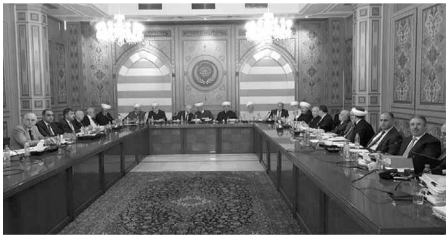
دريان يتراس اجتماع المجلس الشرعي

به مفتي الجمهورية عملاً بمبدأ المساواة في العمل بين اللبنانيين». وابدى المجلس الشرعي «خشيته من عودة التشجات بين القوى السياسية مع اقتراب الانتخابات النيابية، التي بدأ التحضير لإجرائها في الأشهر المقبلة، والتي ستكون مفصلاً مهماً من مفاصل الحياة اللبنانية». واكد «اتمام وإنجاز وحدة القرار الوطني الفلسطيني بين فصائله وقواه كما يؤكد على حقوق هذا الشعب الوطنية والإسلامية ورفض التوطين تحت أي ذريعة كانت». وتمنى «تمكين الإخوة النازحين السوريين بعودة أمانة إلى وطنهم وديارهم سالمين، وان تتحمل الهيئات الدولية مسؤولياتها كاملة في هذا الملف الإنساني».