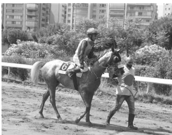
ابن الست: جواد لا يستهان بقوته، وزخمه، اذا قاده خياله بطريقة صحيحة سيفوز ببعد.

اقدن: فرار - سيف العدل - شط العرب اخيار الخيل: فرار - سيف العدل - نظير الثاني - شط العرب اللوتري: نظير الثاني - فرار - سيف العدل - شط العرب