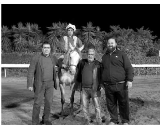
وحيد الميدان: شوهد صباح السبت بحالة رائعة، وجهوزية حاضرة لا يبعده عن الهدف الا القيادة السنية.

اهم جواد الحفلة اذا... ابتعدت عنها الكومبينات والايادي الأثيمة! ابو فراس - وحيد الميدان - اشعل قاهر الخيل - ابن الست - اغادير - فرار