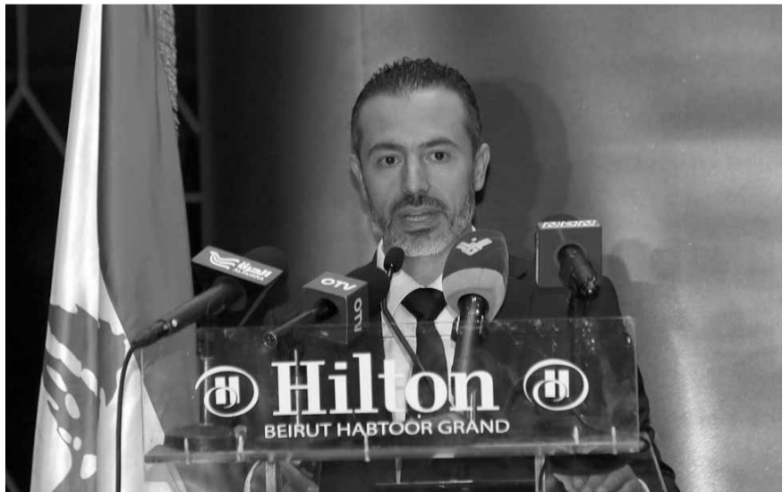
رئيس الاتحاد اللبناني للتايكواندو الدكتور حبيب ظريفة