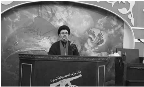
صفي الدين يلقي كلمته في المجلس العاشر في بعلبك

الأميركي والإسرائيلي من فشل مشروعهم ومن الحضور القوي الذي يحققه محور المقاومة في المنطقة، لاسيما في العراق وسوريا بفضل الإنجازات الميدانية الأخيرة.. فليقرأ الخطاب الموتر للرئيس الأميركي في الأمم المتحدة، وليطلع على ما يقوله الإسرائيليون عن سوريا وحزب الله وإيران وانتصاراتهم في المنطقة، حيث يستثم من