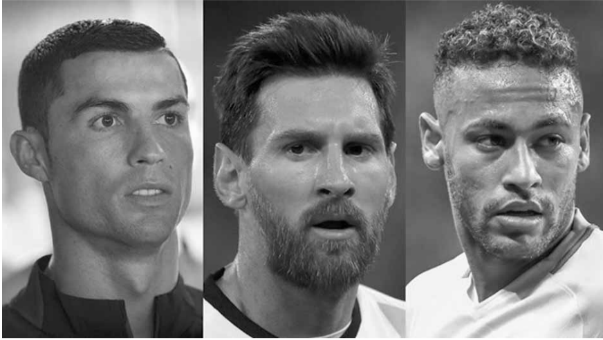
الثلاثي نيمار وميسي ورونالدو

* كارلي لوي (الولايات المتحدة الأمريكية - هيوستن داش - مانشستر سيتي للسيدات) * ليبيكي مارتينس (هولندا - برشلونة للسيدات) - جائزة The Best من FIFA لأفضل مدرب للرجال: * ماسيميليانو اليغري (إيطاليا - يوفنتوس) * أنطونيو كونتي (إيطاليا - تشيلسي) * زين الدين زيدان (فرنسا - ريال مدريد) - جائزة The Best من FIFA لأفضل مدرب للسيدات: