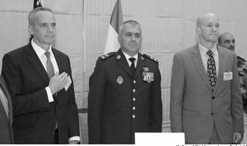
المشاركون في حفل الاستقبال

شاركت السفارة الأميركية في حفل استقبال في مجمع جونييه العسكري، تكريماً لمتخرجي برنامج التعليم والتدريب العسكري الدولي، الذي يعتبر أحد الأركان الأساسية للشركة العسكرية الأميركية - اللبنانية التي، من خلالها، قدمت أميركا التدريب والتعليم لأكثر من ١٢٠٠ ضابط عسكري لبناني منذ العام ٢٠٠٦.