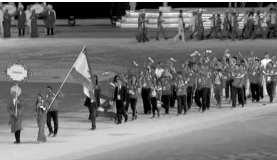
البعثة اللبنانية يتقدمها العلم في الافتتاح