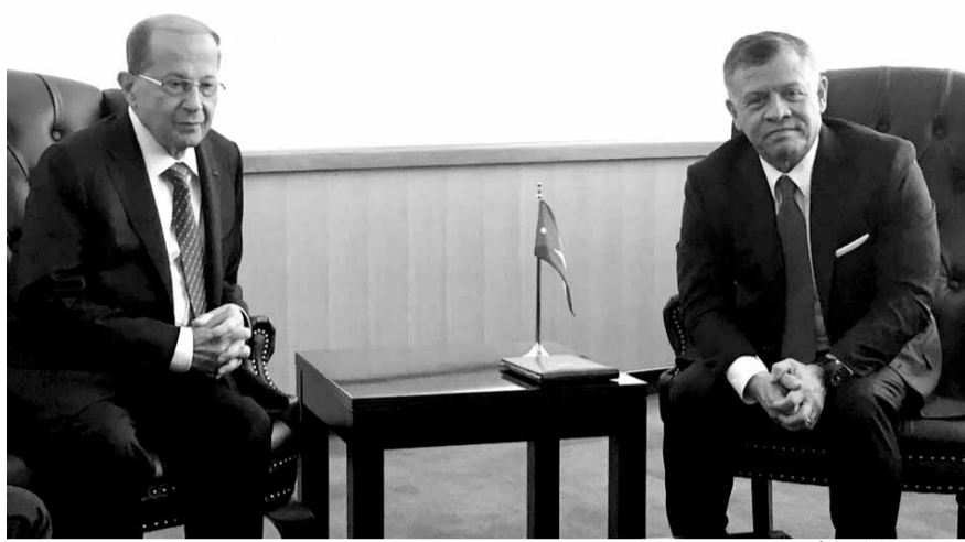
عون مع الملك الأردني

شارك رئيس الجمهورية العماد ميشال عون صباح امس، في الجلسة الافتتاحية لأعمال الجمعية العامة للأمم المتحدة المنعقدة في نيويورك بدورتها الثانية والسبعين، كما في مائدة الطوفور التي اقامها الأمين العام للأمم المتحدة انطونيو غوتيريس على شرف حضور الوفود المشاركة. وكانت مناسبة التقى فيها الرئيس عون الرئيس البرازيلي ميشال تامر وعدد من رؤساء الدول. ثم واصل رئيس