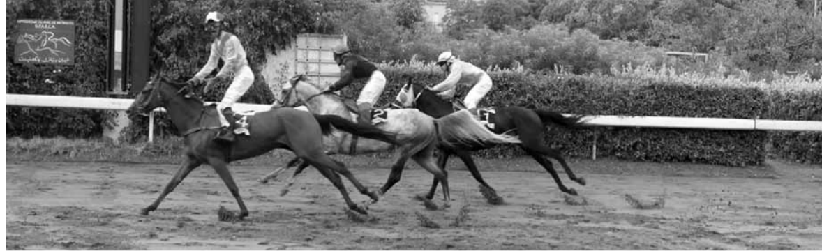
اجمل وصول سيمونا بالهدف مطاردة من ميرميران (بدر) ومتميز (عدنان)