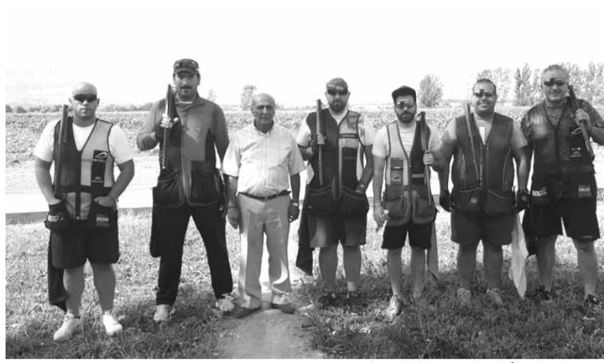
الرماة الستة المتاهلين الى المرحلة النهائية

خمس طابق لأول ويتم استبعاد الرامي الذي حصل على أقل عدد من الاصابات وبعدها تجري الرماية على خمسة طابق اضافية أخرى ويتم استبعاد الرامي الذي حصل على أقل عدد من الاصابات ويحصل ذلك للمرة الثالثة والرابعة أيضاً عندها يعرف من الذي فاز بالمرتبة الثالثة. وأخيراً تحسم النتيجة بين الأول والثاني بعد الرماية على عشرة طابق في آخر الجولة.