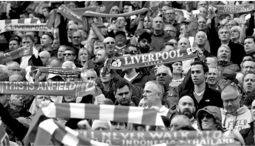
مشجعو نادي ليفربول

الأندية وعملية التصويت في هذه الجائزة كانت واضحة جداً، لهذا يمكن المشاركة بكل سهولة». وبما أن بورغن كلوب، مدرب بوروسيا دورتموند السابق، أصبح الآن يشرف على الإدارة الفنية في نادي ليفربول، ولكون الاحتفالات بالذكرى السنوية، تشهد في كل مرة مشاركة مقلين من كلا الناديين، نظراً لأن الفريقين كان قد التقيا في مباراة نهائي مسابقة كأس أوروبا للأندية الفائزة بالكأس ١٩٦٦، والتي انتهت بفوز الألمان بنتيجة ٢-١، فإن العلاقة بينهما كانت في الأصل وطيدة.