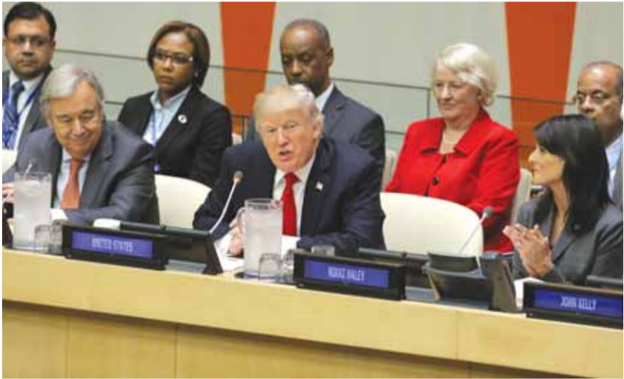
ترايب يلقي كلمته وبجانبه غوتيريش

وفي أول خطاب له أمام الجمعية العامة للأمم المتحدة، قال ترايب إن الجيش الأمريكي سيكون الأقوى في التاريخ، مضيفاً: «نتمسك بعمداً بالسيادة وعدم التدخل في شؤون