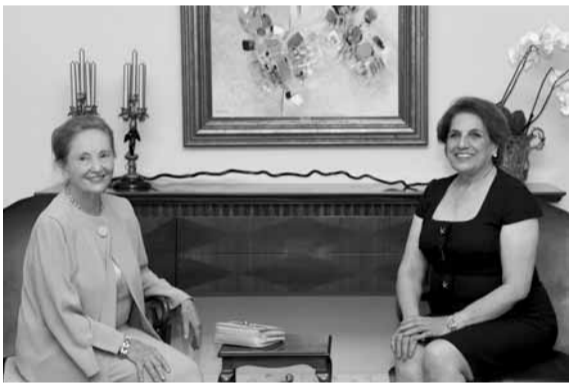
السيدة الاولى مستقبلة مستشارة منظمة فرسان مالطا

استقبلت اللبنانية الاولى السيدة ناديا الشامي عون قبل ظهر امس في قصر بعبداد مستشارة رئيس منظمة فرسان مالطا ذات السيادة الاميرة فرانسواز دو بوريبون دو لويكوفيتش في زيارة بروتوكولية، وعرضت معها نشاطات المنظمة في المناطق اللبنانية.