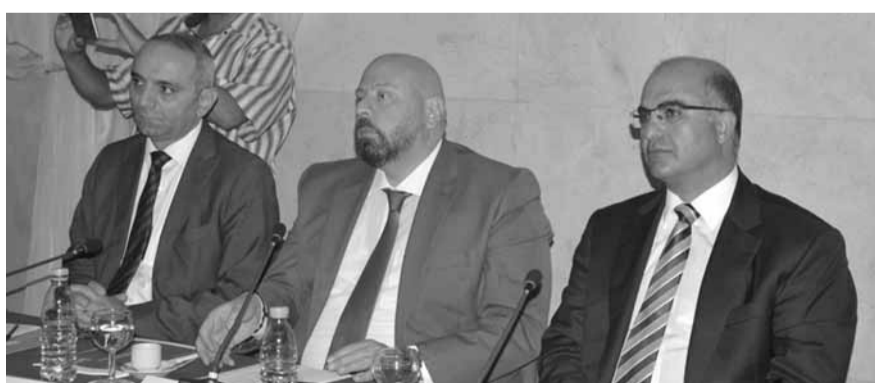
وقد عرض خلال الاجتماع المشاريع التي ستطرخ على جلسة مجلس الوزراء والتي تقدمت بها الوزارات والبلديات في اجتماعات سابقة، ليعاصر الى جدولتها وتنظيمها وارسالها الى الامانة العامة لمجلس الوزراء، والتي بدورها ستقوم بتحضيرها وعرضها في الجلسة المختصة لحافظة الشمال.

والاقتصادية والأمنية، ونحن جاهزون لاستقبال اول جلسة ستعقد مجلس الوزراء في المحافظات، لذا نشعر بالفخر على ان تكون طرابلس المحطة الأولى لعقد اجتماعات مجلس الوزراء في المحافظات».