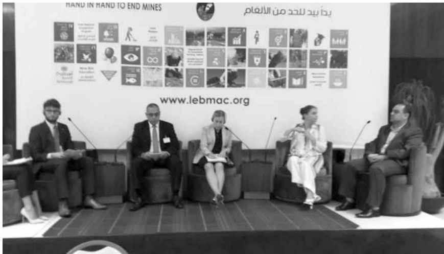
المشاركون في الاجتماع

عقد أعضاء مجموعة الدعم الدولي للبنان في مجال العمليات الإنسانية لنزع الألغام والقنابل العنقودية والذخائر غير المنفجرة، والممول من الاتحاد الأوروبي، بدعم من برنامج الأمم المتحدة الإنمائي، اجتماعاً تقييمياً قبل ظهر امس في فندق «لانكستر بلازا»- الروشة، برعاية وزير الدفاع الوطني يعقوب الصراف ممثلاً بالعميد الركن محمد الحسن، الذي مثل أيضاً قائد الجيش العماد جوزف عون، وفي حضور