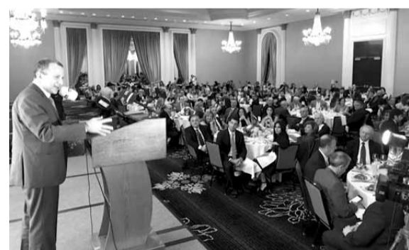
باسيل يلي كلمته

رد وزير الخارجية والمغتربين جبران باسيل من هيوستن، على اعلان رئيس مجلس النواب نبيه بري ان كتلة التنمية والتحرير تقدمت باقتراح قانون بتقشير ولاية المجلس النيابي الى ٣١/١٢/٢٠١٧ على ان تجرى الانتخابات قبل هذا التاريخ، معتبراً ذلك ضرباً للإصلاحات الانتخابية، مبرراً التعميد