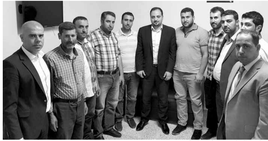
مزارعو التفاح في مركز تيار العزم

الأسواق اللبنانية، وبسياسة إنقاذية متكاملة تأخذ في الاعتبار مجالات التصريف من جهة وحاجة السوق المحلية من جهة أخرى». من جهته، وعد عز الدين «بإيصال صوت الوفد إلى الرئيس نجيب ميقاتي والمعنيين بالأمر لإيجاد حل لهذه المشكلة»، مشدداً على «ضرورة التصريف العاجل للمحصول بما يؤمن دخلاً كريماً للمزارعين من جهة ويساهم في تثبيتهم في أرضهم من جهة أخرى».