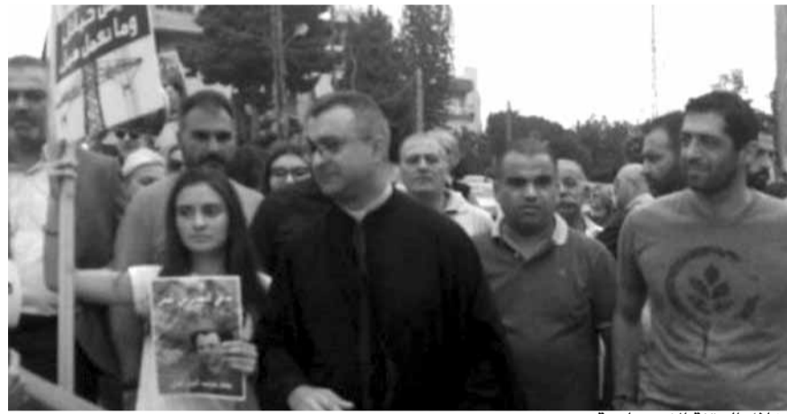
خلال الوقفة الاحتجاجية