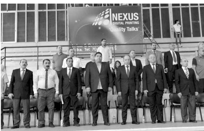
راعي البطولة مع كبار الحضور