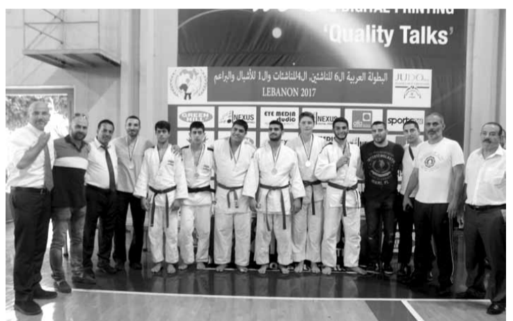
رئيس الاتحاد اللبناني الحماني سعادة واركاته مع أبطال لبنانيين