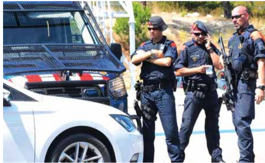
اجراءات أمنية في برشلونة

اعتقلته الشرطة بعد ان أصيب بجروح في انفجار وقع داخل منزل في بلدة الكانار (جنوب غرب برشلونة) قبل يوم واحد من الهجوم الذي أوقع ١٥ قتيلاً وسط برشلونة. (تتمه الخبر الإسباني ص ١٦)