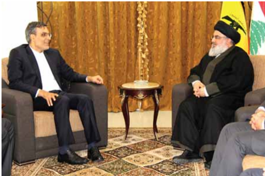
السيد حسن نصرالله مستقبلاً السيد انصاري

البراني في بيروت السيد فتحعلي. وجرى خلال اللقاء استعراض آخر الأوضاع السياسية والعامه في لبنان وسوريا في المنطقة. (التفاصيل ص ٧)