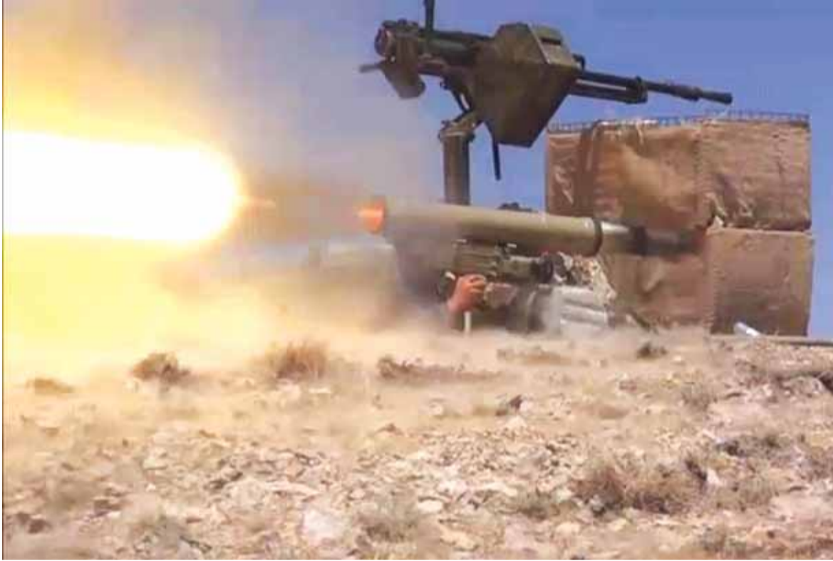
صواريخ المقاومة تصف مواقع «داعش»