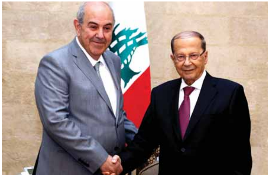
الرئيس عون مستقبلاً الدكتور اياد علاوي

«لبنان والعراق يواجهان معا عدوا مشتركا هو الإرهاب وانهما سينتصران عليه حتماً، لان ارادة الشعبين اللبناني والعراقي واحدة في نبذ التطرف وفي الانتصاف حول قواهما المسلحة التي تخوض مواجهات ناجحة للقضاء على الإرهابيين».