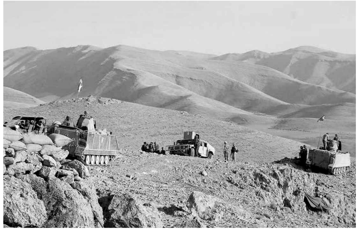
اليات للجيش اللبناني في الجرد