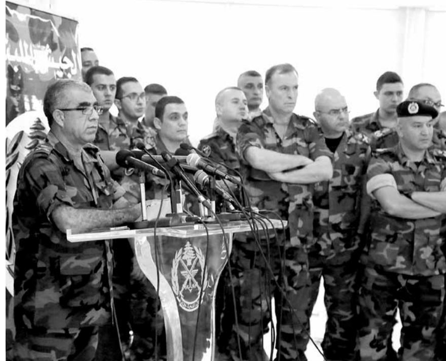
خلال المؤتمر الصحفي في البرزة لشرح سير العمليات

وكانت قيادة الجيش - مديرية التوجيه قد أصدرت بيانا جاء فيه: نفذت وحدات الجيش القتالية اعتباراً من فجر اليوم (امس) وتحت غطاء جوي ومدفعي مكثف، المرحلة الثالثة من عملية «فجر الجرد» ضد ما تبقى من تنظيم «داعش» الارهابي في جرود القاع، وذلك على محورين رئيسيين، حيث تمكنت في نهاية هذا النهار من تحقيق هدفها وهو احكام السيطرة على كامل البقعة الشمالية لجبهة القتال حتى الحدود اللبنانية - السورية، والتي تضم: تلة خلف (١٥٤٦)، رأس الكف (١٦٤٣)، رأس ضليل الضمانة (١٤٦٤)، قراني شعبات الاويشل (١٥٠٠)، المدقر (١٦١٢)، مراح درب العرب (١٤٠٠)، قراني خربة حورثة (١٦٢١)، مراح الدوار (١٤٥٥)، الدكاسة (١٤٩٤)، وبذلك بلغت المساحة التي حررها الجيش بتاريخ اليوم حوالي ٢٠ كلم. وبالتالي بلغت المساحة المحررة منذ بدء معركة فجر الجرد وعمليات