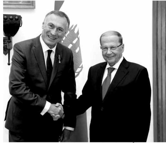
عون مستقبلا السيناتور الفرنسي بوكيل

استقبل الأمين العام لحزب الله السيد حسن نصرالله، معاون وزير خارجية الجمهورية الإسلامية في إيران جابري أنصاري والوفد المرافق له، بحضور السفير الإيراني في بيروت محمد فتحعلي، وجرى خلال اللقاء استعراض آخر الأوضاع السياسية والعامة في لبنان وسوريا والمنطقة. والتقى أنصاري، في مقر السفارة الإيرانية في بيروت، وفدا من ممثلي الأحزاب والقوى الوطنية والإسلامية، في حضور نائب رئيس