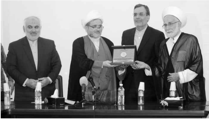
الوفد الإيراني برئاسة أنصاري يزور مقر «تجمع العلماء»

استقبل الأمين العام لحزب الله السيد حسن نصرالله، معاون وزير خارجية الجمهورية الإسلامية في إيران جابري أنصاري والوفد المرافق له، بحضور السفير الإيراني في بيروت محمد فتحعلي، وجرى خلال اللقاء استعراض آخر الأوضاع السياسية والعامة في لبنان وسوريا والمنطقة. والتقى أنصاري، في مقر السفارة الإيرانية في بيروت، وفدا من ممثلي الأحزاب والقوى الوطنية والإسلامية، في حضور نائب رئيس