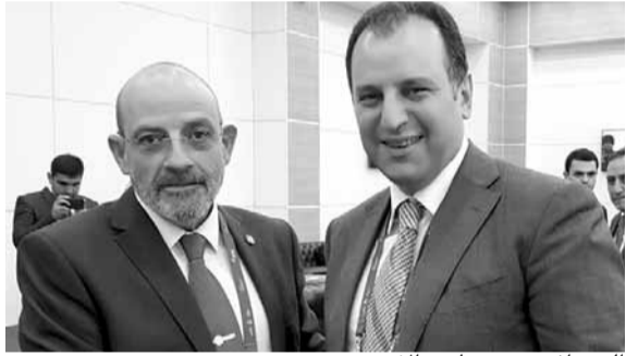
الصراف يزور نظيره الأرميني

التقى وزير الدفاع الوطني يعقوب رياض الصراف الذي يزور روسيا، خلال مشاركته في معرض الصناعات العسكرية، نظيره الأرميني سارغسيان فيغن، وعرض معه الأوضاع العامة في لبنان والمنطقة، وتم التطرق إلى العلاقات الثنائية بين البلدين وسبل تعزيزها وتطويرها، لا سيما في المجال العسكري.