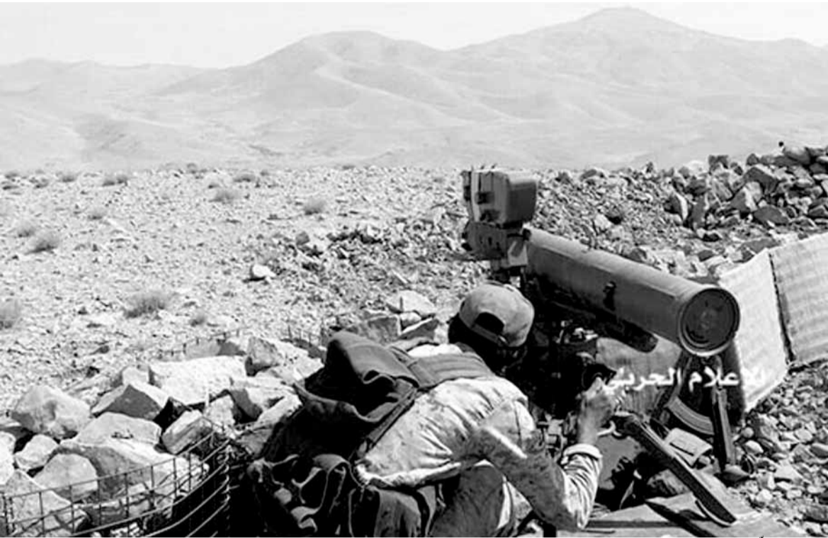
مقاوم يصوب نحو تحصينات «داعش»