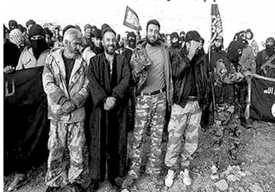
موقف الجرباني الملقب بابو السوس بالعباءة (امير داعش في القلمون)

احد مواقع الارهابيين في القلمون الذي سيطر عليه حزب الله والجيش السوري