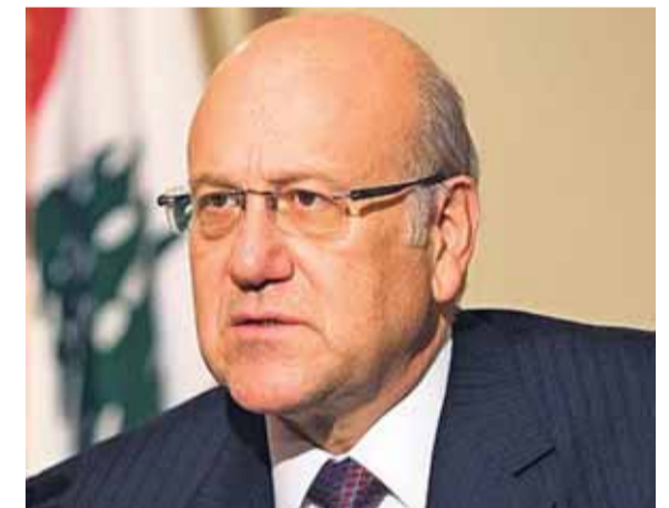
دولة الرئيس نجيب ميقاتي (التفاصيل صفحة ٦)