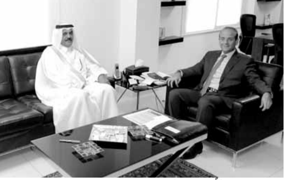
خوري مستقبلاً سفير قطر

والتجاري لما يعود بالفائدة على الطرفين. ومن جانبه تمني سعادة السفير المري للجمهورية اللبنانية ولشعبها الشقيق مزيداً من التطور والازدهار في المجالات كافة وتحديداً في المجال الاقتصادي والتجاري.»