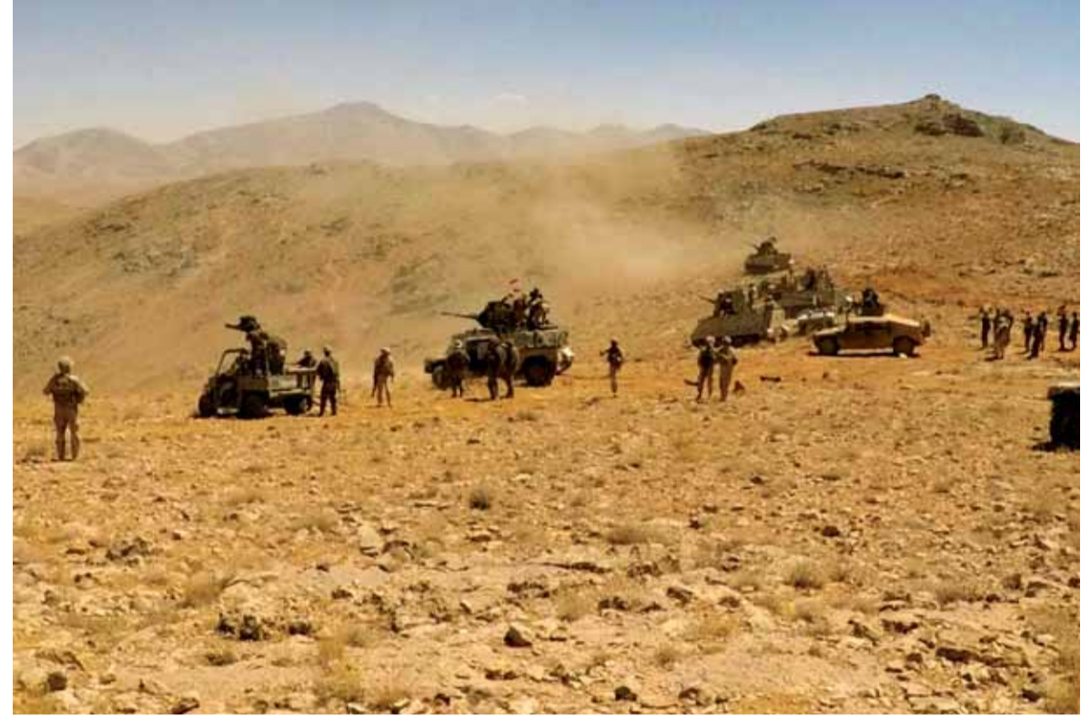
الجيش اللبناني على قمة تلة الكف الاستراتيجية

الجيش ومقاتلي داعش الإرهابي والتي كانت عبارة عن مجموعات صغيرة من مسلحي التنظيم يقاثلون الجيش من أجل تأخير تقدم الجيش بهدف تأمين انسحاب المجموعات الكبيرة من داعش الى الأراضي السورية ويسمى هذا القتال في المفهوم العسكري «قتال تأخيري».