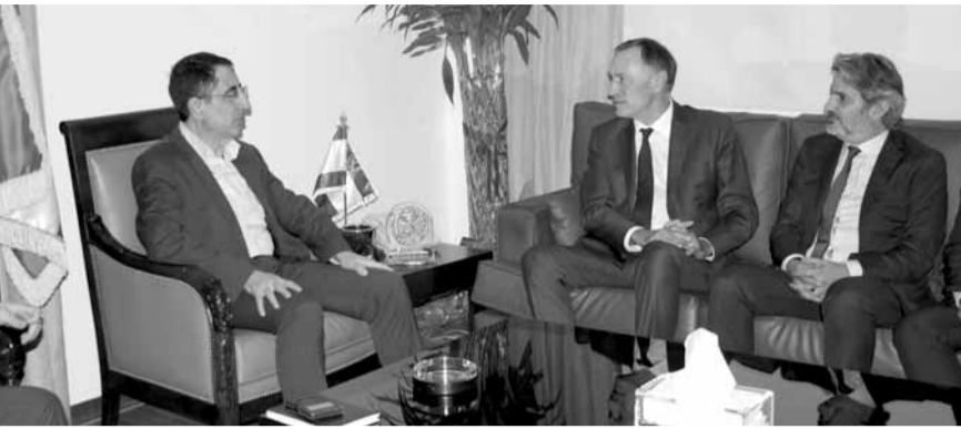
الحاج حسن مع السناتور الفرنسي

استقبال وزير الصناعة حسين الحاج حسن بعد ظهر امس، السناتور الفرنسي جان ماري بوكيل وأجريا جولة أفق سياسية واقتصادية عامة. وبعد اللقاء، صرح بوكيل: «أشكر الوزير الحاج حسن على استقبالي في إطار زيارتي للبنان. وقد التقيت صباحاً رئيس الجمهورية، والبطريك الماروني أمس، وعُقدت التقى مفتي الجمهورية وعدد من الوزراء والمسؤولين من مختلف الأحزاب والطوائف لبنان