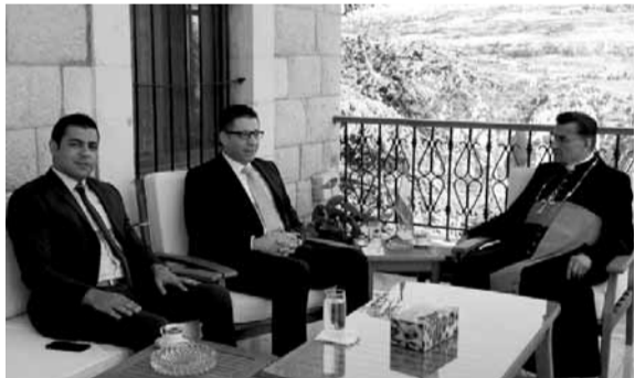
الراعي مستقبلا وفدا من ضباط امن الدولة