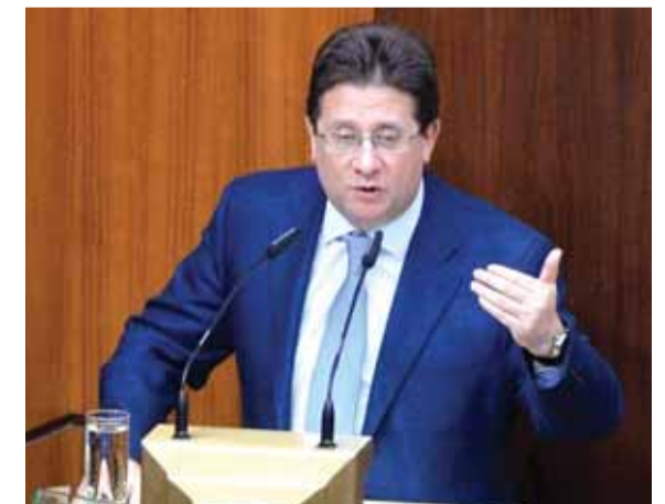
النائب ابراهيم كنعان (التفاصيل صفحة ٦)