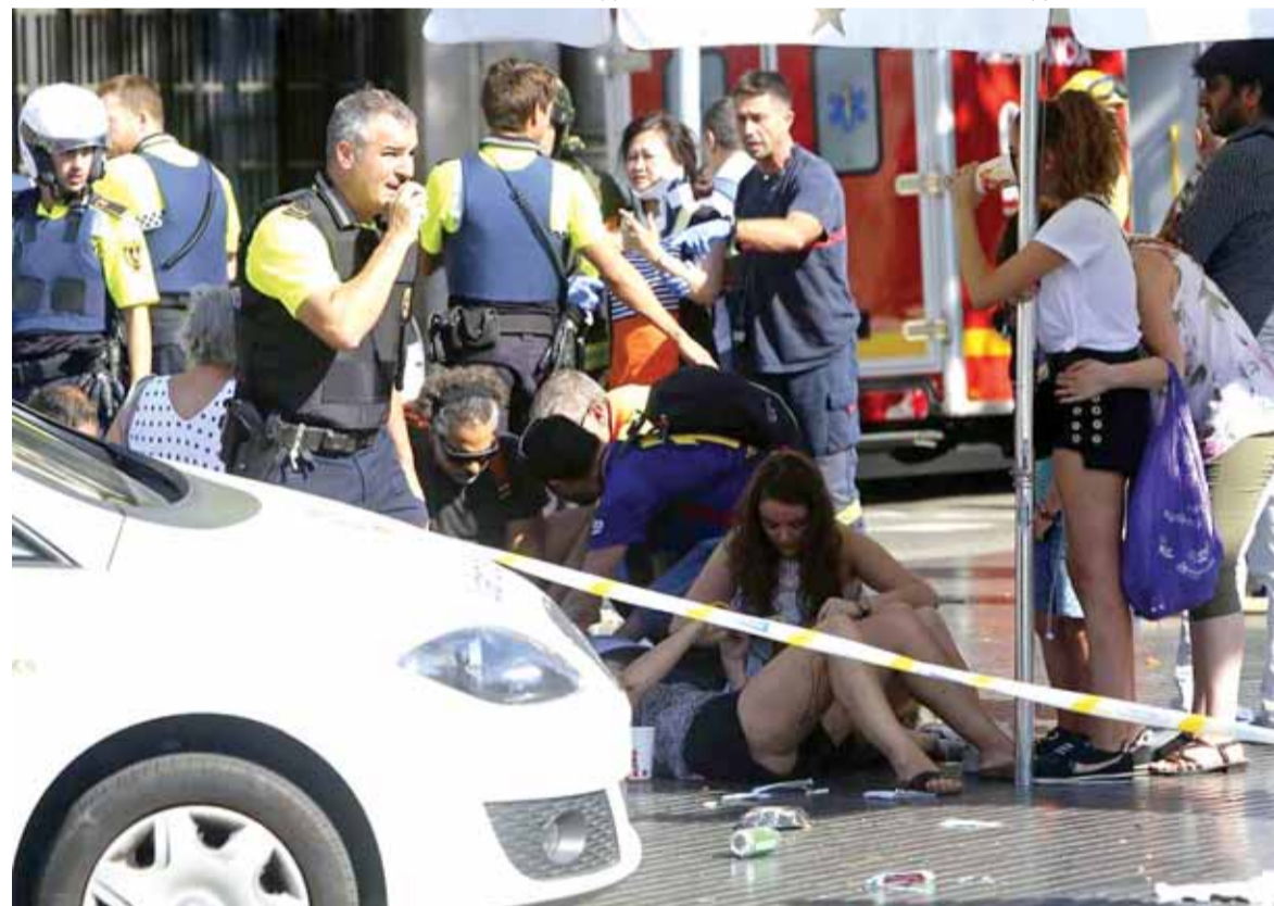
اسعاف مواطنة اسبانية جراء عملية الدهس الارهابية