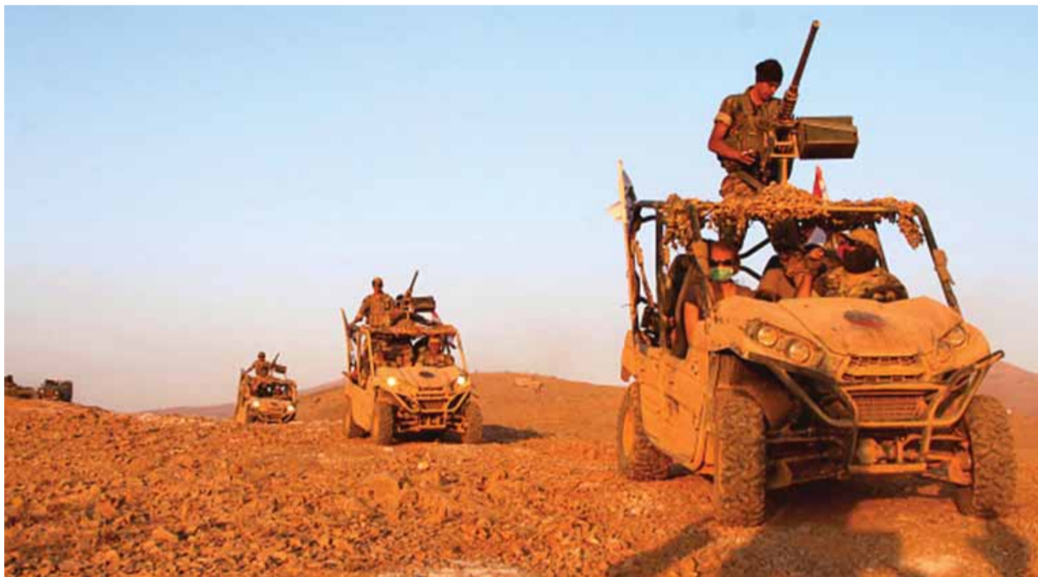
الجيش اللبناني في اعالي الجرد

واشارت مصادر متابعة لملف العملية العسكرية الى انه بمجرد اعلان قائد الجيش اللبناني العماد جوزف عون بدء العملية العسكرية لتحرير جرود رأس بعلبك والفاكهة والقاع عبر بيان رسمي من مديرية التوجيه في الجيش اللبناني، سيصدر بعد لحظات عن غرفة عمليات الجيش السوري وحزب الله بدء العملية العسكرية لتحرير جرود القلمون الغربي ومعبر الزماني وجرود الجراجير، وتحديدًا موقعي الحشيشات وابو حديج من اراهمي «داعش» من الجهة السورية. وبالتالي فان قرار بدء العملية العسكرية وتحديد ساعة الصفر بيد الجيش اللبناني وحزب الله والجيش العربي السوري يلتزمان توقيت قيادة الجيش في ما يتعلق بتنظيف الجرود من «داعش». وطوال الايام الماضية واصل الجيشان اللبناني والسوري وحزب الله دك مواقع الارهابيين واستنزافهم وشل قدراتهم، ومنع تحركاتهم، وقطع خطوط التواصل والامداد عبر قصف الجيش اللبناني لمواقع الارهابيين، كما حصل امس من خلال السيطرة على مرتفعات خصاب خزعل والمنصرم وظهر الخنزير، فيما شن الطيران