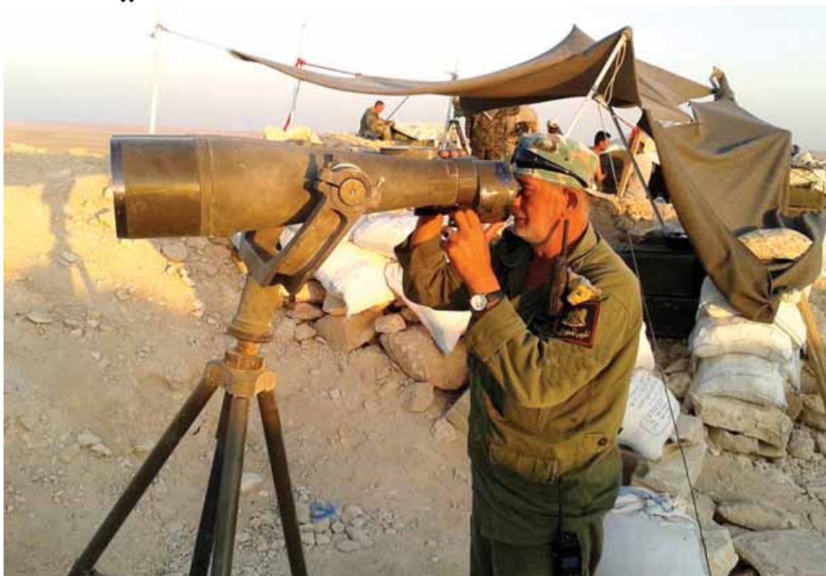
الجيش السوري في ريف الرقة

أعلن المبعوث الأممي إلى سوريا ستيفان دي ميستورا عن تأجيل المشاورات الفنية مع المعارضة السورية التي كانت مقررة في ٢٢ آب، قبيل استئناف المفاوضات مع وفد الحكومة السورية بجنيف. وأوضح دي ميستورا، خلال مؤتمر صحفي، أن تأجيل المشاورات جاء بقرار شخصي منه، موضحاً أنه لم يوجه الدعوة إلى الحكومة السورية للمشاركة في المشاورات الفنية، لأن دمشق ترفض خوض أي لقاءات فنية خارج المفاوضات الرسمية. وأوضح أنه قرر تأجيل المشاورات لأن أطراف المعارضة تمر حالياً بمرحلة صعبة في مناقشاتها الداخلية. وتابع قائلاً: «لا