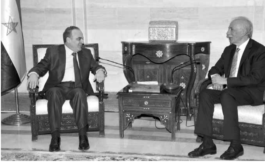
زعيتر مع نظيره السوري

وقال الوزير الحاج حسن: «تشرفت بزيارة معالي وزير الاقتصاد تلبية لدعوته للمشاركة في معرض دمشق الدولي. واجرينا جولة أفق اقتصادية وسياسية وقيمتا كيفية تطوير الأمور منذ ٢٠١١ على مختلف الصعد ولا سيما الاقتصادية. وبحثنا في التفاصيل على الصعيد التبادلي