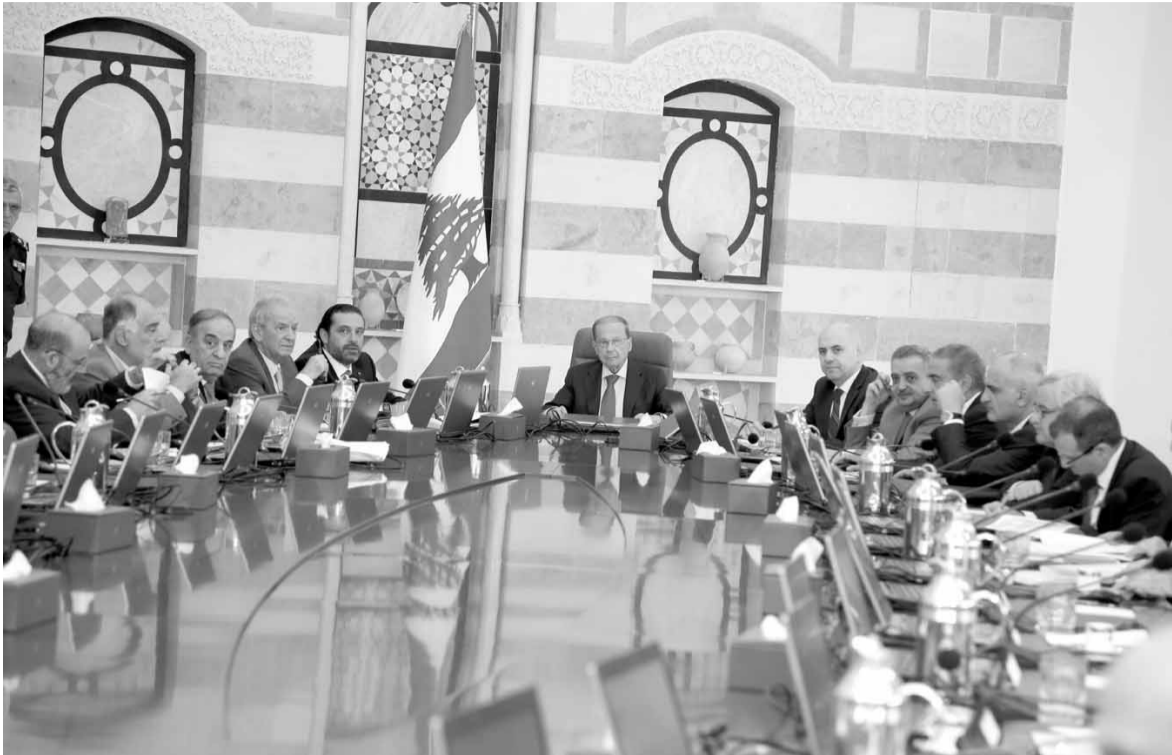
عون يترأس جلسة مجلس الوزراء

٢٩/٤/١٩٧٢ والذي يتعلق بموظفي الفئة الأولى المعيّنين داخل الملاك العام والمصنّفين من خارجه، والمديرين العامين الموضوعين بالتصرف.