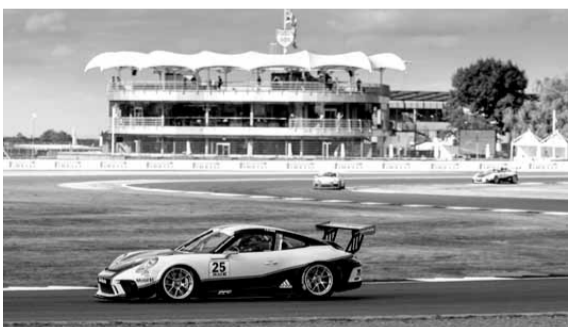
السائق العماني خلال جولة سيلفرستون

من المهم تسجيل النقاط ل٣ سيما وأني تواجدت في مركز جيد مع مشاركة ٣٢ سيارة». وأضاف: «بيدات سباق في المركز الـ ١٨ على شبكة الانطلاق ولكني تمكنت من التقدم والدفاع عن مركزي في بعض الأحيان. أعتقد بأن الحلبات التي تتميز بمنعطفات سريعة تلائم طريقة قيادتي».