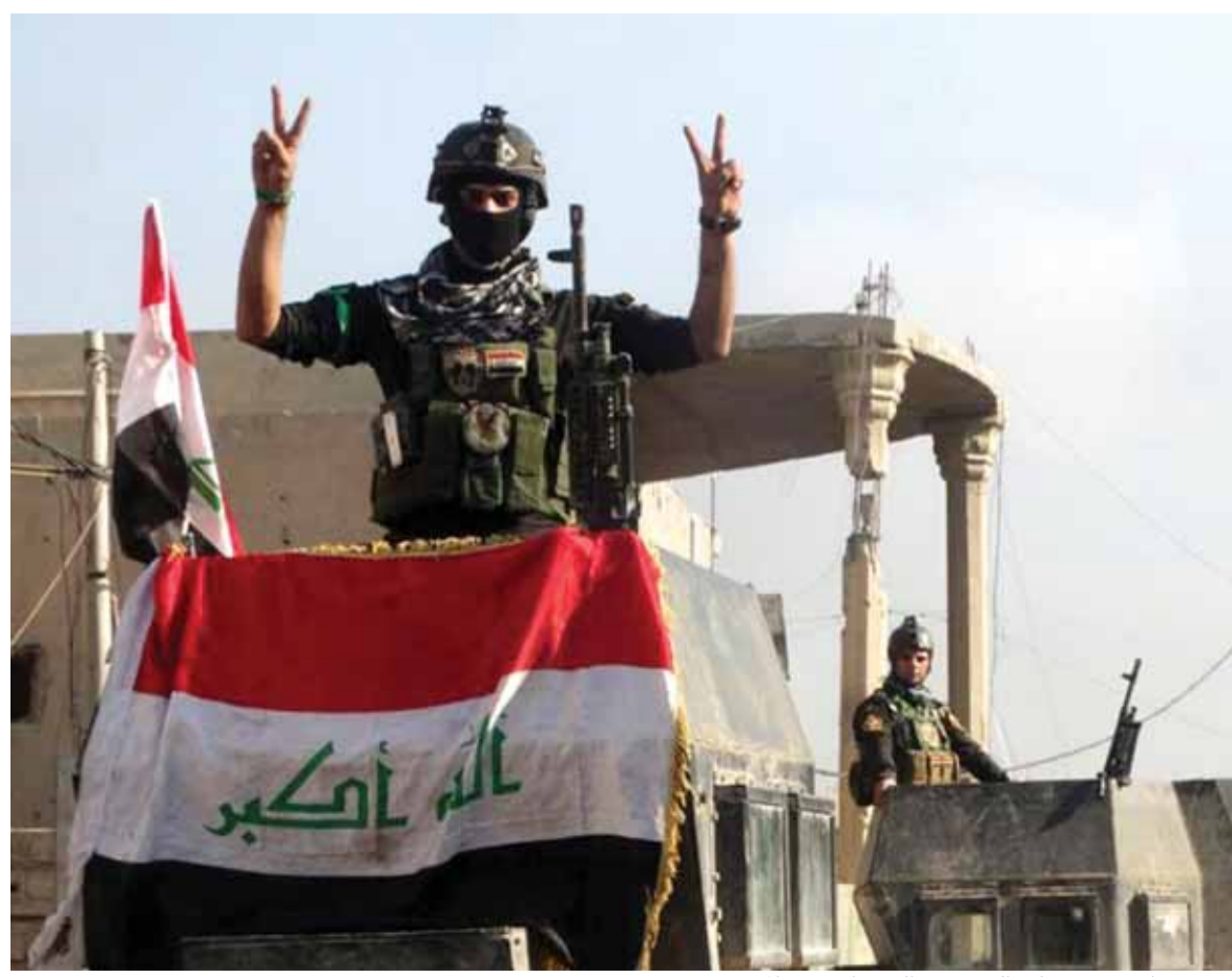
جندي عراقي يرفع شارة النصر في الشهبان غرب الموصل

لا تزال المعارك الجانبية قائمة في الموصل رغم مرور أكثر من أسبوع على اعلان رئيس الوزراء العراقي حيدر العبادي النصر على «داعش» وتحرير الموصل من التنظيم الارهابي، حيث لا يزال دوي المدافع الرشاشة ورشقات النيران والانفجارات تسمع في الشطر الغربي من المدينة. من جهة أخرى برز الى الواجهة امس ما أعلنه المتحدث باسم سلطات اقليم كردستان لاهور طالباني من ان الحكومة والاجهزة الامنية الكردية متأكدة «٩٩% من ان البغدادي لا يزال حياً يرزق وهو موجود في الرقة». اما على الصعيد الانساني، فالحالة في غاية التعقيد داخل الموصل حيث هنالك دعوات الى الانتقام من مواطنين وعائلات يشتبه في تعاونهم مع تنظيم «داعش» كما ذكر تقرير نشرته «الانديبننت الايرلندية». وذكرت الصحيفة ان الوضع في الموصل يشبه الوضع القائم في العراق ككل، حيث تتهم المكونات المسيحية والشيعية والأيزيدية المواطنين السنة بالتعامل مع «داعش» ومساعدتهم خلال الابداء التي لحقت بهذه المجموعات. هذا التقييم للحالة العراقية ما بعد سقوط «داعش» يتلاقى مع المخاوف الدولية التي حذرت من أن ينتقل العراق من الحرب على «داعش» الى حرب داخلية جديدة تقضي على ما تبقى من مكونات الدولة والمجتمع. ■ استمرار المعارك هذا وذكر مصدر أمني أن مواجهات متقطعة تجري بين مسلحين من تنظيم الدولة والقوات العراقية في منطقتي (تتمة الخبر العراقي ص ١٦)