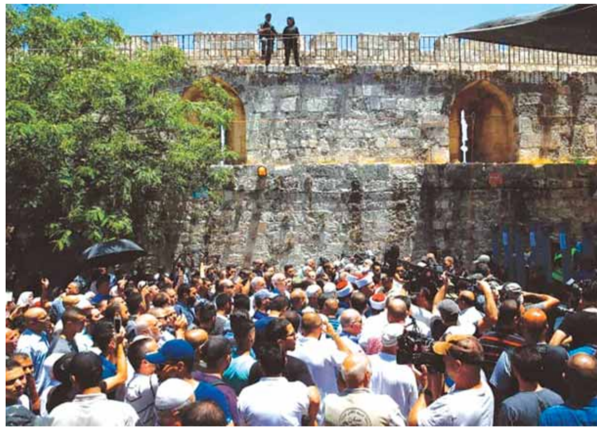
استمرار اقبال المسجد الاقصى امام المصلين