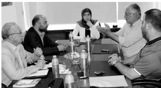
عز الدين تترأس الاجتماع