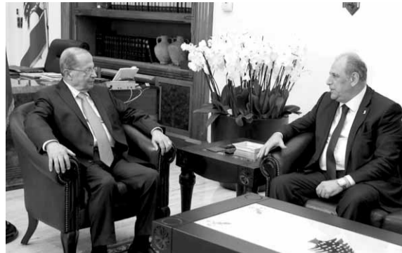
عون مستقبلاً الجراح

اجاب: «ان اىصال الانترنت سريع ويسعر معقول للمواطن يستلزم ستنترالات جديدة وقد قمنا بتلزييمها، وتخفيض اسعار وقد انجزناه، كما قمنا بتخفيض اسعار الخطوط الدولية، بالإضافة الى صيانة الشبكات حيث ان ورش الوجيهو تقوم بعملها ليلا نهارا في الطرق لاصلاح الشبكة وصيانتها، بحيث تتمكن شبكة النحاس الموجودة من اىصال سرعات معقولة، هي ليست طموحا الا انها معقولة، ربما بحدود عشرة اضعاف السرعة التي كانت موجودة، وصولا الى مشروع الفايبر اوبتيكس الذي يضمن سرعات خمسين ميجابايت واعلى لكل المواطنين على كل الاراضي اللبنانية. ان هذا المشروع هو المحلل والنهائي والطموح لموضوع حل قضية الانترنت في لبنان».