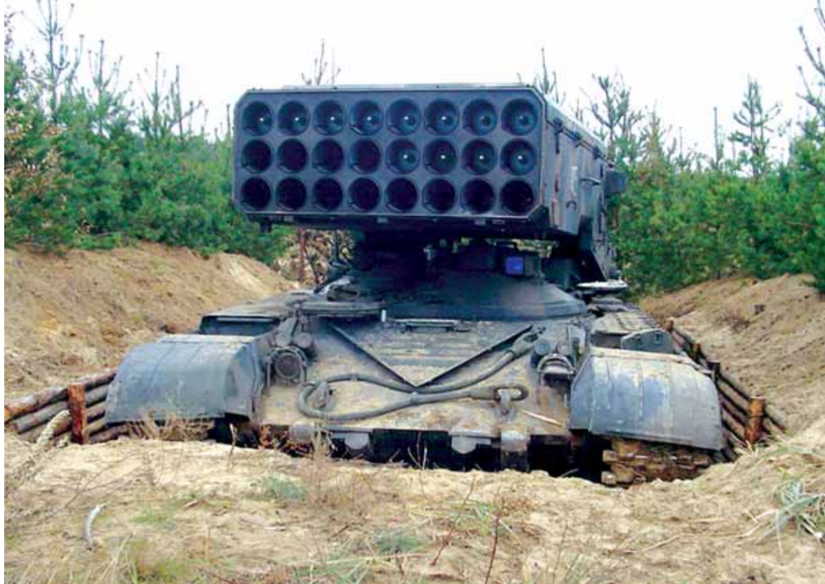
«الشمس الحارقة» أو توس «وان ايه وان» دخلت الجرد!!

الحدود اللبنانية، بما يمثل ذلك من تحول استراتيجي في طبيعة الحرب الدائرة في سوريا، وقد ذكرت اوساط معنية بهذا الملف ان تكتيكات عسكرية جديدة، واسلحة نوعية جديدة، ستستخدم في المواجهة المرتقبة، ومن المؤشرات على قرب بدء المواجهة، ادخال الجيش السوري بالامس تعزيزات نوعية الى مواقعه على الجانب الاخر من الحدود، ومن بينها اسلحة «تكتيكية» متطورة لعل اهمها صواريخ «بي ام ٢٧ ايرغان»، وراجمات صواريخ روسية معروفة باسم «الشمس الحارقة» او توس «وان ايه وان»، اضافة لراجمات متطورة من نوع «يو آر ٧٧» المتخصصة في تدمير التحصينات في الجبال، وهي راجمات متخصصة في إطلاق شحنات متفجرة، وهي مجهزة صاروخياً وتستطيع تحقيق اختراقات وانفجارات ضخمة تمكنها من هدم وتدمير اهداف محصنة ضمن دائرة بطول ٩٠ متراً وعرض ٦ أمتار، وتطلق الراجمة هذه النار عبر حبال صاروخية مزودة بعوات متفجرة، وهو سلاح يستعمل بشكل خاص في مناطق الاشتباك الخالية من المدنيين، كما انها وسيلة وفعالة لإزالة الألغام. ووفقا لتلك الاوساط، فان القيادة العسكرية الروسية ابدت استعدادها للمشاركة الفاعلة في المواجهة عند الضرورة، الطيران الروسي سيكون جاهزاً للمؤازرة اذا ما احتاج الامر الى ضرب تحصينات موجودة داخل «الغاور» في الجرد، ولن تتوانى القوات الروسية عن استخدام القاذفات الاستراتيجية او صواريخ «كاليبر» المجهزة التي تطلق من البحر، اذا ما طلب منها ذلك، فالروس «متحمسون» للمشاركة في هذه المواجهة (تتمة المانشيت ص ١٦)