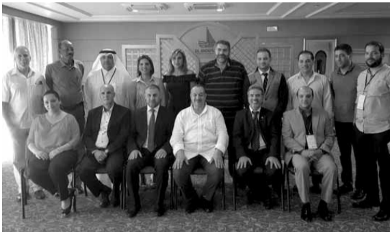
الاتحاد العربي للجهاز