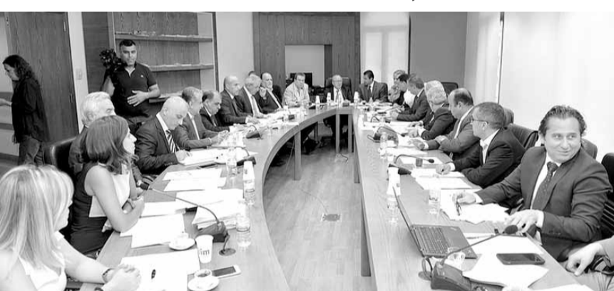
اجتماع لجنة الاشغال

واقربنا بعضها وتوصلنا الى الصياغة النهائية، وختم: «هناك دورة تراخيص للشركات النقطية التي ستدخل العرض والحد الأقصى هو ١٥ ايلول بحيث يجب ان يقر قانون الاحكام الضريبية في اقر وقت واليوم قبل غد، لان الشركات التي ستدخل العرض تحتاج الى ان تطلع على الضرابن الموضوعة قبل تقديم عروضها، ونحن نريد نجاح الدورة المقبلة في ١٥ ايلول، ونريد ان نرفع علم بدء التققيب عن النفط من مياها الإقليمية وان نحصل على مشاركة جدية في التققيب عن النفط والغاز. وهذا الامر اذا حصل سينعكس ايجابا على الوضع المالي والاقتصادي في لبنان، والامر الثاني سيغطي دعما معنويا للشعب اللبناني بأنه سيخرج من ازمة».