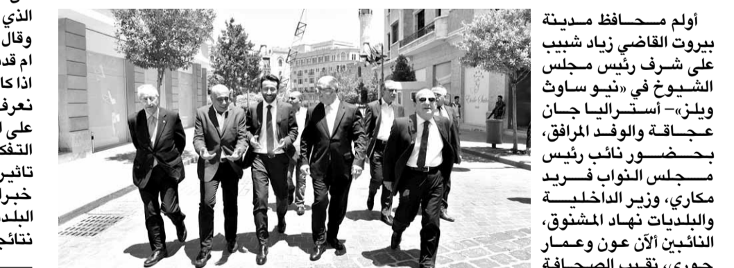
خلال الجولة في الوسط التجاري

اكّد النائب سرح طورسركيسيان، في تصريح امس، ان علينا معرفة المواصفات لعمل معالجة النفايات، الذي أعلن عنه رئيس بلدية بيروت جمال عبيتاني، وقال: «علينا ان نعرف ما هي مواصفاته هل هو جديد ام قديم. فاذا كان مصدره صينيا فهذا شيء مخيف اما اذا كان من مصدر اوروبي فلا بأس»، اضافة: «نريد ان نعرف في اي منطقة سيتم البناء وما هو تأثير العمل على المواطن القريب ومن العمل الذي سيعمل على التفكيك الحراري كذلك المواطن البعيد عنه، وما هو تأثيره على البيئة»، مؤكدا ان «المطلوب استشارة خبراء واطلاع الراي العام». وتابع: «انا لانتهى رئيس البلدية ولكن نريد ان يكون الامر شفافا ونحشى نتائجه ونريد ان يتم كل شيء بوضوح».