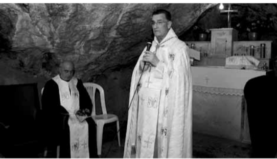
الراعي يترأس القداس

قول الحقيقة حتى دفاعاً عن شخص مظلوم. وعلينا أن نأخذ أيضاً بحاجة لشهادة لصالح الحق والخير والجمال والعقل والسلام. نحن في عالم من الشر والقتل ولا أحد يتجرأ على قول الحقيقة ونرى التجني والنظم والحروب على البشر وملايين من الناس مشردون على الطرقات ولا أحد يستطيع قول كلمة الحق لأنه يوجد مصالح اقتصادية وسياسية.