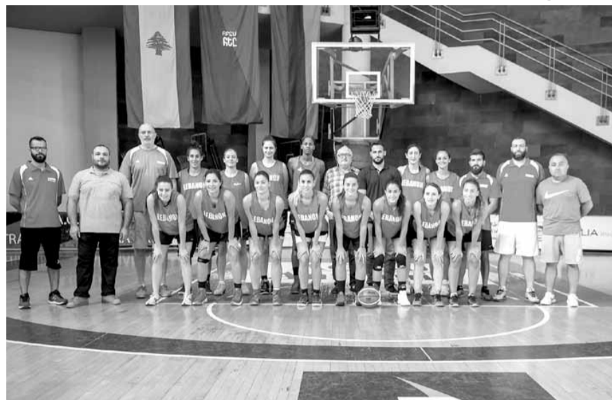
كاخيا وفوز مع منتخب لبنان للسيدات

لمعسكر في تركيا خلال شهر تموز المقبل سيخوض خلاله أكثر من مباراة مع أهم الفرق التركية.