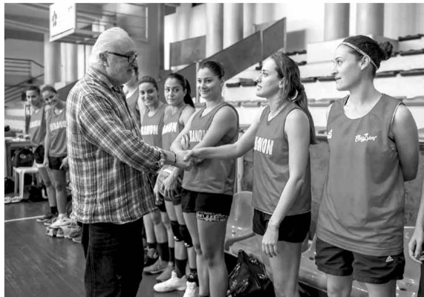
... ويصافح اللاعبات

الجدير بالذكر أن بنزيمة سجل ١٨٠ هدفاً منذ انضمامه لريال مدريد عام ٢٠٠٩، ونجح في الحصول على اللقب مرتين، ودوري أبطال أوروبا ثلاثة مرات.