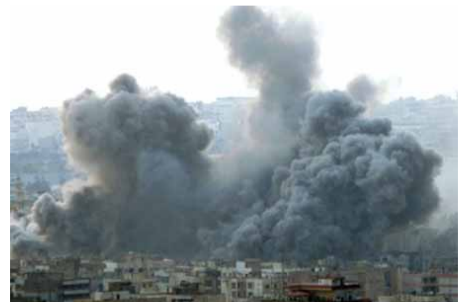
دخان القصف الاسرائيلي على محيط مدينة «البعث»

من جهة اخرى، استهدف الطيران الحربي التابع للعدو الاسرائيلي دبابتين وموقعا