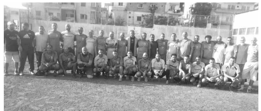
طرفا المباراة النهائية في فئة القدامى

برعاية الوادي الأخضر للعقارات، احرز منتخب صيدا لقب فئة القدامى في دورة رمضان السابعة لكرة القدم التي تنظمتها مصلحة الرياضة في صيدا والجنوب في تيار المسقبل بفوزه في المباراة النهائية على منتخب السكسية ٤-٣ (الشوط الاول ٢-١).