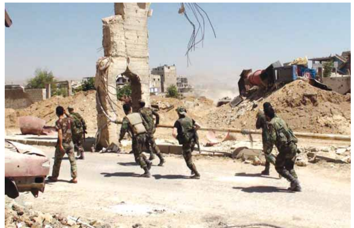
قوات سورية في ريف تدمر

أكدت مصادر ميدانية فشل الهدنة المعلنة بمدينة درعا منذ اسبوع، فيما تحدث نشطاء في شبكات التواصل الاجتماعي عن معارك عنيفة قرب معبر نصيب الحدودي مع الأردن. وانتشرت في شبكة الإنترنت لقطات مصورة لمعارك في محيط المعبر، وأفيد على صفحاتها أن الجيش السوري يقصف بعنف معبر نصيب الحدودي «بالأسلحة المناسبة» بعد أن تجمع فيه عدد كبير من مسلحي المعارضة والبعثات القتالية وصواريخ وراجمات آتية من الأردن. وجاء تصعيد المعارك بعد أن تحدث نشطاء للجيش السوري مجدداً عن سيطرة الجيش على المعبر في إطار اتفاق مع المعارضة، إلا أن مصادر عسكرية نفت التوصل إلى أي اتفاق من هذا المصالح. وقال مصدر ميداني إن «المصالحة فشلت»، وأوضح أن مدة الهدنة انتهت وبادر بها الطيران الحربي السوري باستهداف مواقع المسلحين، مؤكداً أن الجيش سيطر على كتبية الدفاع الجوي المعروفة باسم «القاعدة» الواقعة غرب درعا البلد، قبل أن ينسحب منها. واعتبر أنه «لو تم التشبث