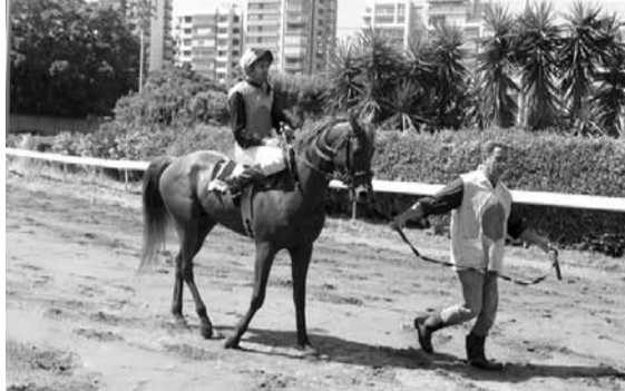
برق ورعد: اذا تمتع بخيال يبرق ويرعد وعندو ركاب فلا مجال لفسارته جهوزية بارقة، وحالة راعدة...

حفلة اليوم حفلة فافوري مئة بالمئة ابعد الله عنها الكومبينات والايادي الائمة... ونامل بان لا يكون فيها المشاكس عدنان ونمره «نمر بيروت» ولا ابن بطوطة وعلاء... حتى تمر هذه الحفلة بخير ويكون المراهن مرتاح ويعيد بفرح..