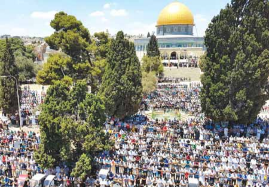
المشاركين في الصلاة