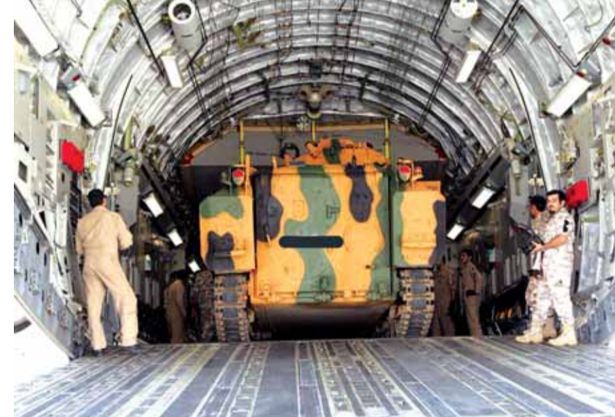
انزال آلية تركية في الدوحة

قدمت الدول المقاطعة لقطر قائمة من ١٣ مطلباً للدوحة وأمهلتها ١٠ ايام لتنفيذها، من أجل إنهاء الأزمة الحالية الناتجة من تصرفات الدوحة وتدخلاتها في الشؤون الداخلية للدول بهدف زعزعة الاستقرار فيها. هذه القائمة التي سلمتها الكويت إلى قطر سريتها «الشقيقة»، كما أشار وزير الدولة الإماراتي للشؤون الخارجية، أنور قرقاش، في تغريدات له، وقال إن التسريب يأتي ضمن مساعي قطر لإفشال الوساطة الكويتية. وكتب قرقاش على تويتر أن «عودة قطر للمظلة الخليجية مشروطة»، مشيراً إلى أن «هناك أزمة فقدان ثقة حقيقية مع الدوحة». وأضاف: «قطر تؤدي دور «حصان طروادة» في الخليج، وهذا يجب أن يتوقف»، معتبراً أن حل الأزمة ليس في طهران أو بيروت أو عواصم الغرب. ولفت الوزير الإماراتي إلى أن «سنوات تأمر قطر لها تمن، والعودة للجيران لها ثمن أيضاً». وتابع: «قطر تقدم تمويلاً ومنصة إعلامية وغطاء سياسياً لأجندة التطرف».