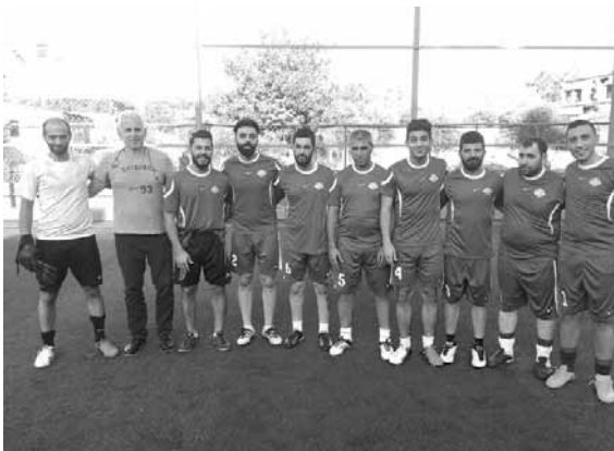
احد الفرق المشاركة