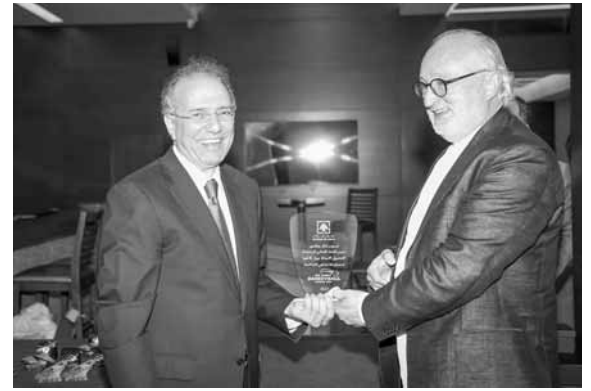
درع من العنذاري الى كاخيا