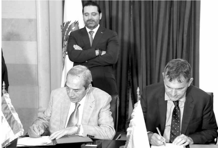
الحريري خلال رعايته توقيع الوثيقة

الأمم المتحدة تبقى شريكاً أساسياً ومهما في مساعدة لبنان ودعمه في تحقيق التنمية المستدامة».