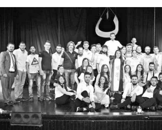
الطلاب المشاركون في المسرحية

من جهته، ركز بييري، على «ضرورة الالتزام بترتيبات التنسيق والارتباط»، وأكد أن «المحافظة على الاستقرار هي مسؤولية الجانبين، وأن القوات الدولية جاهزة لمساعدتهما على ذلك».