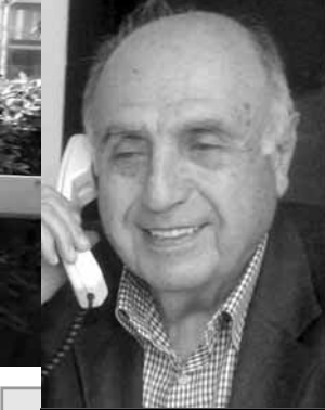
اعداد : لوران ناكوزي