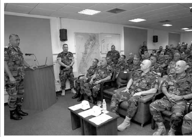
عون يتفقد الكلية

تفقد قائد الجيش العماد جوزف عون قبل ظهر أمس، كلية فؤاد شهاب للقيادة والأركان في الريحانية، حيث جال في أقسامها واطلع على أوضاعها وسير التعليم العالي فيها لدورتي ركن وقائد كتبية. بعد ذلك،