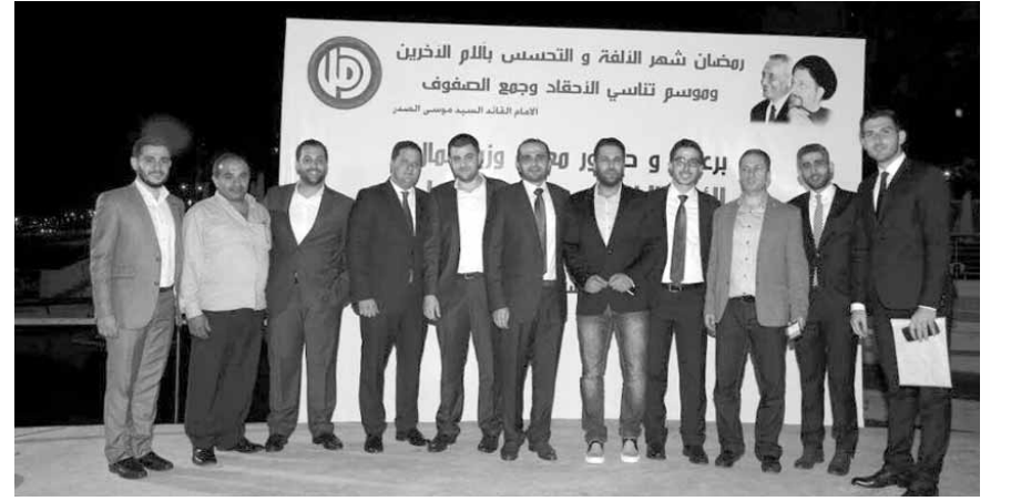
اعضاء مكتب الشباب والرياضة في حركة أمل