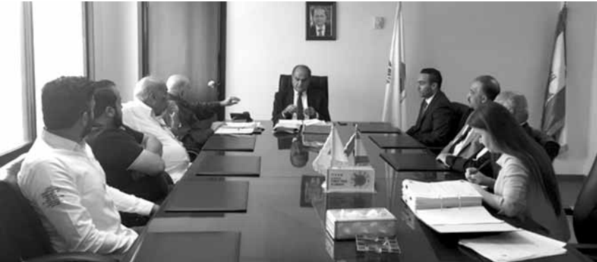
الخطيب مع الوفد

ضوء قرار وزير البيئة اقبال المسالخ في المنطقة. وشدد الخطيب على عدم السماح باستمرار العمل في المسالخ الموجودة في المنطقة بشروط بيئية غير مقبولة، ووعد اصحاب المسالخ باخذ التدابير اللازمة لتصحیح وضعها البيئي.