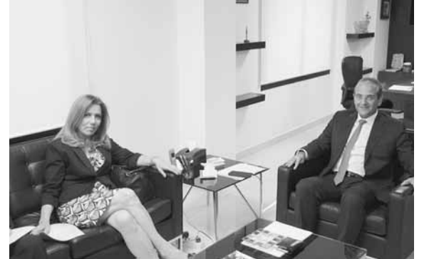
خوري مع احدى السفيرات

استقبل وزير الاقتصاد والتجارة رائد خوري قبل ظهر امس، سفيرة تشيكية في لبنان ميكايلافرونكوف، وبحث معها في العلاقات الثنائية بين لبنان وتشيكيا وسبل تعزيزها. وتطرق البحث الى اهمية تطوير التبادل التجاري بين البلدين. والتقى الوزير خوري ايضا سفيرة تشيلي في لبنان مرتا شلهوب، وعرض معها للعلاقات الاقتصادية والتبادل التجاري بين لبنان وتشيلي وضرورة تحسينه بما يؤمن مصلحة البلدين.