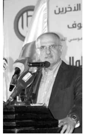
الوزير خليل يلقي كلمته