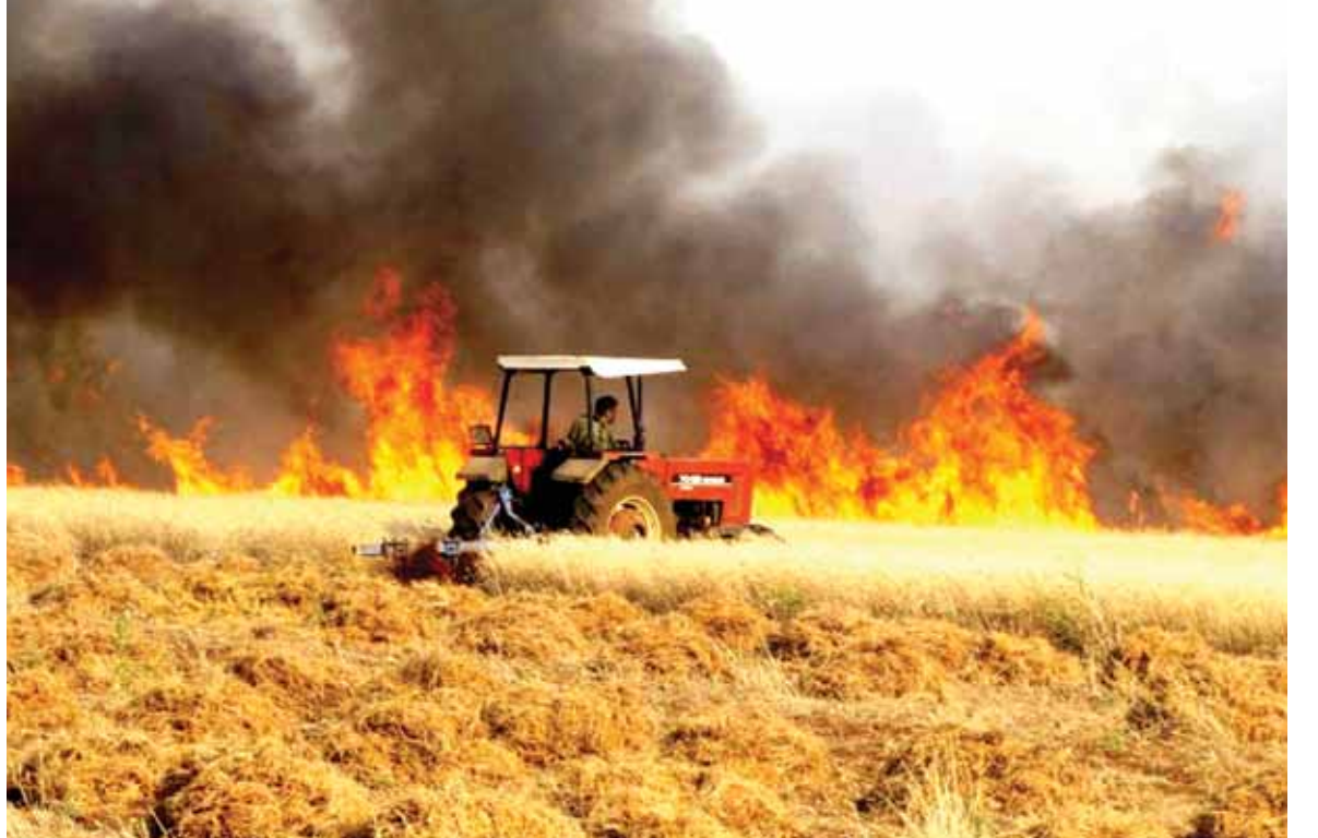
المسلحون حرقوا حقول القمح في درعا

أعلن التحالف الدولي بقيادة واشنطن إسقاطه لطائرة مسيرة تابعة للقوات الموالية لدمشق، في محيط معبر التنف جنوب سوريا، في ثالث حادثة من هذا القبيل خلال شهر. وأوضح التحالف في بيان أن إسقاط الطائرة السورية جاء بعد «إظهارها بنية معادية واقتربها من مواقع قوات التحالف». ووقع الحادث قرب المنطقة التي أسقطت فيها طائرة مسيرة أخرى في ٨ حزيران الجاري، بعد القائها قنابل قرب مواقع القوة الأميركية المنتشرة في التنف. وأوضح التحالف الدولي في بيان أن مقاتلة «F-15E» قامت باعتراض الطائرة المسيرة، عندما اقتربت من (تتمة الخبر السوري ص ١٦)