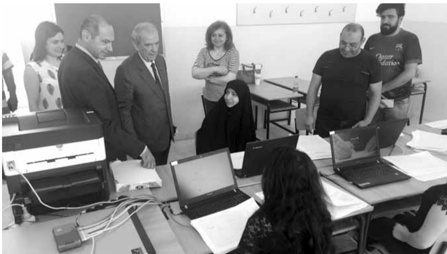
خلال جولة حماده

فرص العمل التي تليق بهؤلاء الشباب والصبايا في المستقبل القريب، ولاسيما ان عدد المرشحين للمهني يبلغ عشرين ألفاً، ويتوقع صدور النتائج بين الخامس والسادس من تموز».