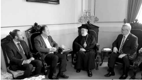
عودة مستقبلاً نائين يونانيين

تحمّل صليبا، وهي تحمله بفخر، ونحن فخورون بكوننا أرتوذكسيين. سننقل مشاعرنا وما تلقيناها من معلومات إلى اليونان، لكي يدرك اليونانيون أي صليب تحمل الكنيسة الأرثوذكسية هنا ويعرفوا ضخامة العمل الذي تقوم به الكنيسة ويقوم به سيادته».