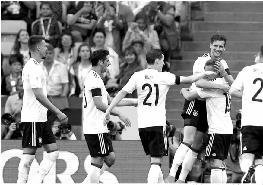
الفرحة الألمانية بالهدف الثالث

حقق منتخب ألمانيا لكرة القدم فوزاً صعباً على نظيره الأسترالي ٣-٢ أمس الإثنين في سوتشي في ختام الجولة الأولى من منافسات المجموعة الثانية ضمن مسابقة كأس القارات التي تستضيفها روسيا. وبذلك، حقق المنتخب الألماني المكون بمعظمه من تشكيلة شابة لا تضم سوى ثلاثة لاعبين من الذين أحرزوا كأس العالم ٢٠١٤، فوزاً في مباراته الأولى، ليتساوى نقاطاً مع تشيلي (بطلة أميركا الجنوبية ٢٠١٥ و٢٠١٦) في صدارة المجموعة الثانية. وتتفوق تشيلي في الصدارة بفارق الأهداف، بعد فوزها الأحد على الكاميرون بطلاة أفريقيا ٢-٠. وسجل لارس شتيندل (٥) ويوليان دراكسلر (٤٤ من ركلة جزاء) وليون غوريتسكا (٤٨) أهداف ألمانيا، وتوماس روغيتش (٤١) وتوميسلاف يوريتش (٥٦) هدفي استراليا بطلاة آسيا ٢٠١٥. وفي الجولة الثانية بعد غد الخميس، تلعب الكاميرون مع استراليا، وألمانيا مع تشيلي. وشهدت المباراة منافسة بين جيلين شابين، إذ يبلغ معدل أعمار تشكيلة المدرب الألماني يواكيم لوف ٢٤ عاماً وأربعة أشهر، وهي تضم فقط ثلاثة متوجين بمونديال ٢٠١٤ في البرازيل هم المدافعان ماتياس غينتر وشكودران مصطفي والمهاجم يوليان دراكسلر. أما التشكيلة الأسترالية فلا يزيد معدل أعمار لاعبيها عن ٢٦ عاماً.