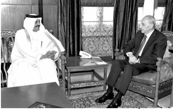
بري مستقبلاً سفير قطر

كما تلقى برقية تهنئة بعيد الفطر المبارك من رئيس المجلس الاعيان الاردني فيصل عاكف الفايز.