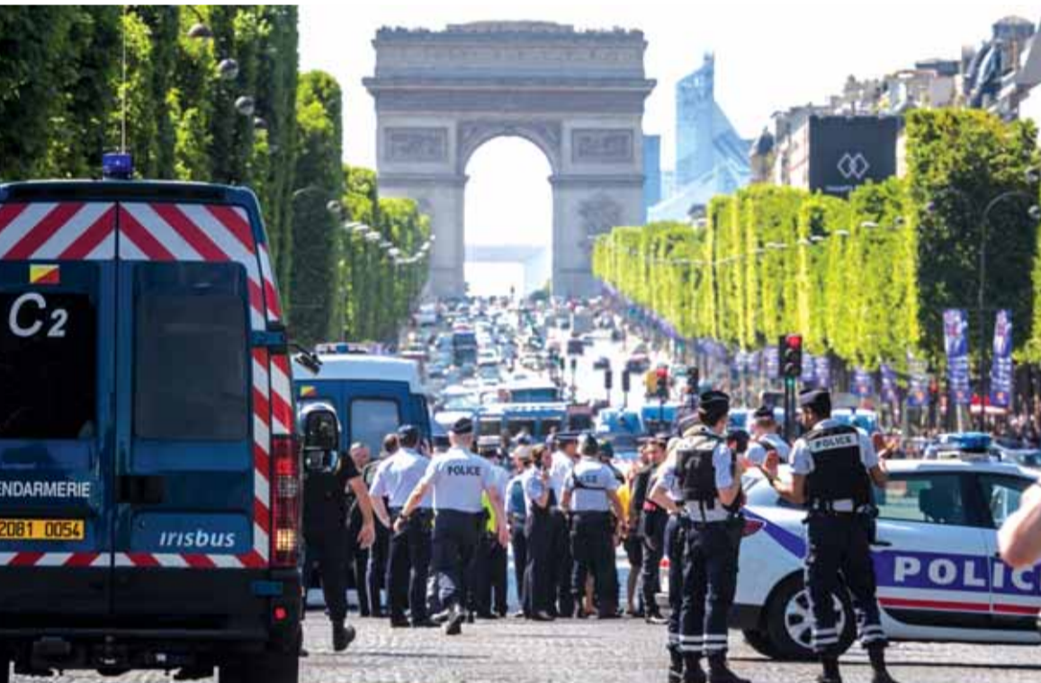
استفزاز للشرطة الفرنسية في مكان العملية

العاصمة الفرنسية. وأكد الوزير أن الحادث كان «محاولة هجوم». واقادت مصادر للشرطة أنها عثرت على قوارير غاز ومسدسات وكلاشنكوف في سيارة المهاجم وهي من طراز رينو ميغان. وأضاف كولومب «لقد تم استهداف قوات الأمن في فرنسا مرة أخرى. وقال إن الأسلحة والمتفجرات التي عثر عليها في السيارة «يمكن أن تؤدي إلى انفجارها».