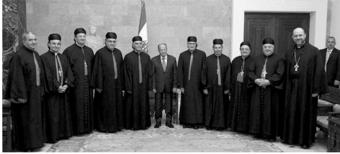
عون مع المطارنة (الدايتي ونهرا)

أكد رئيس الجمهورية العماد ميشال عون، العمل لإعادة تكوين سياسة اقتصادية تقوم على الإنتاج وليس على الاقتصاد الريعي، معتبراً ان القانون الجديد للانتخابات سيقلص الفروقات بين الطوائف ويحقق عدالة التمثيل ويحدث تغييراً في النظام الانتخابي المعمول به منذ ٩١ عاماً. اي النظام الكثرتي، ويبدل في المفهوم السياسي الوراثي ويجعل من لبنان دولة ديموقراطية متقدمة، وذلك خلال استقباله وفد الأساقفة الموارنة في الانتشار، الذي شدد على «ان الإغتراب