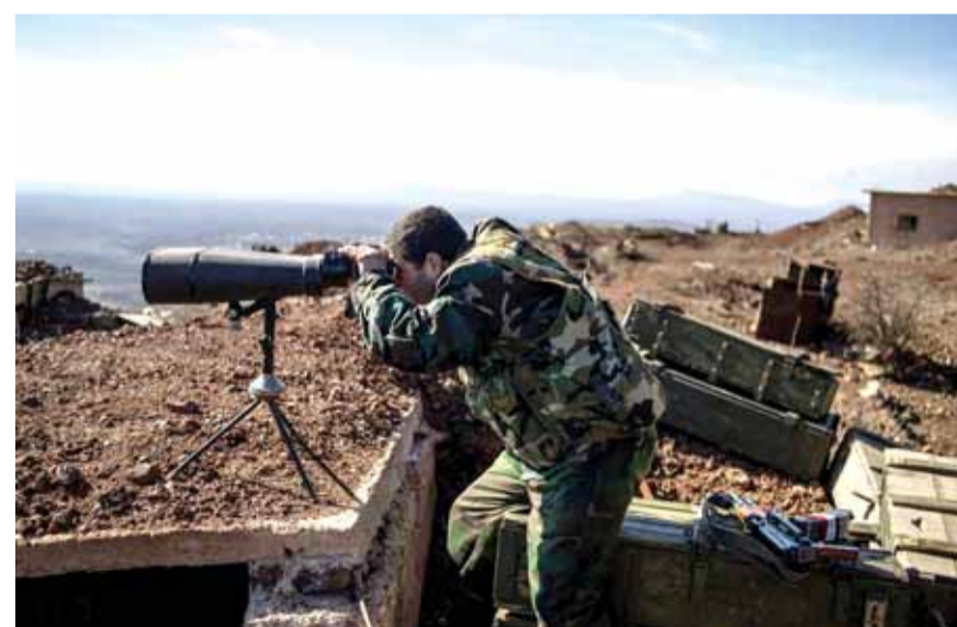
ضابط سوري يراقب المعارك في درعا

الجيش السوري من استكمال عملياته العسكرية ونجح في ربط الحدود وبيئت الفضائيات الاعلامية صور تلاقي الجيشين على الحدود، وفتح الممرات والتأكد على استمرار العمليات العسكرية باتجاه دير الزور لتحرير البوكمال والقائم على الحدود السورية - العراقية، وفتح الممر الاساسي بين الدولتين، وهذا ما اثار غضب واشنطن فقامت بتوجيه رسائل عبر اسقاط الطائرة السورية لمنع تمدد الجيش السوري باتجاه الرقة أيضاً، وردت ايران على الرسالة الاميركية برسالة عالية السقف عبر قصف مباشر للمرة الاولى منذ الحرب السورية من داخل الاراضي الايرانية على مواقع الارهابيين في دير الزور. كذلك تصدي المضادات الأرضية السورية لطائرة استطلاع اميركية، هذا بالإضافة الى تعليق وزارة الدفاع الروسية (تتمتع الخبر السوري ص ١٦)