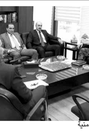
عون مجتمعاً مع قادة الاجهزة الامنية

عودتهم». ولفت الى سعي المطارنة اعضاء الوفد لدى اللبنانيين في بلدان الانتشار الى ان يشعروا بضرورة مساعدة لبنان والقيام بدورهم فيه على مختلف الصعد الإنمائية والاجتماعية والتربوية والسياحية وغيرها. كما أكد متابعة اعضاء الوفد والمسؤولين الروحيين لتسجيل اللبنانيين في السفارات والقنصليات والتعاون مع المؤسسة المارونية للانتشار لاستعادة الجنسية، ولإقامة المؤتمرات والمحاضرات باسم لبنان للتعريف عن حضارته وتاريخه، وتشجيع زيارات سياحية للعائلات والشبيبة ورجال الاعمال الى لبنان.