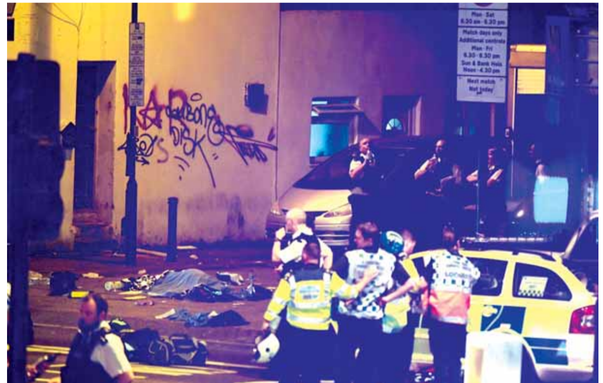
قتل امام مسجد لندن

بسكن قفز من السيارة التي دهست المصلين وطعن شخصا واحدا على الأقل. وأعلن وزير الأمن البريطاني بن والاس أن منفذ عملية الدهس التي استهدفت مجموعة من المصلين قرب مسجد فينسيري بارك شمال لندن ليلة أمس الأحد لم يكن معروفا للشرطة.