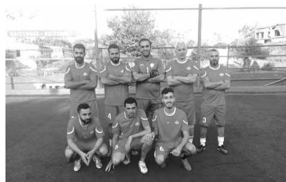
أحد الفرق المشاركة