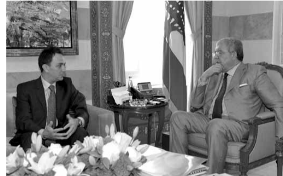
المشوق مستقبلاً بارود

للمرحلة المقبلة لجهة آلية تنفيذ مضمونه لاسيما لجهة اعتماد البطاقة الالكترونية المنصوص عنها في القانون. كما استقبل المشوق النائب فريد الياس الخازن، وعرض معه شؤوناً سياسية وانمائية.