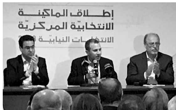
باسيل خلال إطلاق الماكينة الانتخابية

وشدد باسيل على «ان التحدي الجديد المرفوع امامنا هو رفع نسبة المشاركة في الانتخاب، مشيراً الى ان «مصلحة التيار الوطني الحر» هي اعلى من مصلحة اي مرشح في التيار الوطني الحر واليوم يجب تأمين هذه المصلحة ولاحد يسال عن التحالفات وهذا القانون يسمح لنا بالمرونة ونحن مفتتحون على جميع