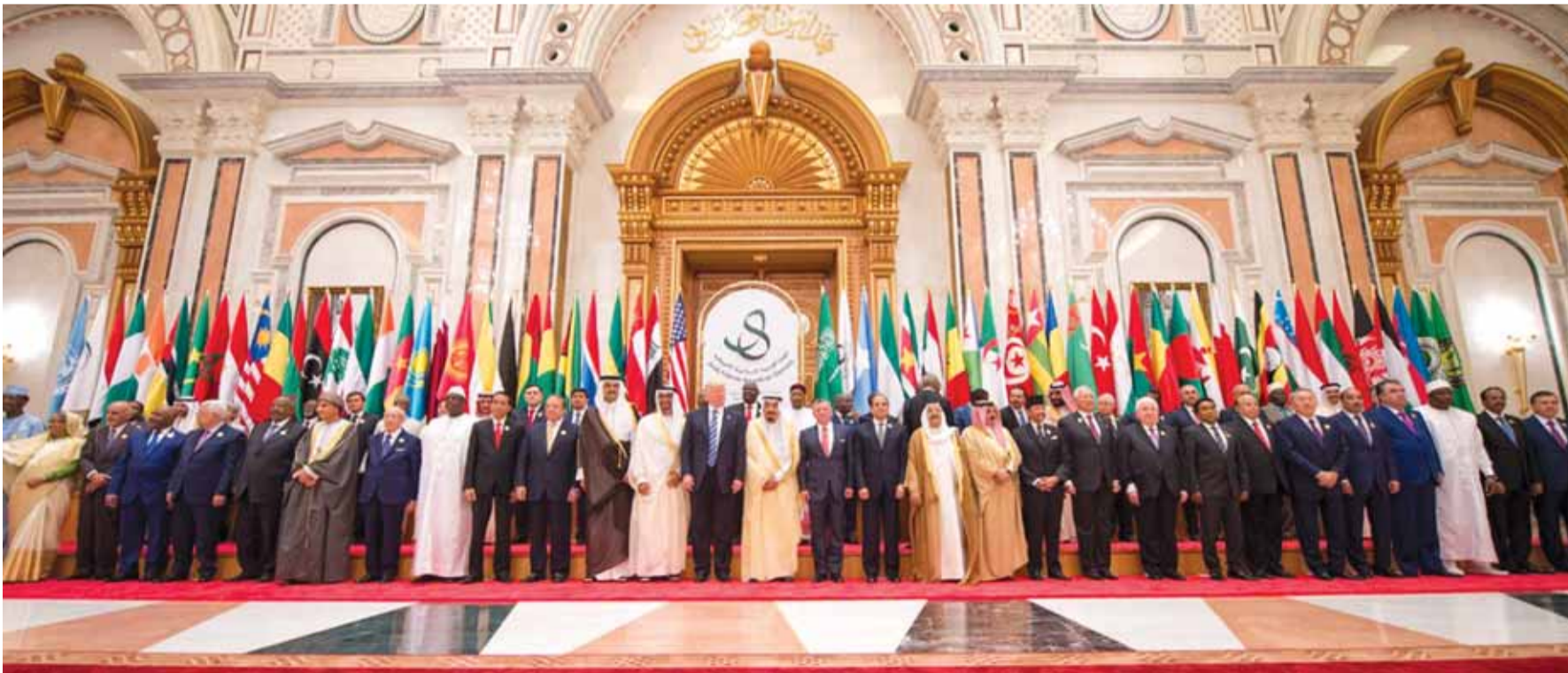
الصورة التذكارية للمشاركين في قمة الرياض

في كلمة القاها امام قادة وممثلين عن ٥٥ دولة في القمة العربية الاسلامية الاميركية، دعا رئيس الولايات المتحدة الى العمل بشكل مشترك على عزل ايران ووضع «حزب الله» في قائمة الارهاب.