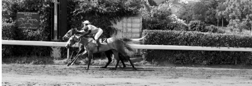
جائزة التحرير الكبرى غالي الثمن (ملهم من الداخل - الفائز وغنايم من برا بدر) الخاسر بفارق انف...