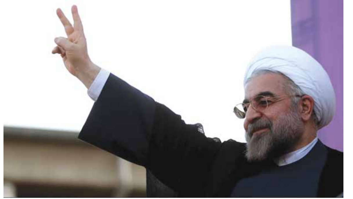
الرئيس روحاني يرفع إشارة النصر

هدوء امني شامل، ولم يسجل اكثر من ٢٠٠ عملية احتجاج من قبل المرشح ابراهيم رئيسي وتم معالجتها. ويعتبر فوز الرئيس روحاني انتصاراً لنهج الاصلاحيين والافتتاح الخارجي في مواجهة المحافظين ومرشحهم ابراهيم رئيسي. واعلنت وزارة الداخلية الايرانية رسمياً، فوز الرئيس حسن روحاني بولاية ثانية في الانتخابات الرئاسية الـ١٢.