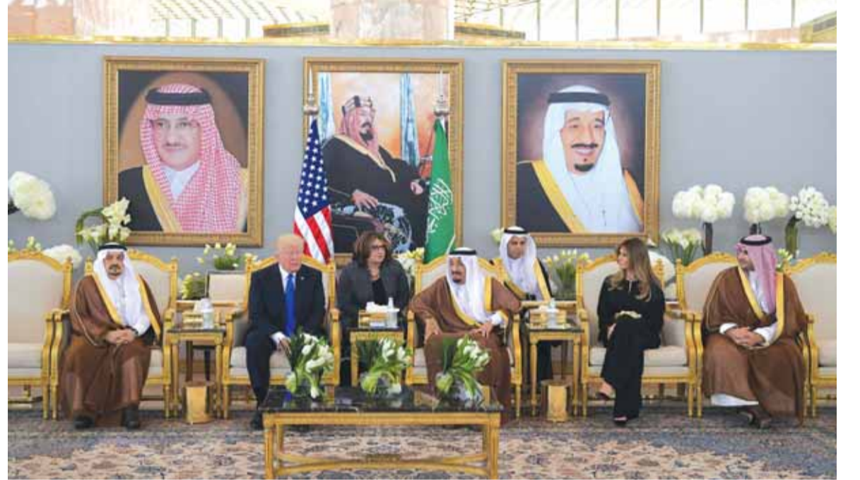
لقاء الملك السعودي والرئيس ترامب بحضور عقيلته وولي العهد وولي ولي العهد

وبعد ٢٠ سنة على قمة شرم الشيخ، فان الهدف ما زال هو نفسه، التصدي ليران وسياساتها في المنطقة، رغم ان ايران حققت قفزات في كل المجالات رغم الحصار، وتقدمت دولياً واقتصادياً وعربياً، بينما شهد المحور الآخر تراجعاً وعثرات كبيرة في سوريا عبر صمود النظام السوري، وعدم القدرة على الحسم في اليمن بمواجهة الحوثيين، وتقدم الجيش العراقي مع الحشد الشعبي في ظل نفوذ ايراني واضح في العراق (تتمة الخبر السعودي ص ١٦)