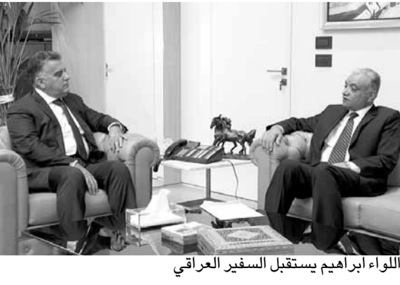
اللواء ابراهيم يستقبل السفير العراقي