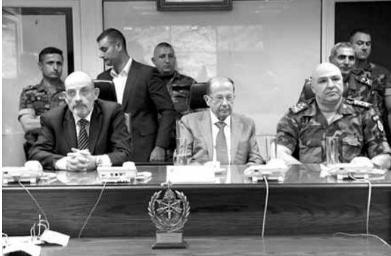
عون يزور مبنى القيادة في البرزة

عرض رئيس الجمهورية العماد ميشال عون، الأوضاع الأمنية في البلاد مع وزير الداخلية والبلديات نهاد المشنوق الذي أثار معه مسألة «النقص الحاصل في عديد قوى الأمن الداخلي والحاجة إلى تظويق نحو ألفي عنصر خلال عامين، من دون انتظار إقرار الموازنة نظرا للحاجة بفعل توسع مهام قوى الأمن وانتشارها على الأراضي اللبنانية».