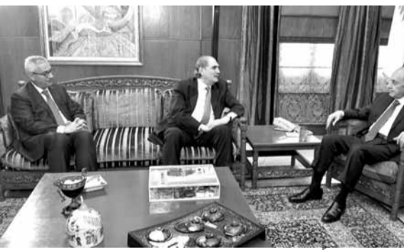
بري مستقبلاً جريصاتي وفهد

استقبل رئيس مجلس النواب نبيه بري في عين التينة وزير العدل سليم جريصاتي ورئيس مجلس القضاء الاعلى القاضي جان فهد، وتم البحث في شؤون القضاء والعدل.