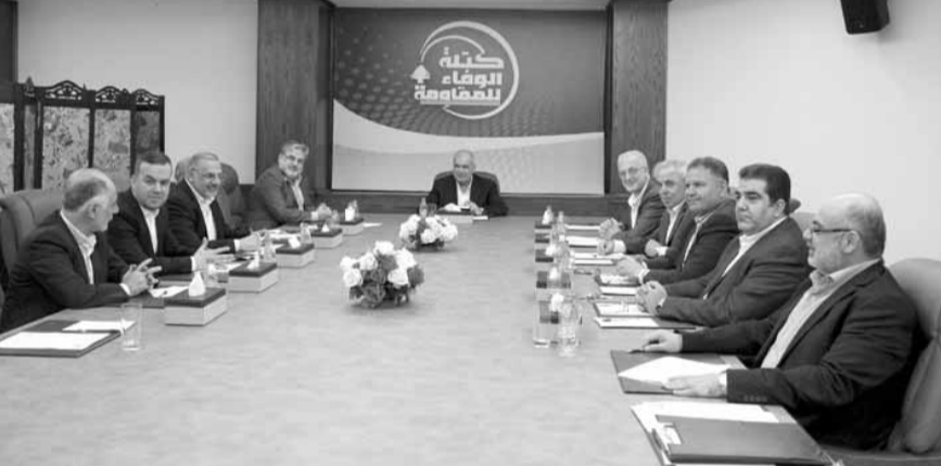
رعد يتراس الاجتماع

هنات كستلة «الوفاء للمقاومة» في اجتماعها الدوري بمقرها في حارة حريك، برئاسة النائب محمد رعد بمناسبة عيد المقاومة والتحرير اللبنانيين جميعا وكل الاحرار في المنطقة والعالم بأقول العصر الإسرائيلي الذي تهاوت معه كل اوهام العدو في التوسع والاحتلال فيما تجددت مع الانتصار التاريخي في ٢٥ ايار من العام ٢٠٠٠ نقشة شعبنا بقدرته على هزم الغزاة وطرده الاحتلال