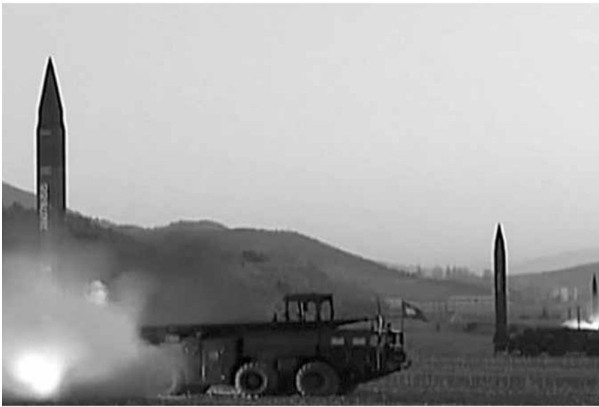
نووية، دافع هذه الخطوة، بحسب قناة Fox News، يعود إلى إجراء كوريا الشمالية تجارب على الصواريخ الباليستية، والمخاوف من أن يكون أحد أهداف بيونغ يانغ، على الأرجح، سياتل أكبر مدن الولاية.

ويوجد في مدينة سياتل ميناء كبير، وأيضا مقرات لعدد من الشركات الكبرى مثل Boeing و Microsoft و Amazon. كما توجد بالقرب من المدينة قاعدة بحرية كبرى تحتوي، بحسب القناة التلفزيونية، على ١٣٠٠ رأس نووي، وهو ما يعادل نحو ربع الترسانة النووية الأميركية.