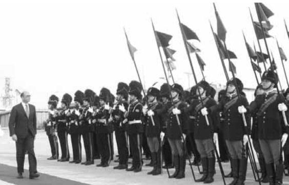
الوزير الإيطالي يستعرض جنوداً من كتيبة بلاده

تسلم رئيس الجمهورية العماد ميشال عون دعوة رسمية من الرئيس الإيطالي سيرجيو ماتاريللا الى زيارة إيطاليا، نقلها اليه وزير الخارجية والتعاون الدولي الإيطالي انجيلينو الفانو الذي زار قصر بعبدا على رأس وفد ضم السفير الإيطالي في لبنان ماسيمو ماروتي. ونوه ماتاريللا في رسالته بالعلاقات الدبلوماسية القائمة بين البلدين منذ ٧٠ عاما والتي ساهمت في تعزيز علاقات التعاون بينهما. وقال: «يواصل لبنان لعب دوره في قلب الفسيفساء الصعبة التي يتكون منها الشرق الأوسط، وتساهم إيطاليا من جهتها في المحافظة على التوازن الدقيق في المنطقة، وذلك من خلال لعب دور ريادي ضمن القوات الدولية العاملة في الجنوب اللبناني (اليونيفيل) منذ سنوات عدة. لهذه الغاية، وبهدف توطيد علاقاتنا الثنائية المتينة والاحتفال بالذكرى السبعين لإنشاء علاقاتنا الدبلوماسية».