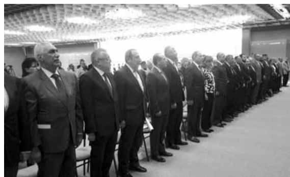
خلال افتتاح القاعة

التعريف على ثروات لبنان والبلاد العربية والأجنبية ومنتجاتها واطلاع التجار والصناعيين على التقدم الحاصل في مختلف فروع الإنتاج، وعرض صورة حقيقية عن واقع لبنان الاقتصادي في ميادين التجارة والصناعة والزراعة والخدمات، وإظهار مميزات لبنان، وإفساح المجال أمام المنتجين والمصدرين والمستوردين من اللبنانيين والعرب والأجانب للاتصال المباشر، ما ينعكس إيجاباً على الوضع الاقتصادي في لبنان».