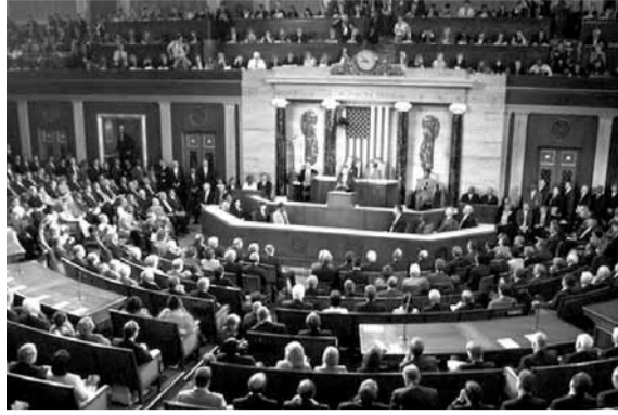
عرقة التحقيق في هذه القضية.

ومنذ إقالة كومي تطالب المعارضة الديمقراطية بتعيين «مدع عام يتمتع بوضعية خاصة» تنتج له أن يكون أكثر استقلالية تجاه السلطة، للإشراف على التحقيق الذي تجريه الشرطة الفدرالية في هذه القضية. وقال مولر في بيان نقلته «سي بي أس نيوز» على تويتر «أقبل هذه المسؤولية وسأنفذها بأقصى طاقتي».