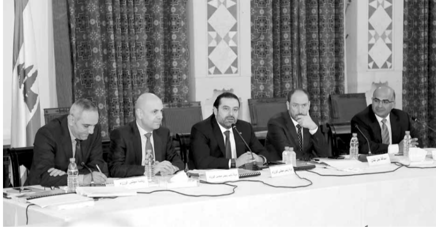
الحريري مترشداً الاجتماع

أساسيين، هما إنشاء غرفة عمليات لتفعيل التنسيق بين الوزارات منعا لحصول تضارب في توقيت تنفيذ المشاريع، وتحديد موقع لمحطة التكرير في برج حمود.