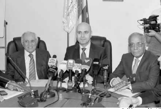
الاعلان عن الملتقى

وقدموا لهذه البلدان خدماتهم وابتكاراتهم واكتشافاتهم في شتى الميادين، واستحقوا الفناء والتكريم على جهودهم.