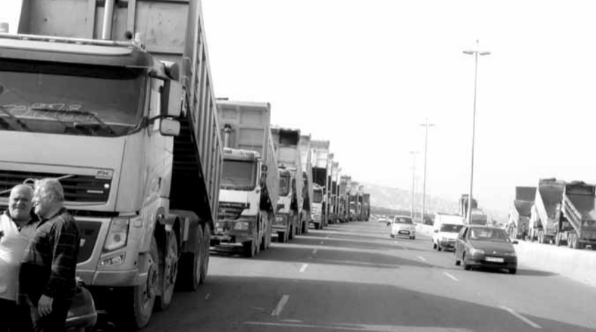
اعتصام اصحاب الشاحنات امس