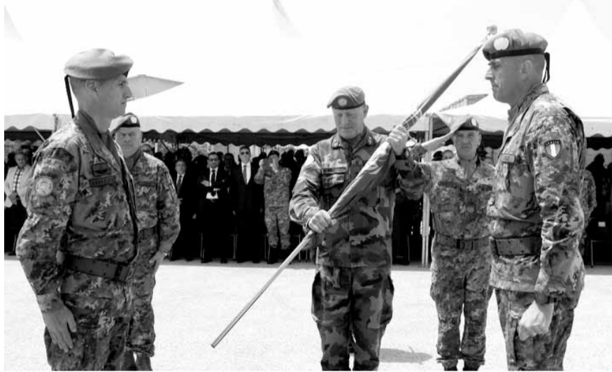
بييري يسلم الراية للقائد الجديد للقطاع الغربي