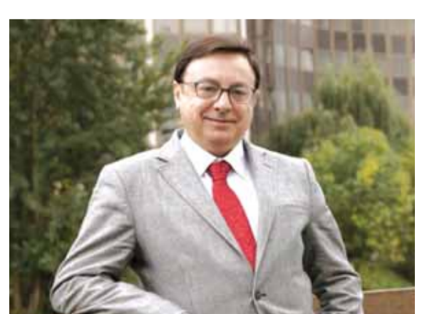
جان فرانسوا جليخ

نائباً بين ١٩٨٦ و ١٩٨٨ عن بلدة Seine-et-Marne بالشمال الفرنسي أيضاً، بحسب الوارد عنه في صحيفة «لو فيغارو» الفرنسية. في الصحيفة عن جليخ، كما بغيرها أيضاً، انه نائب منذ ٢٠١٤ بالبرلمان الأوروبي، يهوى السفر والفنون الجميلة والكتب القديمة والتاريخ والأدب وشخصية الكتب المصورة البلجيكية، المعروفة باسم «تان تان» الشهيرة، ومنصبه الجديد كرئيس للحزب هو مؤقت، لأن لو بان ستعود إلى رئاسته ثانية إذا خسرت الجولة الثانية من الانتخابات (تتمة الخبر الفرنسي ص ١٦)