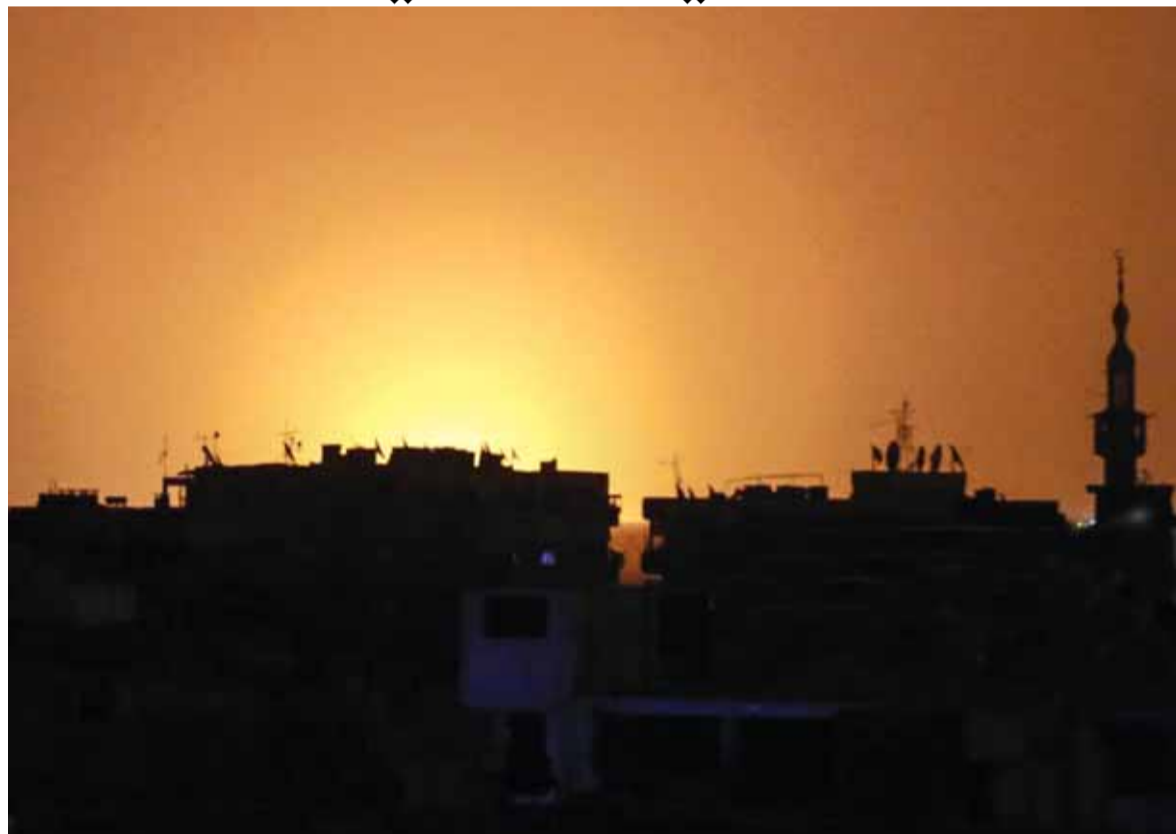
لهب القصف الاسرائيلي على موقع عسكري قرب مطار دمشق، ليلا

وحول المشروع التاهيلي قال «التاهيلي طويت صفحته وانا لم اعارضه مجرد المعارضة بل لانني ارى انه لا يلائم مصلحة البلد»... ورداً على سؤال، عما اذا كان الرئيس الحريري قد ابلغه انه لن يحضر جلسة التمديد للمجلس قال: «لقد هنأته على هذا الموقف، واذا كان هناك من يعتقد انني مع التمديد فهذا شأنهم، موافقي معروفة، واذا كانوا محقن، خلبهم يرحجونني ويوصلوا لقانون»، المعلوم ان الرئيس بري كان اعلن في اليومين الماضيين، وقبيل زيارة