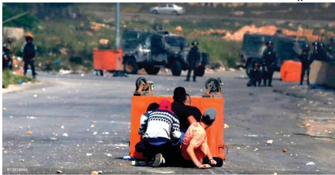
مواجهات بين الفلسطينيين وجنود الاحتلال

عمّ الإضراب الشامل امس قطاع غزة والضفة الغربية - بما فيها القدس المحتلة - تضامناً مع الأسرى المضربين عن الطعام في سجون الاحتلال الإسرائيلي لليوم الثاني عشر على التوالي. فقد أغلقت المؤسسات العامة والمحال التجارية أبوابها كما تعطلت الدراسة في الجامعات والمدارس وتوقفت المواصلات العامة، واستثنى من الإضراب الخدمات الصحية، كما نظمت العديد من المسيرات التضامنية في أنحاء الأراضي الفلسطينية، وتوافد (تتمة الخبر الفلسطيني ص ١٦)