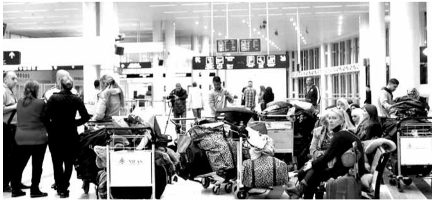
السوق الحرة في مطار بيروت

تحالف «آفرو آسيا» و«آررينتا» الذي سمي لاحقاً «باك»، ثم وقعت «ايدال» مع الشركة الفائزة لمدة ١٥ سنة، ونال الامر موافقة مجلس الوزراء في نيسان ١٩٩٤.