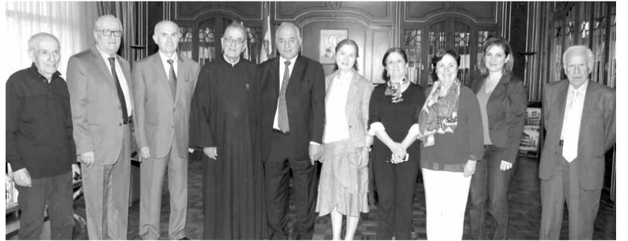
المشاركون في المؤتمر

والتاريخ. تراث بلاد آرام: لبنان وسوريا وفلسطين والأردن والعراق، هي بلاد تشكل مهد الحضارة في الشرق واساس الحضارة في الغرب. العودة الى التراث المشرقي المشترك هو التعرف الى روحانية كل جماعة انسانية كوننا في لبنان والشرق جماعات روحية لا طوائف متناحرة، نؤمن بأن فراءة لبنان تكمن في تعدده، في عيش بنيه معا بالاحترام وحق الاختلاف».