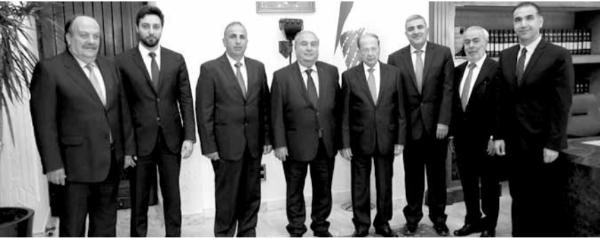
عون مع وفد الصناعيين (بالأعلى ونهرا)

العاملة السورية للعمال اللبنانيين وللمصانع اللبنانية، إضافة إلى حاجات المصانع لرعاية أكثر من قبل الدولة. وأعطى عون توجيهاته إلى الجهات المعنية لدراس مطالب تجمع صناعيين جبيل، كما طلب التشدد في تطبيق القوانين وحماية حقوق أصحاب المصانع والعمال اللبنانيين على حد سواء. وتابع عون مع الإدارات المعنية موضوع التعويض على مزارعي التفاح وضرورة تأمين الاعتمادات اللازمة لهم إستناداً إلى قرار مجلس الوزراء. وأعلم الرئيس عون أنه تم صرف مبلغ ٢٠ مليار ليرة لبنانية كدفعة أولى من أصل المبلغ المخصص والبالغ ٤٠ مليار ليرة، ليصار إلى صرفها على المزارعين المتضررين من خلال الهيئة العليا للإغاثة.