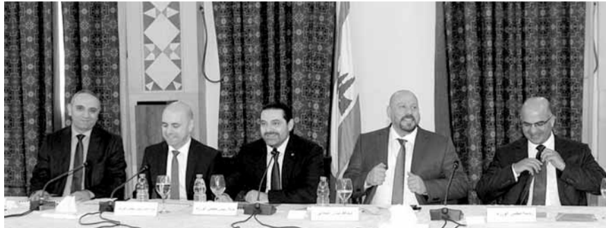
الحريري مترشداً الاجتماع في السراي

الصلية، المحميات الطبيعية، الحدائق العامة، تحويل التمديدات الكهربائية الهوائية الى ارضية، الإنارة العامة، المدارس الرسمية، المراكز الصحية والمستوصفات، مركز تأهيل المدمنين، النقل المشترك، مياه الري والشفة، الملاعب والقاعات الرياضية، مرافق الصيادين، الحفاظ على المناطق الأثرية وتأهيلها. وتم اقتراح تكثيف حلقات النقاش حول القطاعات الخدمية للمحافظة بالتعاون مع الوزارات المختصة والإدارات الرسمية وكل من له صلة من أجل التوصل إلى مخطط توجيهي عام يشمل جميع المعطيات والمعوقات وإيجاد مصادر التمويل من أجل تنفيذ هذه المشاريع ضمن جدول زمني منظم وحسب الأولويات واقتراح خطة عمل وآلية للمراقبة وحسن التنفيذ.