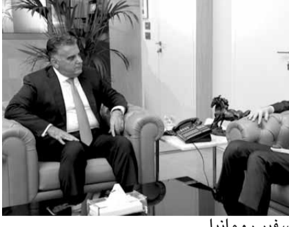
ابراهيم مستقبلاً سفير رومانيا