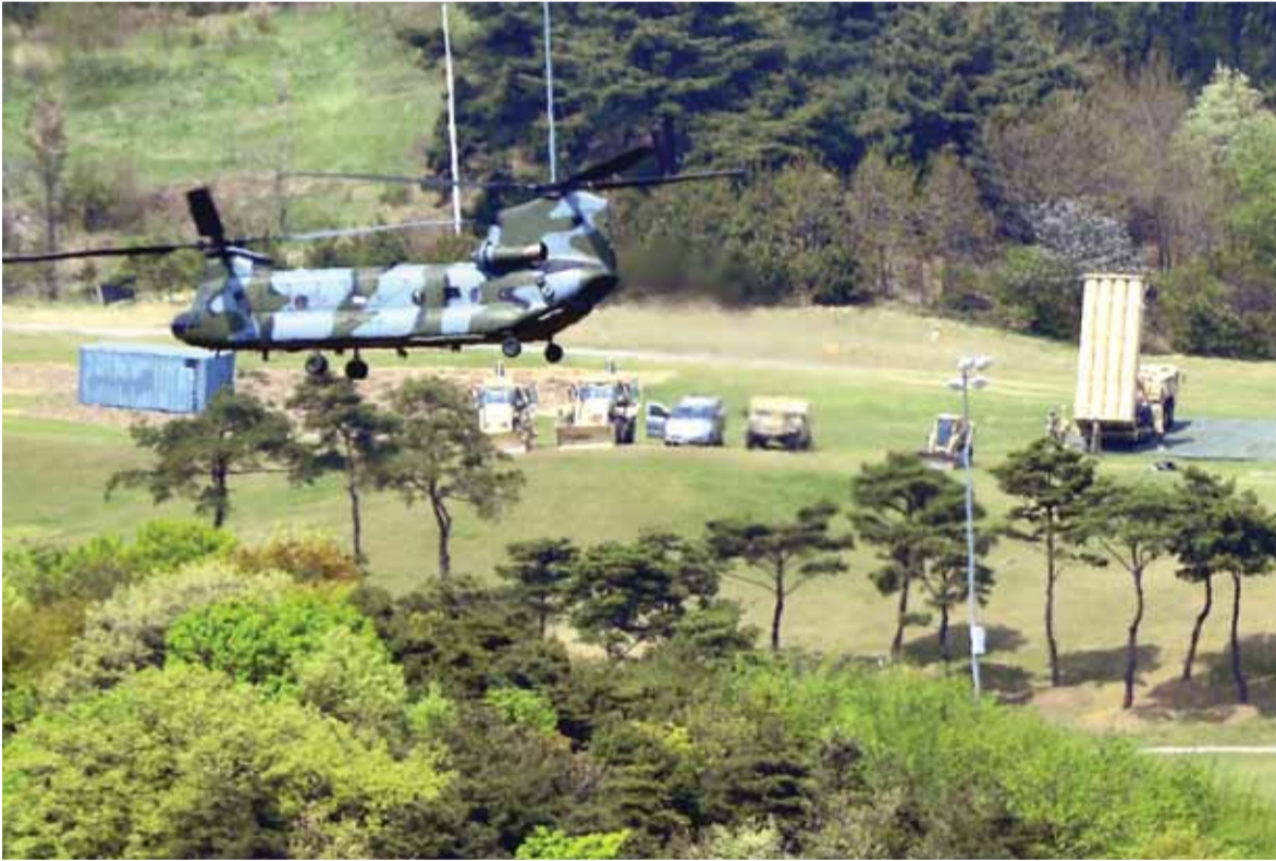
الصواريخ الأميركية في كوريا الجنوبية

شدد وزير الخارجية الصيني وانغ يي على ضرورة تجنب اندلاع حرب في شبه الجزيرة الكورية مهما كانت الظروف.