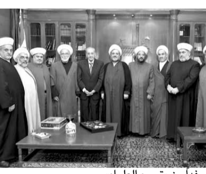
بري مستقبلاً وفدا من «تجمع العلماء»

دعا رئيس مجلس النواب نبيه بري الى جلسة مشتركة للجان: المال والموازنة، الادارة والعدل، الدفاع الوطني والداخلية والبلديات، التربية والتعليم العالي والثقافة، الصحة العامة والعمل والشؤون الاجتماعية، الاقتصاد الوطني والتجارة والصناعة والتخطيط، الاعلام والاتصالات، الزراعة والسياحة، الشؤون الخارجية والمغتربين، البيئة، الاشغال العامة والنقل والطاقة والمياه، في تمام الساعة العاشرة والنصف من قبل ظهر يوم الخميس في ٤ ايار المقبل وذلك لدرس مشاريع واقتراحات القوانين الآتية: