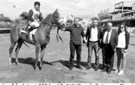
مشهور بعد فوزه المفاجيء يعود مع سانشيه وهو بحالة زهو وانتصار....