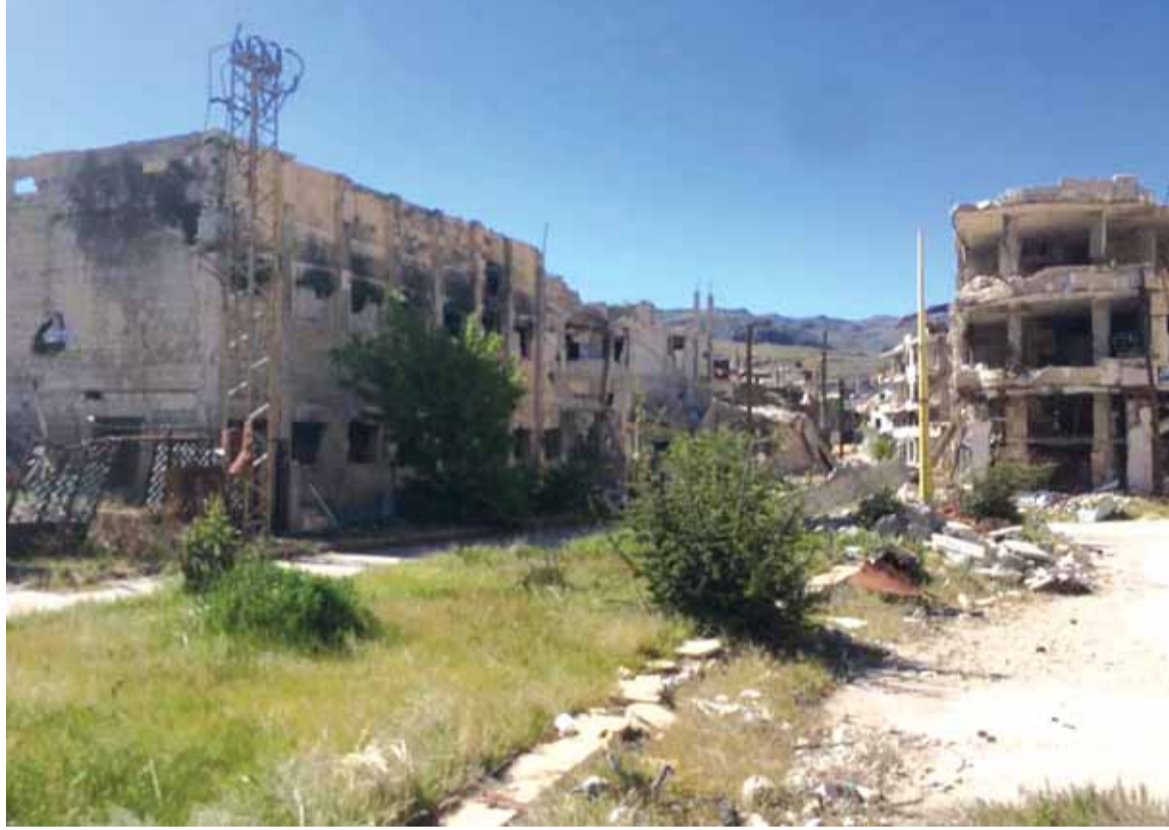
الزبداني خالية من المسلحين

«اتفاق البلدات الاربع» انجز بنده الاول على ان تستكمل باقي بنود الاتفاق خلال الاسابيع المقبلة عبر مغادرة مسلحي جبال القلمون الى ريف ادلب وتصحيح عندها معظم الحدود اللبنانية - السورية خالية من المسلحين، ويتنظر تنفيذ انسحاب مسلحي جبال القلمون بعض الاجراءات في ظل رفض مسلحي النصرة للاتفاق والقيام بعملية عسكرية تم احباطها من قبل الجيش السوري ومجاهدي حزب الله، لكن انسحاب المسلحين من الزبداني ومضايا وسرغايا ويقين والجبل الشرقي المشرف على بلودان جعل مسلحي القلمون مغرولين كلياً ولا خيار امامهم الا الانسحاب.