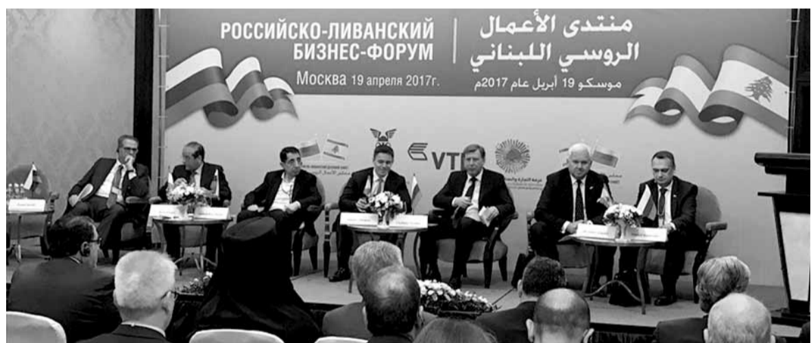
الوفد اللبناني في روسيا

«واوضح أن هذا الخلل سيبقى. وسيدبقى كبيراً. لا نشك في ذلك، ولكننا نطمح، وعليكم مساعدتنا انطلاقاً من نبل الصداقة وعدالة الشركة، إلى رقم قديم صادر انا إلى روسيا لتصل إلى ٢٠٠ مليون دولار في السنوات القليلة المقبلة.» ودعا الحكومة الروسية إلى «معاملة لبنان بطريقة إستثنائية وخاصة، لا سيما ان الصناعة اللبنانية تدخل إلى الأسواق الروسية، الامر الذي يعني طابقتها للمعايير الروسية.» ودعا الوفد إلى «مراجعة محضر الاجتماع الثالث للجنة الحكومية اللبنانية الروسية للتجارة والتعاون الاقتصادي التي انعقدت قبل سنتين في بيروت. ففي دراسة مقارنة، فاقت رغبات الشركات الروسية في الاستثمار في لبنان بمعدلات كبيرة جداً تطغى على الجانب اللبناني المتواضع جداً.» وقال «بمشاركة الصيدق والشريك والحليف، لم تلق طلبات الجانب اللبناني التجاوب المطلوب. فعلى صعيد التبادل الصناعي وتسهيل انسياب بعض السلع اللبنانية إلى روسيا عبر خفض التعريفات الجمركية، جرى صد الطلب اللبناني تحت حجة أن روسيا هي عضو في الاتحاد