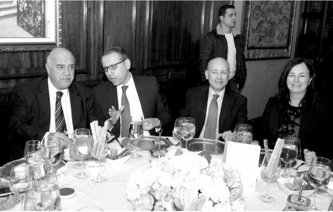
سفراء اوغندا، ايطاليا، مصر، وفارس بويز