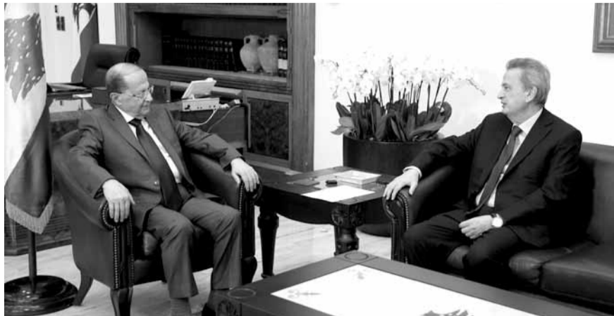
(اللاتي ونهرا) الرئيس عون مع سلامة

شهد قصر بعبدا قبل ظهر امس سلسلة لقاءات، تناولت مواضيع سياسية ومالية واقتصادية، إضافة إلى متابعة رئيس الجمهورية العماد ميشال عون التطورات السياسية والاتصالات القائمة للاتفاق على قانون انتخابي جديد.