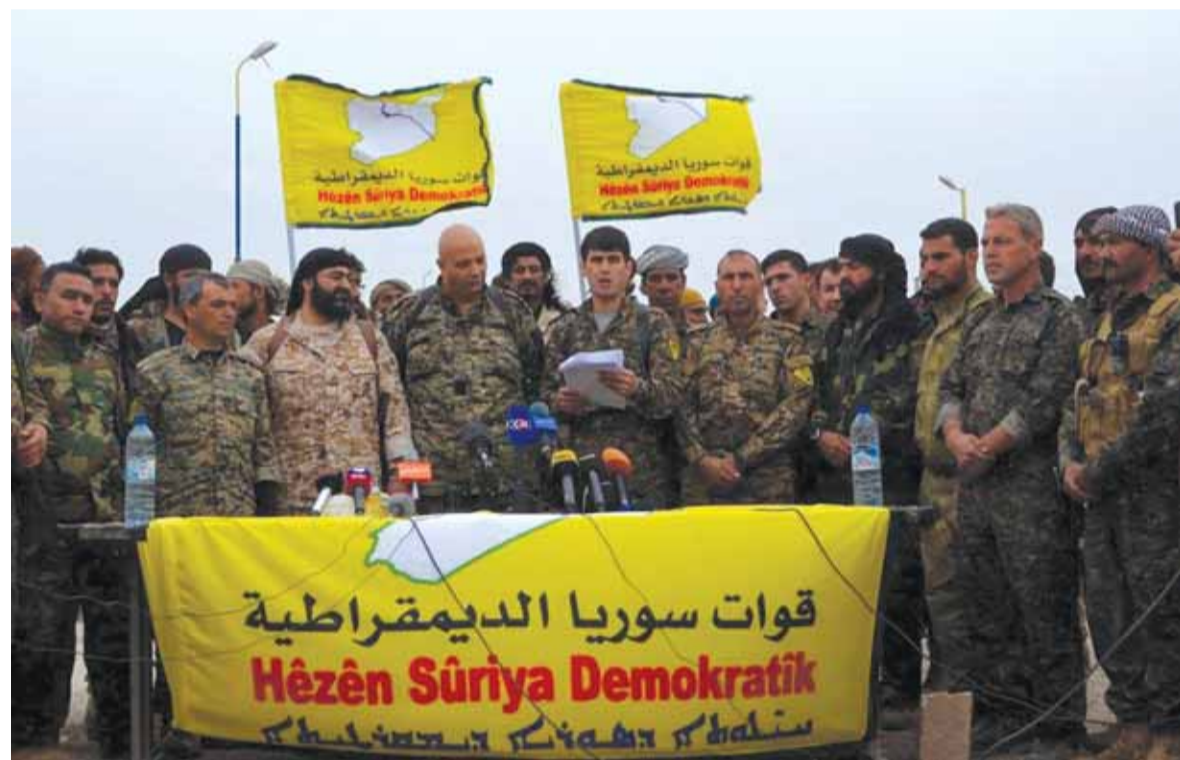
«قوات سوريا الديمقراطية» تعلن اقتراب معركة الرقة