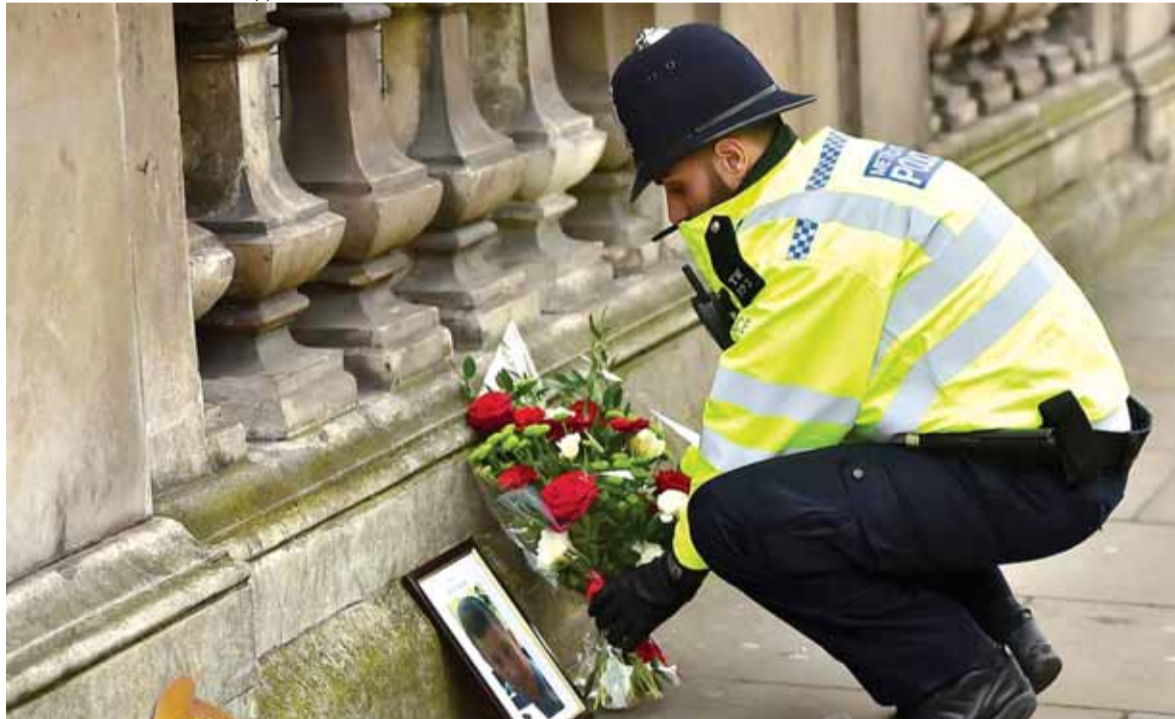
يضع اكليلاً مكان سقوط احد ضحايا الهجوم الارهابي في لندن

تعيش القارة الأوروبية هاجس العمليات الإرهابية المنتقلة وسط إجراءات أمنية استثنائية بعد اعتراف تنظيم الدولة الإسلامية بمسؤوليته عن عملية لندن، فيما اعتبر الجنرال كرنيس سكاربوتني قائد القوات الاميركية وقوات حلف الناتو في أوروبا، ان القارة الأوروبية أصبحت احد اكثر اماكن العالم خطورة بسبب التهديد الارهابي. وفي شأن العملية الإرهابية في لندن، أعلنت الشرطة البريطانية ان منفذ هجوم لندن الذي أسفر عن مقتل ٣ أشخاص بالإضافة إلى المهاجم وإصابة عشرين آخرين، هو مواطن بريطاني يدعى خالد مسعود، وكان يبلغ من العمر ٥٢ عاماً. وأوضح بيان صدر عن الشرطة البريطانية بهذا الصدد أن مسعود ولد في مقاطعة كينت جنوب شرق لندن، مشيراً إلى أنه «لم تشمله أي تحقيقات جارية (قبل الهجوم)، كما لم تكن هناك أي معلومات تدل على وجود نية لديه لتنفيذ هجوم إرهابي» لكن مسعود «كان معروفًا للشرطة، حيث كان لديه سجل واسع من الحكومات السابقة على خلفية تنفيذه اعتداءات، بما في ذلك التسبب بعاهات مستديمة لأشخاص، وامتلاك أسلحة هجومية، وانتهاك النظام العام». الحكم الأول بإدانته تم إصداره عام ١٩٨٣ على خلفية (تتمة الخبر الأوروبي ص ١٠)