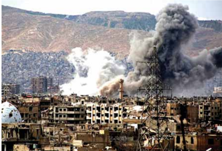
دخان القصف يتصاعد من حي جوبر