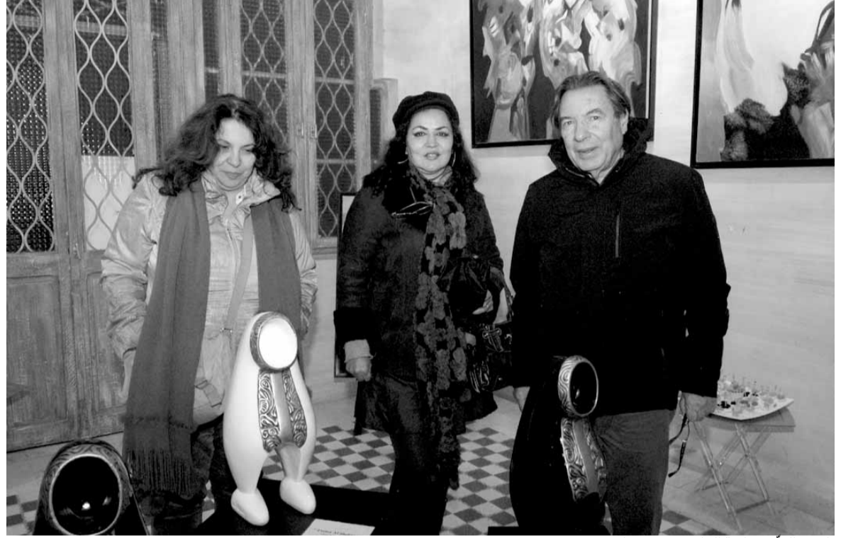
فلقون البني، واحة الراهب، ريم حنا