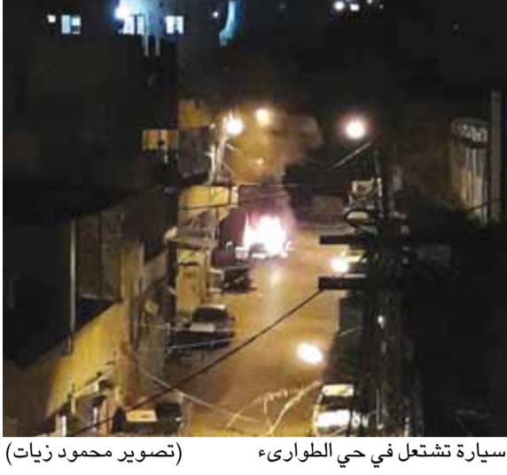
سيارة تشتعل في حي الطواريء

قتيل وثلاثة جرحى، حالة ادهم خطرة، حصيلة الاشكال الذي شهده مخيم عين الحلوة مساء امس، بين عناصر من حركة «فتح» وتنظيم «جند الشام» في حي الطواريء. فقد توتر الوضع الامني من جديد، في مخيم عين الحلوة، على اثر تبادل لاطلاق النار سجل بعيد الثامنة مساء، بين عناصر من حركة «فتح» تتركز في حي البركسات ومسلحين