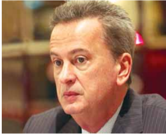
حاكم مصرف لبنان الدكتور رياض سلامة

يمكن ان تكون المصارف اللبنانية مصدر تسليف وإعطاء قروض مالية وتسهيلات لتنشيط الاقتصاد اللبناني وتحقيق الانقراج والازدهار على مستوى الاقتصاد، ذلك ان الودائع موجودة بفعل الهندسة المالية لحاكم مصرف لبنان طوال أكثر من ٢٠ سنة، مما جعل لبنان نموذجاً في السياسة النقدية والمالية، وجعل الناتج القومي يرتفع من ١٦ مليار دولار الى ٥٤ مليار دولار خلال ٢٠ سنة. لكن نعود ونركز على دور الدولة في ضرب الفساد ووقف الهدر وإصلاح قطاع الكهرباء وقطاع المياه وقطاع الضرائب ووقف المناقصات التي فيها سمسارات، وإعطاء ضمانات بالاستثمار في لبنان، لان الأستاذ رياض سلامة حاكم مصرف لبنان قام بتأمين القاعدة الكاملة بوجود وودائع تصل الى ٢٠٠ مليار دولار كي يتم تسليفها الى المواطنين وتعزيز الاقتصاد والانقراج والازدهار. واكبر دليل على ذلك ان المودع اللبناني له ثقة بوضع وودائعه بالليرة اللبنانية في المصارف اللبنانية، كذلك المستثمرون العرب لهم ثقة في ايداع أموالهم في المصارف اللبنانية، نتيجة الهندسة المالية لحاكم مصرف لبنان، مما رفع الودائع في لبنان خلال ٦ سنوات من ٦٥ مليار دولار الى ٢٠٠ مليار دولار. وجعل لبنان في المرتبة الثالثة عربياً على مستوى الودائع واحتياط المصرف المركزي اللبناني.