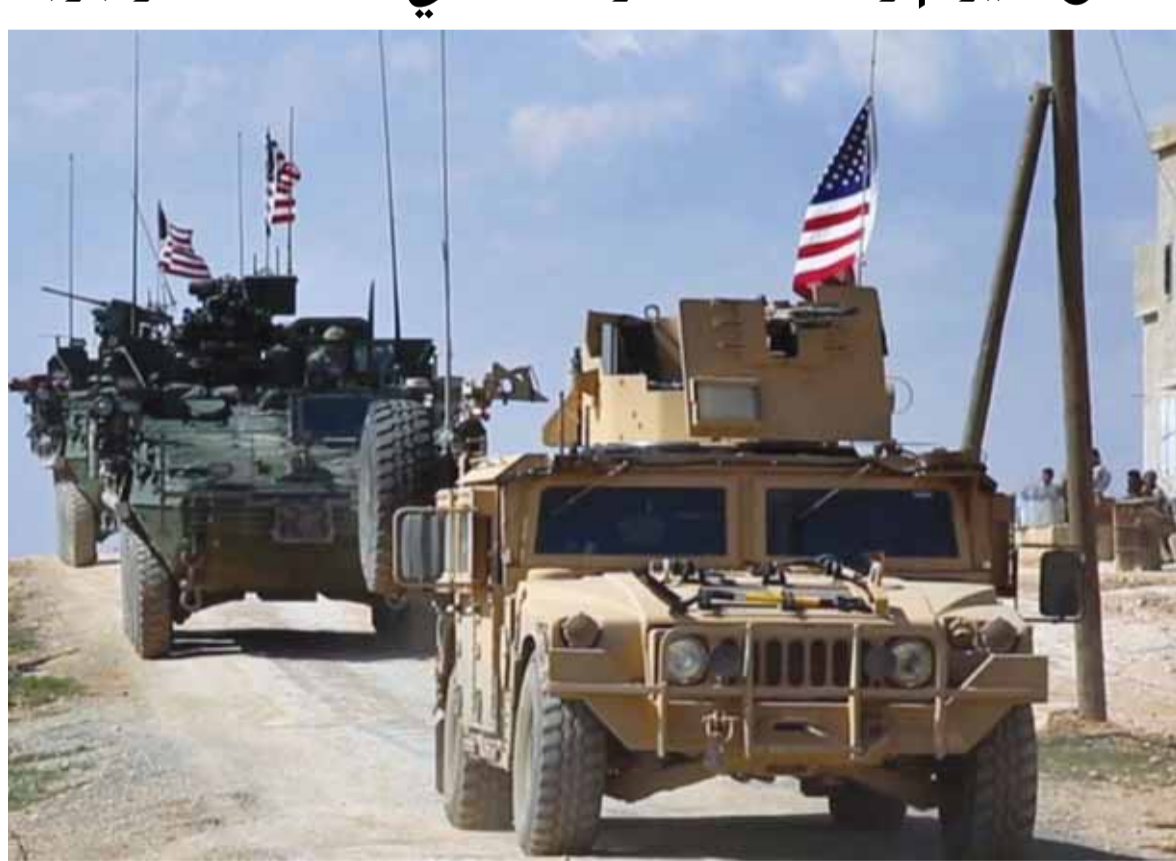
قوات أميركية في محيط الرقة

واصلت القوات الأميركية انزال المزيد من جنودها في سوريا للمشاركة في تحرير منطقة الرقة، وتقوم القوات الأميركية بإرسال كميات كبيرة من الاسلحة الثقيلة الى المنطقة. ووضحت قوات سوريا الديمقراطية، انهم حققوا تقدماً كبيراً باتجاه الرقة، اذ باتوا يبعدون عن المدينة من جهة الشمال ٤ كلم وشرقاً ١٨ كلم وجنوباً ١٠ كلم، وذكر ليلاً ان القوات الأميركية وصلت الى سد الفرات.