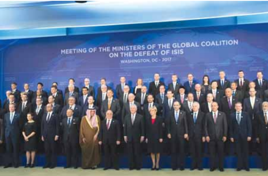
صورة تذكارية للمشاركين في اجتماع التحالف الدولي

التحالف الدولي قد أعلن مؤخرًا أن التحالف لا يعرف تحديداً مكان البغدادي، لكنه أوضح أنه سيقبضه في النهاية.