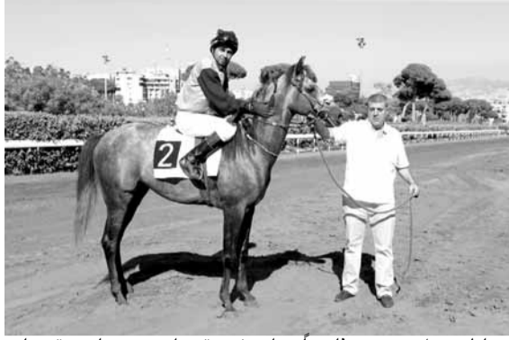
ساطع: حل مرتين ثانياً وراء رفيقه ابن سينا... بقيادة مترجرجة... وعجيبة... أما اليوم سيسطع نجمه ويفوز - مش معقول يشدو ٣ مرات..

أقدر: محبوب ملهم - فرح الزمان - برندا أخبار الخيل: محبوب ملهم - فرح الزمان - برندا اللوتري: محبوب ملهم - براندا - فرح الزمان