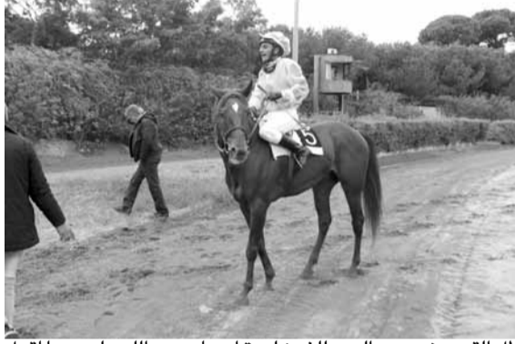
طل القمر: نرجحه اليوم للفوز لعدة اسباب... والله عليم عما أقول وعلى خيرة الله. طل القمر أقوى من كل هذه المجموعة... اذا ركض الشوط على الاصول بدون مشاكسات سيطل علينا كقمر نيسان فائزاً وبعيداً.