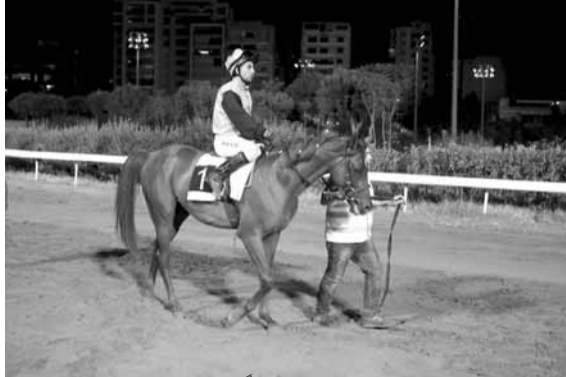
اغادير: في آخر سباق له حل ثانياً حيث كان مطلوب منه هذا المركز.. وحالته اليوم رائعة تؤهله لأن يكون الفائز

أقدر: ساطع - صقر - سبع بحور أخبار الخيل: صقر - ساطع - سبع بحور اللوتري: ساطع - صقر - نصر الامان