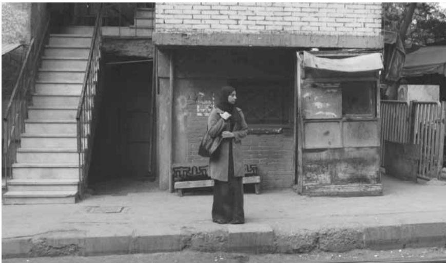
مشهد من «أخضر ياس»