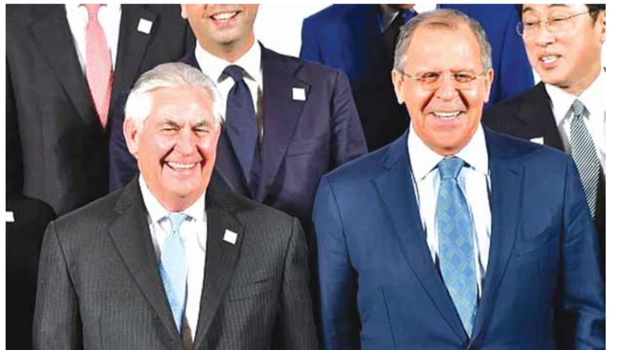
وزيرا خارجية واشنطن وموسكو