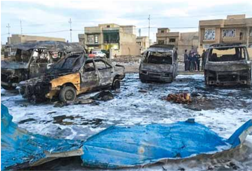
آثار الانفجار في بغداد