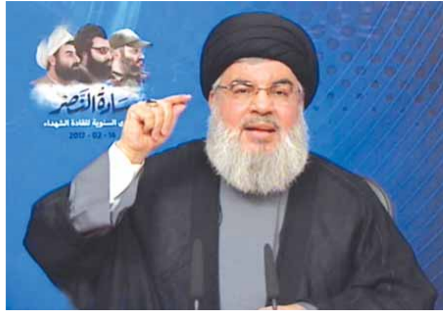
السيد نصرالله متحدثاً في ذكرى القادة

كشف صراحة عن قدرة المقاومة على اصابة اهدافها الاستراتيجية في اسرائيل، لكنه لم يحدد الطريقة. وتناول معادلة «الصواريخ» دون غيرها... اسرائيل تُقدر ان حزب الله بات يمتلك صواريخ «فاتح» الإيرانية، وهي صواريخ يتراوح مداها بين ٢٥٠ كلم و ٣٥٠ كلم، ويمكن تزويدها بجملة من المواد الشديدة الانفجار، وتبلغ سرعتها ١٠ كلم في الثانية الواحدة، وهي صواريخ تعمل على الوقود الصلب ما يمنحها ميزة سرعة في الاطلاق... وهامش الخطأ لا يتعدى عشرة امتار... كما تعرف اسرائيل ان «مخازن» الجيش