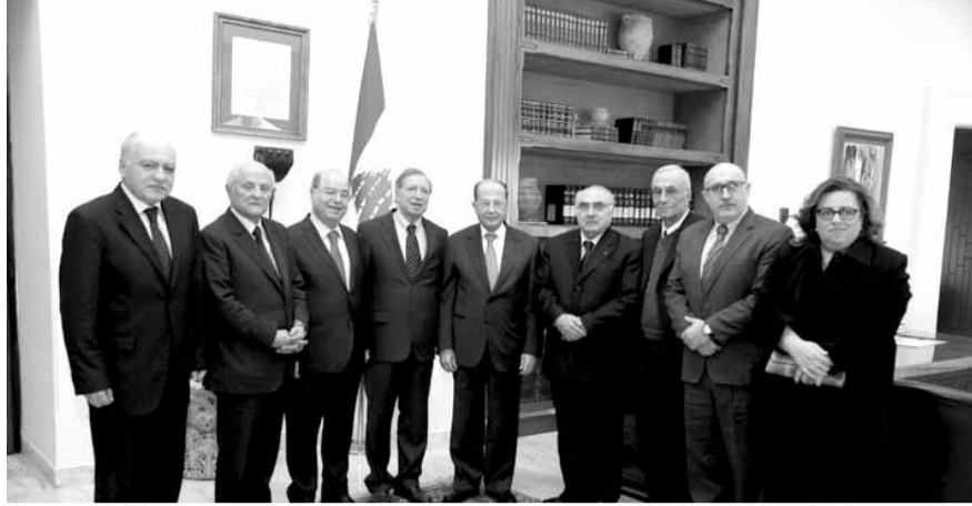
عون مع وفد المجلس الوطني للاعلام