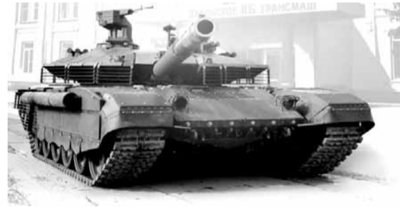
تقليديا من قبل وفود القوات البرية لبلدان المنطقة.

كما ذكر المكتب الصحفي أنه ستظهر في المعرض أيضا الأسلحة الخفيفة لشركة «كلاشيكوف» الروسية.