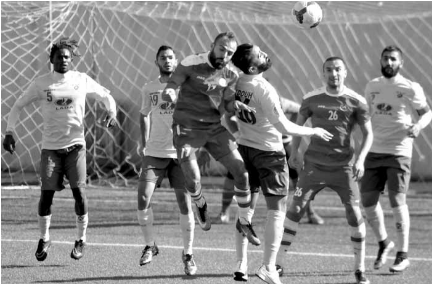
من مباراة الصفاء والاخاء الاهلي عاليه