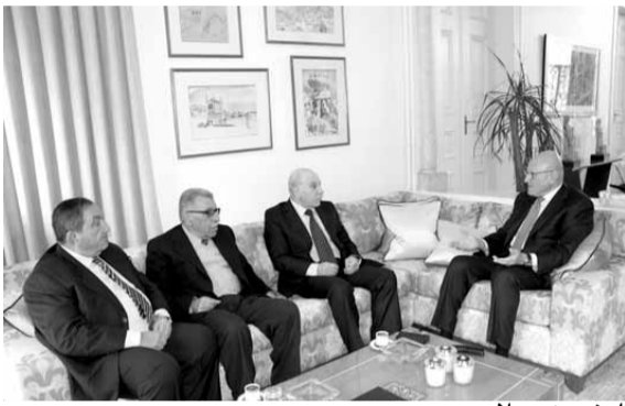
الوفد عند سلام

استقبل الرئيس تمام سلام امس في دارته في المصيطبة وفدا قياديا من الجبهة الديموقراطية لتحرير فلسطين ضم أعضاء المكتب السياسي للجبهة: علي فيصل، ابراهيم النمر ومحمد خليل، وعرض معه أبرز التطورات على المستوى الفلسطيني والعلاقات الفلسطينية اللبنانية.