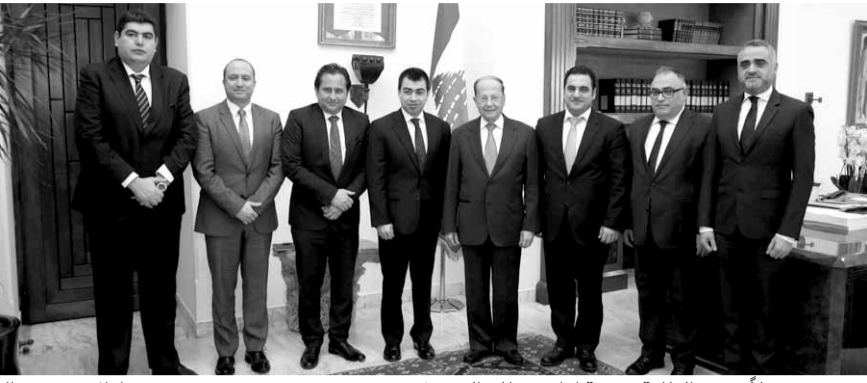
عون مستقبلا وزير الطاقة وهيئة إدارة قطاع البترول (دالاتي ونهرا)

العروض وترفع تقريرها الى الوزير، ومن ثم سارفعه بدوري الى مجلس الوزراء كي يأخذ القرار بالشركات الفائزة والتوقيع معها قبل نهاية العام الحالي». وسئل عن القانون الضريبي، فأشار الى «ان هناك لجنة وزارية يرأسها رئيس الحكومة أنهت عملها وهي في طور صياغة التقرير، ومن المؤكد انها سترفعه الى مجلس الوزراء كي يصادر مرسوم وتحويله الى مجلس النواب ليقره. ومن شأن هذه الخطوة ان تساعد بشكل ملحوظ دورة التراخيص التي تضمّن الشركات التي سيكون امامها منظومة تشريعية واضحة تقدم على اساسها، وهذا من شأنه ايضا ان يحسن الشروط لمصلحة الدولة اللبنانية». وسئل عما اذا كانت هناك صعوبات تعترض الشركات التي تقدم للمناقصات، فأشار الى «عدم وجودها، بل على العكس ان هيئة ادارة قطاع البترول أنجزت عملا حصل على تقدير مختلف الجهات العالمية والخبراء في هذا المجال، وكل الشركات حصلت على التسهيلات اللازمة، وهيئة ادارة القطاع تقوم بكل ما يلزم في هذا الإطار، وإن شاء الله سيكون لدينا عدد كبير من الشركات التي ستقدم على دورة التراخيص في لبنان». وأشار ردا على سؤال الى ان البحث في لقائه مع الرئيس عون تناول موضوع النفط فقط، «أما بالنسبة الى خطة الكهرباء، ف نحن لدينا ورقة ادارة قطاع الكهرباء، وهي صالحة، وقد طر بعض التأخير على بعض مساراتها ونعمل على تسريع تنفيذ هذه المسارات، وعندما نتهي عملنا سنعلن عنها، ولا نريد ان نقاشها قبل ذلك».