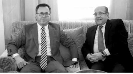
تسناس مع السفير اليرمني

استقبل رئيس المجلس الاقتصادي والاجتماعي روجيه تسناس سفير أرمينيا في لبنان صموئيل مكرتشيان حيث تم البحث في سبل ترسيخ التعاون بين المجلس الاقتصادي والاجتماعي الأرميني واللبناني، «نظرا لما يتمتع به المجلس اللبناني من خبرة في هذا المجال». وأنه السفير الأرميني بالدراسة التي وضعها تسناس وفريق من الخبراء والاختصاصيين بعنوان «نهوض لبنان نحو دولة الانماء» كمدقمة لحوار اقتصادي واجتماعي، ودعا تسناس الى زيارة المجلس الأرميني والمسؤولين.