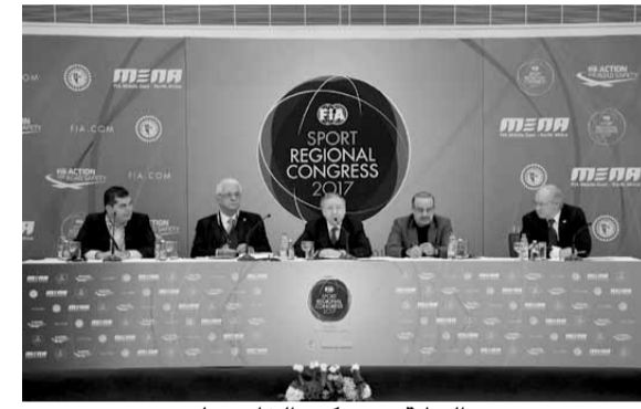
صورة تجمع تود والعتيبة وستوكر والخانن والحدود

افتتح قبل ظهر أمس الخميس المؤتمر السنوي الرابع لأندية السيارات في الشرق الأوسط وشمال أفريقيا الذي يستضيفه النادي اللبناني للسيارات والسياحة ((ATCL في مقره بالكسليك على مدى يومين. وحضر حفل الافتتاح رئيس الاتحاد الدولي للسيارات الـرئيس الفرنسي جان تود ونائبه