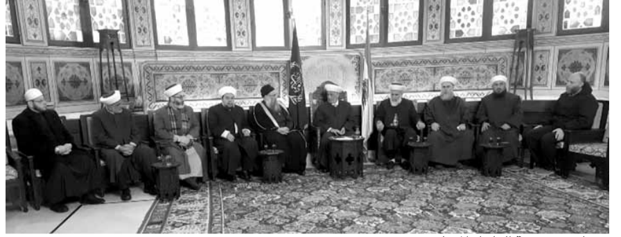
دريان مع هيئة العلماء المسلمين

استقبل مفتي الجمهورية الشيخ عبد اللطيف دريان، في دار الفتوى، هيئة العلماء المسلمين في لبنان برئاسة الرئيس الجديد الشيخ رائد حليلح الذي قال بعد اللقاء: «تحدثنا عن ضرورة ترتيب البيت السني ولا سيما في هذه الظروف التي نمر بنا وتحدثنا باستفاضة عن موضوع العفو الذي يتحدث عنه في الآونة الأخيرة وبالتالي عن ضرورة أن يكون للموقوفين في ساحتنا السنية الحظ الأكبر والأوفر لأنهم أولى الناس به، فقد وقعت عليهم مظالم كثيرة، فنتمنى أن تحل مشاكلهم عن قريب بإذن الله ويعودوا الى اهلبيهم وذويهم بخير وسلامة إن شاء».