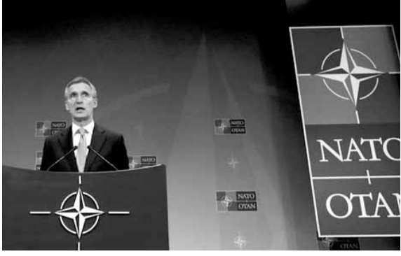
أن ترى أميركا تقلص التزامها إزاء هذا الحلف فستتبعين على عواصمكم إظهار الدعم لدفاعنا المشترك..»

عفا عليه الزمن ويأتي هذا التهديد تكرارا لتصريحات الرئيس الأميركي دونالد ترمب بوقت سابق، حين قال إن الناتو «عفا عليه الزمن» وهدد بوقف دعمه ما لم تعمل الدول الأعضاء بالحلف