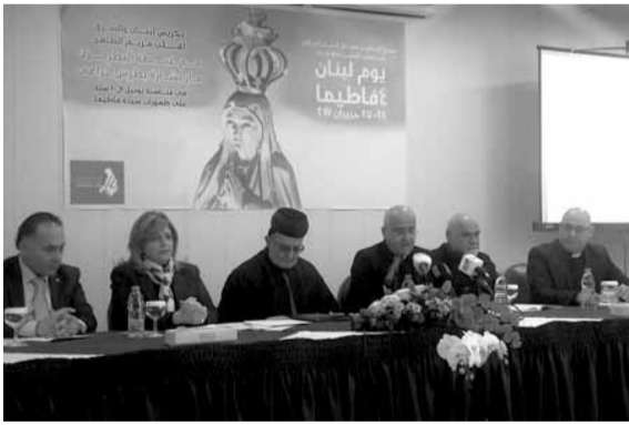
خلال المؤتمر الصحافي

عقد مؤتمر صحافي في مركز بيت عنيا حريصا بعنوان «يوم لبنان في فاطيما ٢٤-٢٥ حزيران ٢٠١٧» بمناسبة «اليوبيل المئة على ظهورات السيدة العذراء في فاطيما وتكريس لبنان والشرق لقب مريم الطاهر»، بدعوة من اللجنة البحريرية كنكرسيه لبنان والشرق لقب مريم الطاهر، تناول برنامج رحلات الحج التي ستقام في المناسبة تحضيرا ليوم لبنان في فاطيما.