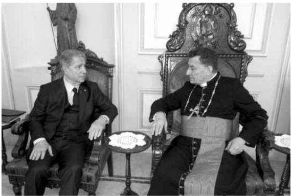
الراعي مستقبلاً الجميل

استقبل البطريك الماروني الكاردينال مار بشارة بطرس الراعي، قبل ظهر امس، في الصرح البطريكي في بركي، وزير البيئية طارق الخطيب الذي لفت إلى «حرص صاحب الغبطة التمام على معرفة المشاكل التي تعاني منها البيئية في لبنان والحث على معالجتها»، واكد ان هناك خطة استراتيجية شاملة بحل مشكلة النفايات يكون عمادها اللامركزية الادارية.