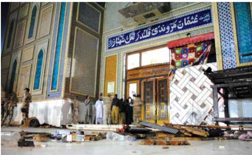
آثار الانفجار امام المسجد

وفجر انتحاري نفسه بين الموجودين في المسجد خلال اداءهم لطقوس دينية. ووقع التفجير في القسم المخصص للنساء. وتقول الشرطة ان عدد القتلى والمصابين قد يزداد. وقالت وكالة اعماق للانباء التابعة لتنظيم الدولة الإسلامية ان التنظيم أعلن مسؤوليته عن هجوم انتحاري في جنوب باكستان.