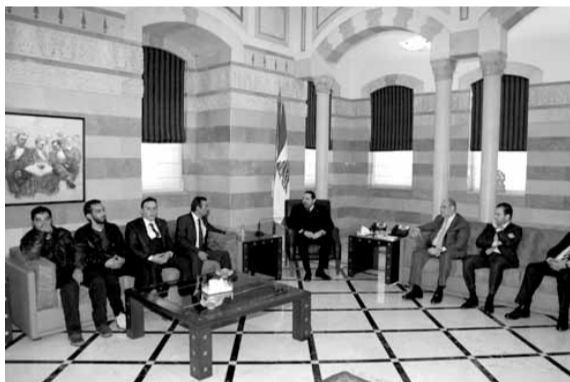
الحريري مع أهالي العسكريين

التشريعية، وأنه لم يقم بأي عمل جدي لإقرار قانون انتخابي جديد.