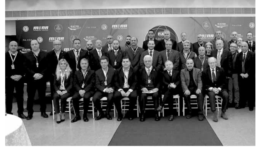
صورة عامة لكبار الحضور وممثلي اندية السيارات