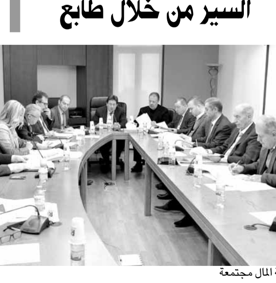
لجنة المال مجتمعة