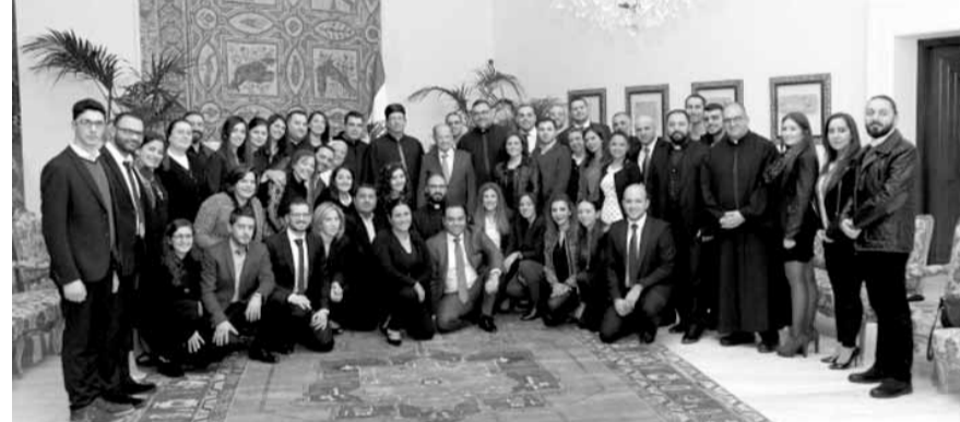
عون مستقبلاً وفد الشبيبة في الدوائر البطريركية المارونية

استحداث وزارة دولة لشؤون مكافحة الفساد. واستقبل عون رئيس جامعة القديس يوسف الأب البرفسور سليم دكاش اليسوعي الذي أكد أن جامعة القديس يوسف «تضع إمكانياتها التقنيّة المتطورة وكذلك خبرتها في النظام الانتخابي بين أيديكم وفي خدمة لبنان».