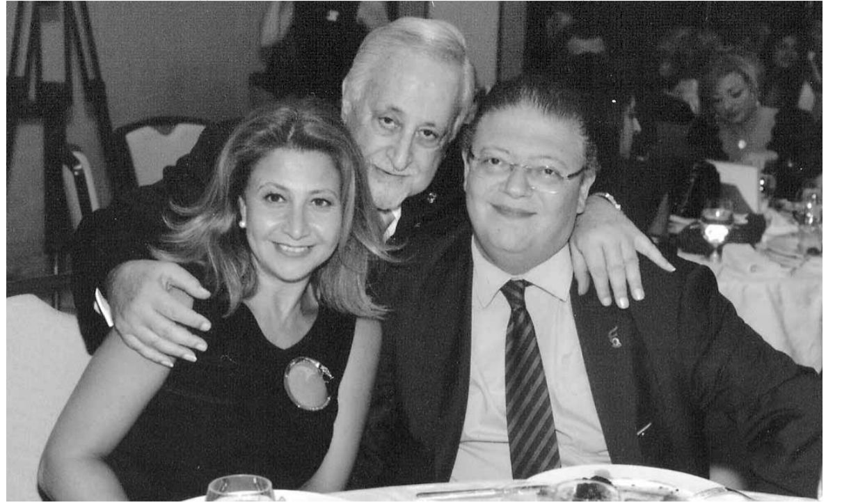
الحاكم جورج بو شديد والحاكم وجيه عكاري وعقيلته مروى