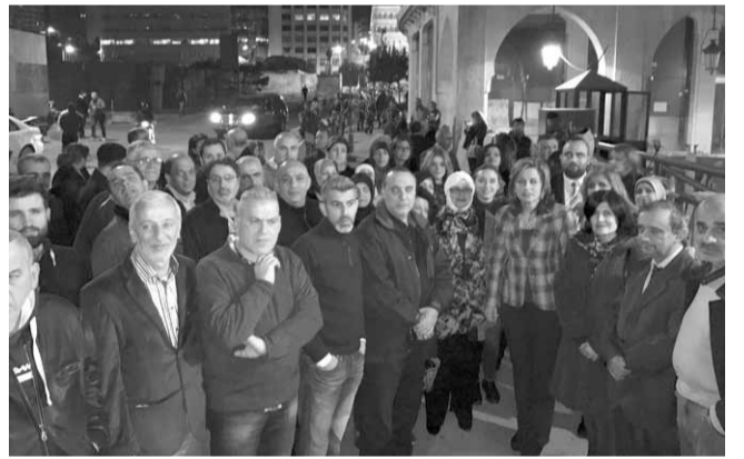
خلال الاعتصام في رياض الصلح

ناشد متعاقدو وزارة الاعلام رئيس الجمهورية العماد ميشال عون التدخل لاعادة وضع مشروهم على جدول اعمال الجلسة التشريعية التي عقدت امس في مجلس النواب. وطالبوا رئيس المجلس النيابي نبيه بري ورئيس الحكومة سعد الحريري والنواب بتلبية مطلبهم وقرار المشروع وفضله عن مشروع المتعاقدين في الإدارات العامة ككل. لأنه مطلب حق. وعلن المتعاقدون استمرارهم في الاعتصام امام مجلس النواب في ساحة رياض الصلح، وتوقيف العمل في «الوكالة الوطنية للاعلام» و«اداعة لبنان» و«مركز الدراسات» وكل دوائر الوزارة الى حين تحقيق مطلبهم. وشكروا وسائل الاعلام والمواقع الالكترونية التي تضامنت معهم.