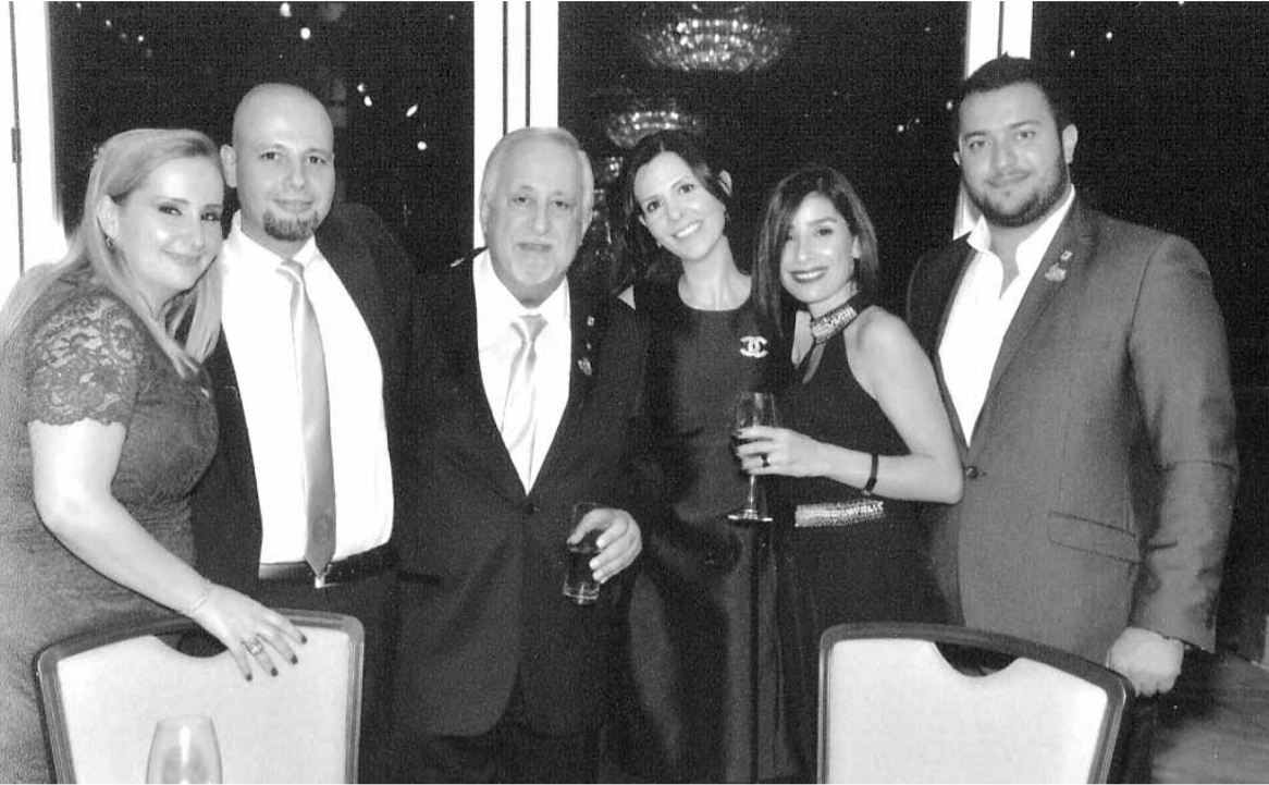
الحاكم جورج بو شديد وعائلته