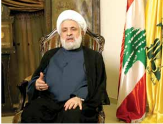
الشيخ نعيم قاسم

وماذا عن موقفكم من نتائج الزيارة والمواقف الرئاسية التي رافقتها، خصوصاً في ما يتعلق بموقع المقاومة ووظيفتها؟ يجيب قاسم: ان التصريحات التي صدرت خلال الزيارة الرئاسية الى السعودية وقطر لم تغير نظرتنا الى أداء الرئيس عون والى الخلفيات التي انطلق منها للانفتاح على الدول العربية والاجنبية، وبالتالي لم تكن لدينا ملاحظات، لا قبل الزيارة ولا بعدها، وما يفعله يندرج في صلب مهامه كرئيس للجمهورية. ويضيف: أصبح واضحاً ان قضية المقاومة ترتبط بالاحتلال الاسرائيلي وما ينجم عنه من اعتداءات، ومن حقنا ان نواجه هذا العدوان بكل الاساليب الممكنة، لحماية لبنان وتحرير ما تبقى من ارض محتلة، وقد جرت محاولات في السابق من قبل اعداء المقاومة لضربها خدمة لاسرائيل، ولكنها باءت جميعها بالفشل. ويتساءل: هل يتوقع أحد ان يكون حلفاء المقاومة وأصدقائها في الخندق المعادي، وهي التي سجلت ولا تزال انجازات عظيمة في مواجهة العدو الاسرائيلي والارهاب التكفيري الذي يشكل امتداداً للمشروع الصهيوني وخدمة له.