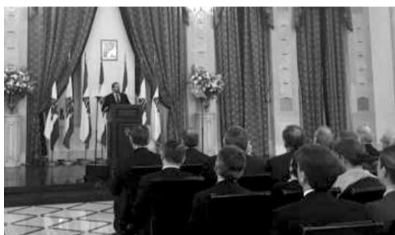
الحريري يلقي كلمته

دعا رئيس مجلس الوزراء سعد الحريري المجتمع الدولي، -«مساعدة لبنان في تحمل عبء أزمة النزوح السوري لمواجهة التوجهات التي يشهدها لبنان»- وقال الحريري خلال إطلاقه «خطة لبنان للاستجابة اللازمة» في احتفال أقيم مساء أمس في السراي الكبير «لا يمكن أن يستمر لبنان في تحمل عبء هذه الأزمة دون دعم دولي كاف وكبير لمؤسسهات وبنياته التحتية، وللقيام بذلك بشكل صحيح، ندعو المجتمع الدولي لمساعدة لبنان في هذه المهمة الكبيرة. لأننا لن نشعر وحدنا بعبء عدم المساعدة، بل سيسعير بها العالم بأسره. والسبيل الوحيد لمواجهة هذه الأزمة هو في إيجاد فرص للجميع».