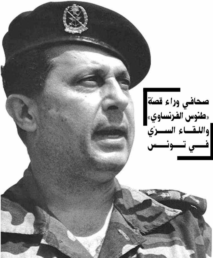
صحافي وراء قصة «طنوس الفرنسي» واللقاء السري في تونس

في خرق واضح لنقاط التحفظ على الخط الأزرق، أقدم العدو الصهيوني على إزالة ساتر ترابي كان رفعه الجيش اللبناني في منطقة خلّة الحافر، جنوب العيسة في جنوب لبنان. وقام العدو بتثبيت جهاز تجسس نهارى وحارارى خارج السياج التقني على مرأى من موقع مراقبة لقوات اليونيفيل الدولية، وقام الجيش اللبناني بالانتشار.