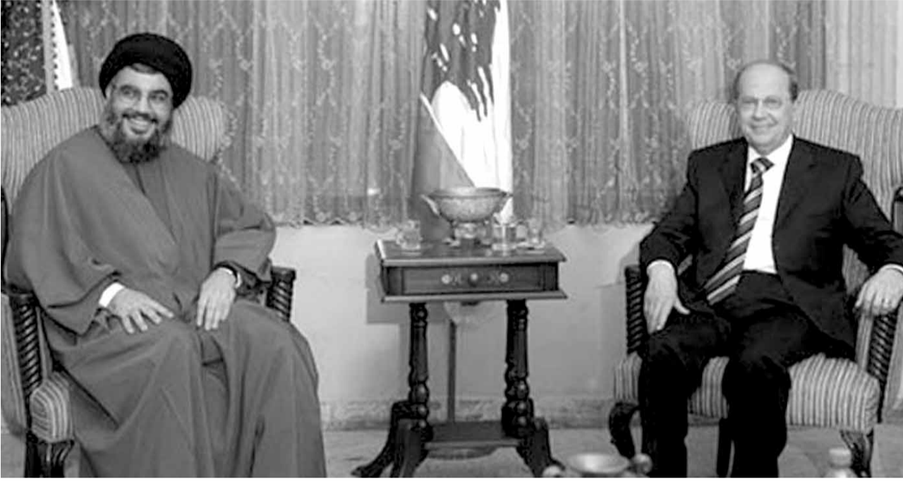
سيمون ابو فاضل

لموقف عون، خياران، إما التوصل لإجراء قانون انتخابي من روحية مضمون «خطاب عون الدبلوماسي»، بحيث يكون إرجاء إجراء الانتخابات تقنياً، وإبقاء مدة ولاية مجلس النواب حتى إنجاز الاستحقاق لاحقاً وفق القانون الجديد ضمن العام ٢٠١٧، وبصورة أوضح يتابع المراقبون بأن التمديد يكون معللاً بمهلة إجراء الانتخابات أو انتهاء ولاية مدة المجلس دون التمديد مجدداً، بحيث عندها يحل حكماً مجلس النواب وتعتبر الحكومة مستقلة ليصبح عندها النظام اللبناني في شلل ما عدا رئاسة الجمهورية ليبقى عون الناظم والمرجع الوحيد للدولة التي دخلت مرحلة النظام الرئاسي مع ما تحمل هذه الخطوة من طروحات وأفكار لنظام جديد.