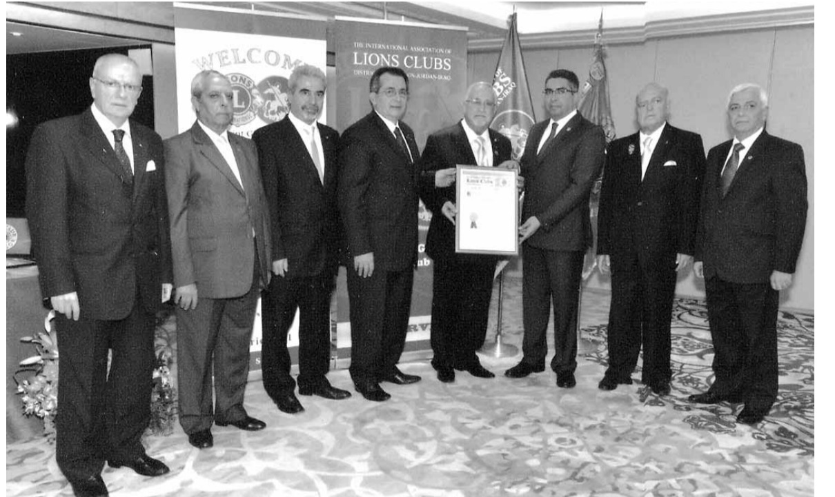
الحاكم فادي غانم والحاكم لويس بو فرح يسلمان براءة التأسيس للحاكم