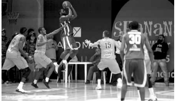
من مباراة الهومنتمن والليونة

عزز الهومنتمن صدارته، بفوزه على الليونة (٨٦-٨٣) في المباراة المثيرة في المباراة التي جرت أمس الخميس على ملعب الهومنتمن في انطلياس، ضمن المرحلة العاشرة من بطولة لبنان في كرة السلة للرجال لائدية الدرجة الأولى.