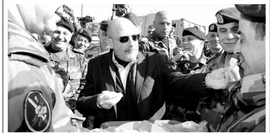
الصراف يُطمع العسكريين والى جانبه قهوجي

والحفاظ على سلامة أهالي البلدات والقري المحاذية لها، وأشاد ب «الروح المعنوية العالية التي يتمتعون بها رغم وعورة الجبال والظروف القاسية في المنطقة»، مشدداً على «متابعة قضية رفاقهم العسكريين المحطوفين وبذل أقصى الجهود لكشف مصيرهم وتحريرهم». وأكد أن «المؤسسة العسكرية تشكل الدعامة الأساسية لاستقرار الوطن ونهوضه الإنمائي والاقتصادي، وحصنه المنيع في مواجهة الإرهاب والعدو الإسرائيلي، وكل يد تمتد للثمن من وحدته ومسيرة سلمه الأهلي».