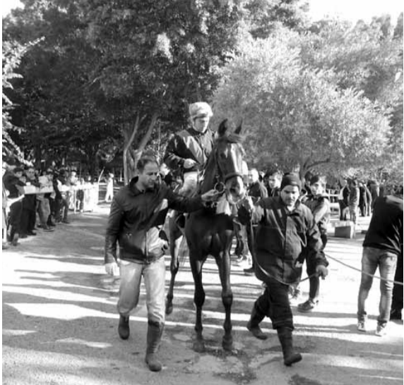
في طريقه الى الستارت والهدف...