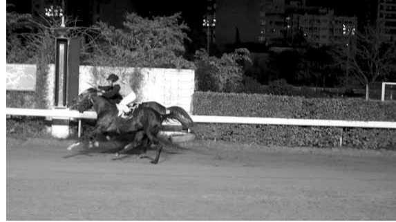
علاق وصقر والفوز براس لصالح علاق