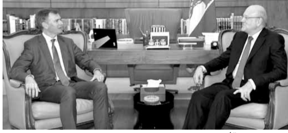
يون يزور ميقاتي

قال الرئيس نجيب ميقاتي في تغريدة عبر «تويتر»: «إن خطاب رئيس الجمهورية العماد ميشال عون أمام السلك الدبلوماسي قارب الملفات المطروحة بروية واضحة، ولاسيما ما يتعلق بالقضية الفلسطينية ومطالبته بالضغط لتنفيذ القرارات الدولية»، مضيفاً «تؤيد دعوة عون الى اعتماد النسبية في الانتخابات لتأمين صحة التمثيل وعدالته للجميع، وننوه بتشديده على العمل لإعادة ثقة المواطن بدولته».