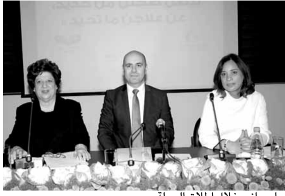
حاصباني خلال إطلاق الحملة

أكد نائب رئيس مجلس الوزراء وزير الصحة العامة غسان حاصباني، أن «وزارة الصحة ستستمر في تقديماتها المختلفة للمواطنين من دون توقف، لأننا مؤمنون بأن الحكم استمرارية». وأشار إلى أن «إذا كانت هناك نواقص بالتمويل أو الترشيح أو الإدارة أو الحوكمة، فإننا سنعمل عليها بهدف تأمين الإستمرارية وحرصا على ألا تكون المعالجات آتية فقط».