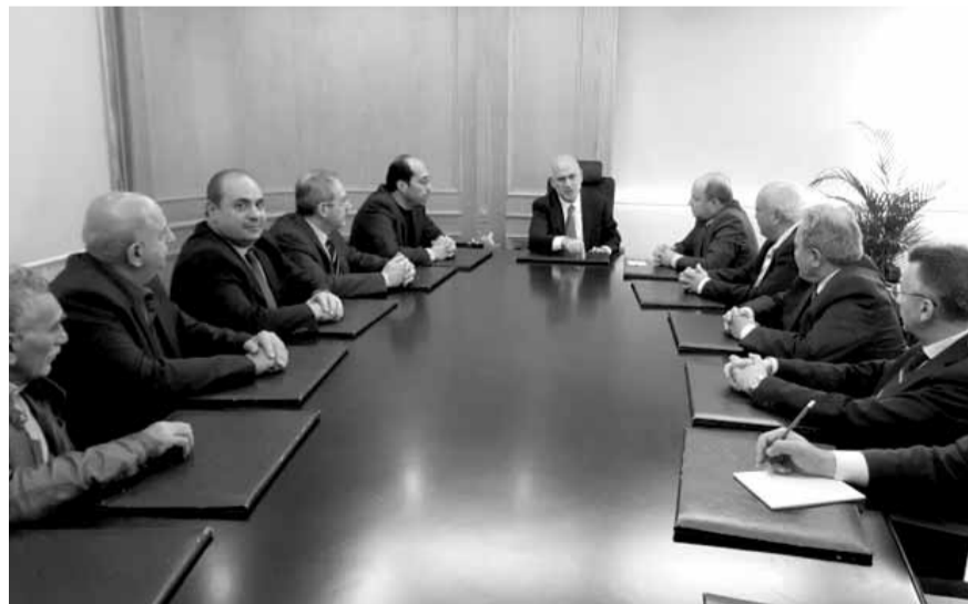
فنيانوس مع احد الوفود

بل ستشمل كافة الشركات التي تتوافر فيها الشروط المطلوبة التي تضعها ادارة المناقصات».