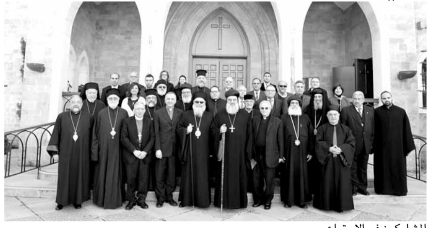
المشاركون في الاجتماع

عقدت اللجنة التنفيذية لمجلس كنائس الشرق الأوسط اجتماعها الأول بضيافة الكنيسة الإنجيلية الوطنية في بيروت، وبرئاسة رؤساء المجلس ممثلي العائلات الكنسية الأربع التي يتألف منها المجلس: عن العائلة الأرثوذكسية الشرقية، بطريرك أنطاكية وسائر المشرق والرئيس الأعلى للكنيسة السريانية الأرثوذكسية في العالم