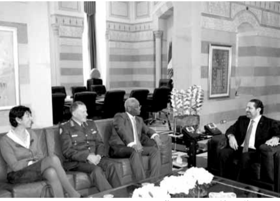
مبعوث الامم المتحدة يزور الحريري

شدد مبعوث الأمم المتحدة ومساعد الأمين العام لعمليات حفظ السلام القاسم وين، خلال زيارته رئيس مجلس النواب نبيه بري في عين التينة، اننا «هنا في اطار المراجعة الاستراتيجية لليونيفيل بتكليف من مجلس الامن الدولي والامين العام لكي نأخذ هذه المراجعة مجراها في اطار حفظ السلام الشامل بأفضل الطرق،