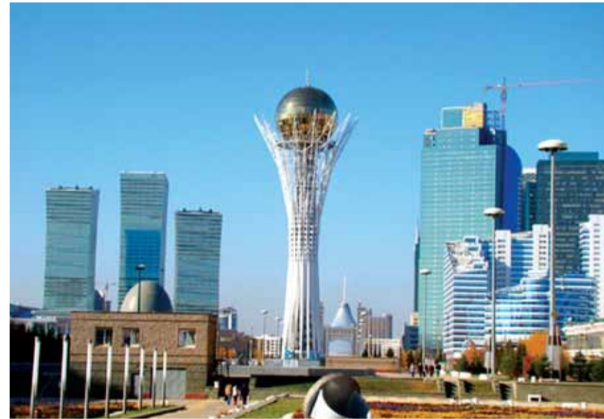
مكان الاجتماع الدولي بشأن سوريا في الاستانة

في تطور لافت وللمرة الاولى قامت الطائرات الحربية المقاتلة السورية بالتحليق فوق القنيطرة دون ان تعترضها طائرات اسرائيلية، وقامت بقصف مواقع لجبهة النصرة التكفيرية.