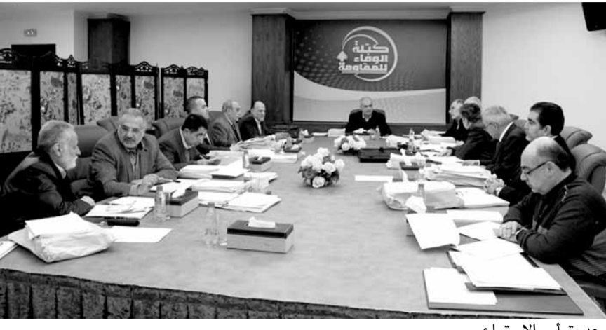
رعد يترأس الاجتماع

في هذا السلوك الجائر تعبيراً عن المازق الذي يعانیه النظام هناك نتيجة الهوة الساحقة التي تفصله عن شعبه المظلوم والصابر. وإننا نجدد تاييدنا للانتفاضة التي يواصلها شعب البحرين العزيز ندعو العالم الى وقفة مسؤولة تستجيب لمطالبه المشروعة والعدالة وتضع حدا لجرائم النظام البحرينى الظالم والمستبد.