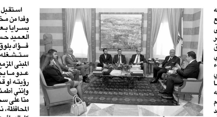
المشوق مجتمعاً بنقابة المطاعم

استقبل وزير الداخلية والبلديات نهاد المشوق في مكتبه في الوزارة وفداً من نقابة اصحاب المطاعم في لبنان برئاسة طوني الرامي الذي قال بعد اللقاء: «جننا باسم قطاع المطاعم لهنته معالي الوزير بالاعباد الجيدة ولشكر القوى الامنية وعلى رأسها وزارة الداخلية على كل لحظة امن نلعم بها كمؤسسات سياحية ونترجمها بالاقتصاد الجيد، اما القوى الامنية وبخاصة قوى الامن الداخلي فهي تترجم الامن بالتضحية والوفاء والشرف، واردف قائلا: «استعرضنا الوضع السياحي وبحثنا معه الاجراءات الامنية التي يجب ان تتخذ بالنسبة للمؤسسات السياحية وبخاصة الملاهي، وفي النهاية هنأنا معاليه على توليه مهام وزارة الداخلية مجدداً».