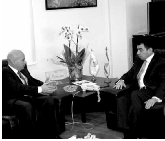
أبي خليل مع السفير ايطالي

بحث وزير الطاقة والمياه سيزار أبي خليل مع سفير ايطاليا ماسيمو ماروتي في سبل التعاون بين البلدين، وبخاصة لناحية دعم ايطاليا لبنان في قطاعي الكهرباء والمياه اللذين يتعرضان لضغوط كبيرة جراء أزمة النزوح السوري.