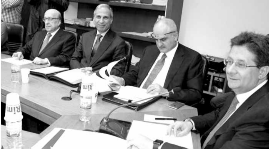
كنعان وبدا الى جانبه وزير المالية

الحسابات التي يقول وزير المال انه سيحيل التقرير في شأنها عند انتهاء العمل وليتحمل المجلس النيابي المسؤولية في حال وجود فجوات. ونحن نفهم من ذلك ان هناك مشكلة، وعلى هذه المشكلة ألا تتعوق إقرار الموازنة ولكن ألا تتعوق كذلك المراقبة والرقابة». وأكد كرئيس للجنة وكأمين سر «تكتل التغيير والإصلاح»، انني ذاهب للتعاون بلا خلفية سياسية لإقرار موازنة، ونحن ضيقون بالخروج بما يحترم الدستور والإصلاح، ويعالج الحسابات المالية بلا أي تسوية او إعاقه للموازنة، لأن التسويات ترسخ في ذهن الرأي العام والإدارة والمجتمع الدولي بأن لبنان بلد متفلت ولا ضوابط فيه بل تسويات كل عقدين، فنفقد الثقة بانفسنا، وثقة المواطن بدولته، وثقة المجتمع الدولي بلبنان».