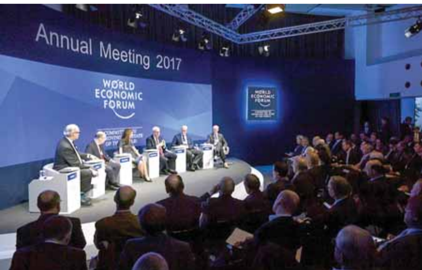
المشاركين في منتدى «دافوس»

وبدوره ندد وزير الخارجية السعودي، عادل الجبير، بتصريحات أبرز المرشحين لانتخابات الرئاسة الفرنسية بان الرياض تمول التطرف الإسلامي في فرنسا وأن هناك حاجة لمراجعة العلاقات بين البلدين. وقال الجبير، في تصريحات صحفية: «لا يمكنني التعليق على ما قيل أثناء حملة انتخابية، لكنني أعلم أن هناك سوء فهم للسعودية، والناس يقولون إن السعودية هي المتطرف، السعودية هي التعصب، السعودية تمول مؤسسات متطرفة، وأنا دائماً أقول إن هذا غير صحيح». (تتمة الخبر الإيراني ص ١٢)