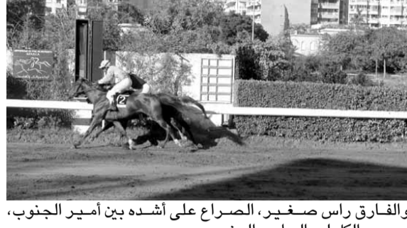
والفارق راس صغير، الصراع على أشده بين أمير الجنوب، وحبيب الكل لصالح أمير الجنوب