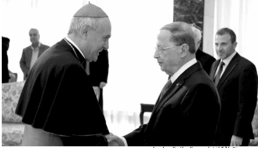
عون مستقبلاً كاتشا عميد السلك الدبلوماسي