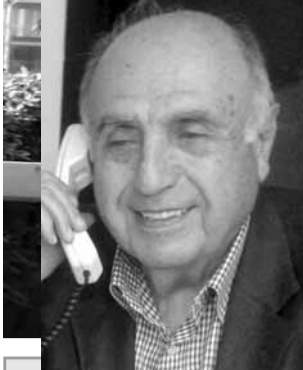
اعداد: لوران ناكوزي