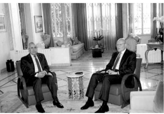
سلام مستقبلاً سليمان

عرض الرئيس تمام سلام، قبل ظهر امس في دارته في المصيطبة، مع رئيس الجمهورية السابق ميشال سليمان في شؤون عامة.