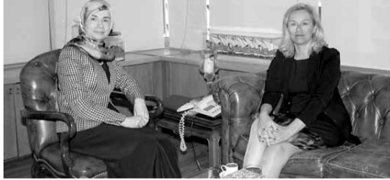
عز الدين مع كاغ

استقبلت وزيرة الدولة لشؤون التنمية الإدارية، في مكتبها في الوزارة، الدكتورة عنابة عز الدين المنسقة الخاصة لأمم المتحدة في لبنان سيفريد كاغ، في زيارة بروتوكولية. وتم التداول خلال اللقاء، في المواضيع المتعلقة بالأمم المتحدة وسبل التعاون بين مكتب وزير الدولة لشؤون التنمية الإدارية والأمم المتحدة في لبنان ضمن شراكة كاملة بهدف الاستفادة من هذه الفرص لتحقيق النجاح للإدارة أولاً ولبلبنان ثانياً. والتقت كاغ رئيس كتلة «المستقبل» النيابية الرئيس فؤاد السنيرة في منزله في بلس، وكان الاجتماع مناسبة لعرض الأوضاع في لبنان والمنطقة من مختلف الجوانب.