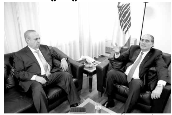
جريساتي مستقبلاً وهاب

زار رئيس حزب التوحيد العربي الوزير ونّام وهاب، أمس وزير العدل سليم جريساتي، في مكتبه في الوزارة، لتنهضته بمناسبة توليه منصب وزارة العدل، وجرى خلال اللقاء بحث في الكثير من الشؤون المتعلقة بالقضاء خصوصاً في ضوء توجه العهد نحو تصحيح الشؤائب الموجودة في القضاء، حيث أكد وهاب بعد