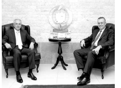
خطر مستقبلاً حبيش

استقبل مدير عام الدفاع المدني العميد ريمون خطر في مكتبه النائب هادي حبيش حيث تباحثا في شؤون وشجون الدفاع المدني والخطوات التي ستتبع لتطبيق المرسوم الذي أقر مؤخراً عن مجلس الوزراء حول تنظيم هيكلية المديرية العامة للدفاع المدني وتوسيع ملاكاتها والذي سيمارس إلى تثبيت المتطوعين ضمنه.