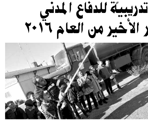
تدريب التلاميذ على استعمال الخرطوم

ورأى ان «أي تخلف عن هذا القانون يعد خطيئة كبرى واستمراراً للنهج السياسي نفسه القائم على التفرد والاستئثار وتغييب صوت الناس عن القرار»، مشدداً على ان ما يحصل اليوم حولنا وفي مناطق مختلفة من العالم من استفحال لظواهر التطرف والإرهاب والتكفير تتحمل مسؤوليته الدول الكبرى التي رعته وغذته ومولته وسهلت انتشاره لزرع الفوضى في المنطقة ليعود ويرتد عليها وبإل ما فعلت».