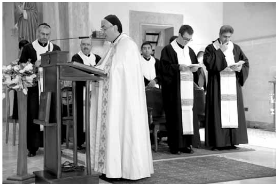
عيد الساتر يترأس القداس

حياتكم الرهبانية والفرح الذي فرحتموه حينها، وأن تسالوا انفسكم هل ما زلتم تتشعرون به أم أنه ازاد؟ وكيف كرستم حياتكم ليسوع المسيح، الامم بالنسبة اليكم، وتذكرون أنكم كرستم حياتكم لنحبوا الناس الذين حولكم لأجل يسوع المسيح، وأنا كأخ لكم أسأل السؤال لنفسي نفسه يوميا لأننا جميعا نغرق بالادارة والوظيفة ونصدق أهميتنا، إنما ننسى أن يسوع المسيح هو وحده المهم»، مضيفا «ليست الاستراتيجيات واللقات هي التي تأتي بالدعوات الرهبانية فالسبب وراء نذوراتكم كرهبان وراهبات هو محبة راهبة أو راهب لكم وشهادة تقوى ومحبة منهم».