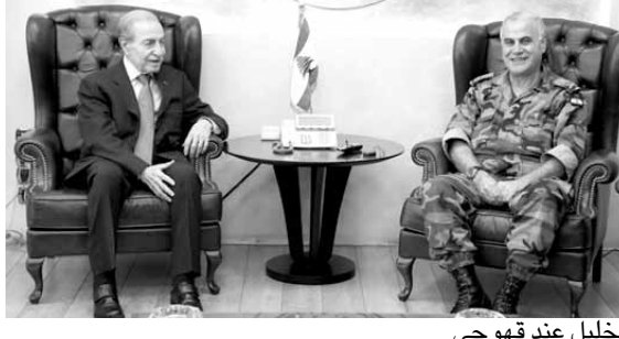
الخليل عند قهوجي

استقبل قائد الجيش العماد جان قهوجي في مكتبه في البرزة، النائبين انطوان سعد وأمين وبهي، وتناول البحث الأوضاع العامة في البلاد.