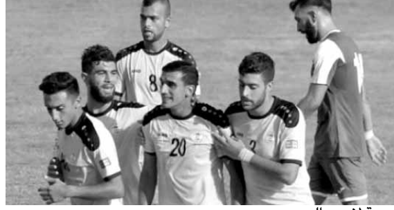
فرحة لاعبي العهد

اعتبرت صحف إسبانية أمس الإثنين، ان خسارة ريال مدريد، أمس أمام اشبيلية (٢-١) بالجوولة الـ ١٨ من الليغا، بمثابة فرصة تحيي آمال برشلونة في الصراع على اللقب. وكأنت «سبورت»، الكتالونية، أولى الصحف التي أبرزت ان خسارة الملكي تمثل فرصة للبرسا، مبيته ان الفريق الكتالوني، فاز بلقب الليغا عام ٢٠١٥ بعد ان تعرض لموقف مشابه، وانتفض في النصف الثاني من البطولة. ويات الفارق بين الريال المتصدر، والبرسا (الثالث) بعد هزيمة الاحد تقطنين فقط، علماً ان الفريق المدريدي لديه مباراة مؤجلة، قد ترفع الفارق إلى ٥ نقاط، بينما أصبح الفارق مع اشبيلية الوصيف نقطة واحدة. وأضافت «سبورت»: «خسارة أمس جعلت المنافسة على الليغا تشتعل»، مبيته انها الأولى للملكي منذ ٤٠ مباراة. أما «الموندو ديبورتيفو» فكتبت على غاليلها: «الضربة القاضية لفريق راموس» الذي احرز هدفاً في مرماه ليتعادل اشبيلية، بينما جاء هدف فوز اشبيلية عبر المونتينيغري ستيفان يوفيتيش، في الوقت الضائع. وأضافت ان «الرقم القياسي للريال