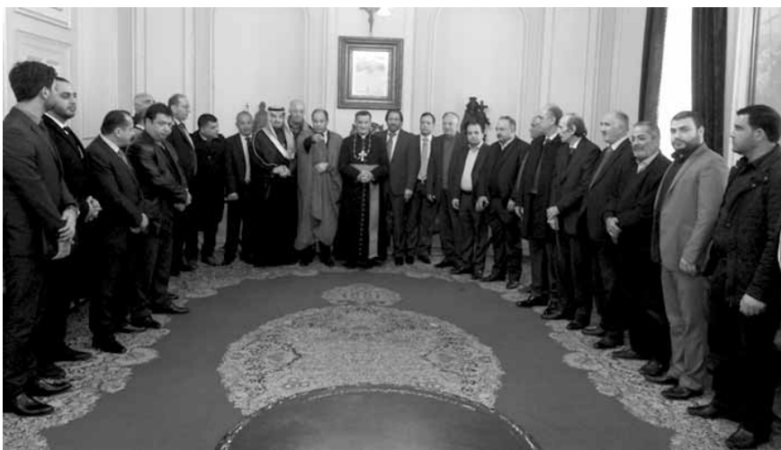
الراعي مع وفد العشائر

النادر الذي قال: «جئناكم من شتى انحاء الوطن العربي لنقدم لنيافتكم ونيقتنا المحببة على نمذ الفتنة والطائفية والمذهبية ونبذ الارهاب التكفيرى بكل وسائله وضرورة انجاح هذه الوثيقة ونشرها للعمل بها لدى كافة شرائح المجتمع العربي من قبائل وعشائر وعائلات بكل مذهبها شاكرا للشيخ سعد فوزي حمادة على هذه المبادرة الطيبة». كما كانت كلمة للسفير علي المولى الذي أكد ضرورة تعاون الاصدقاء