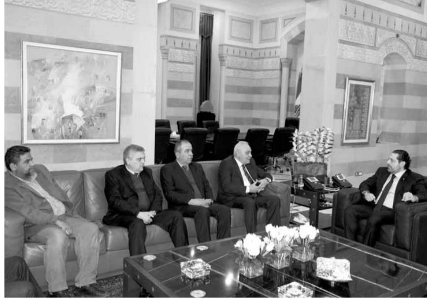
اجتماع الحريري والاتحاد العمالي

على اية حال، هذه المذكرة المطلية لم يعيها الاتحاد العمالي العام لأنه ينتظر موعداً مع رئيس الجمهورية العماد ميشال عون في القريب العاجل.