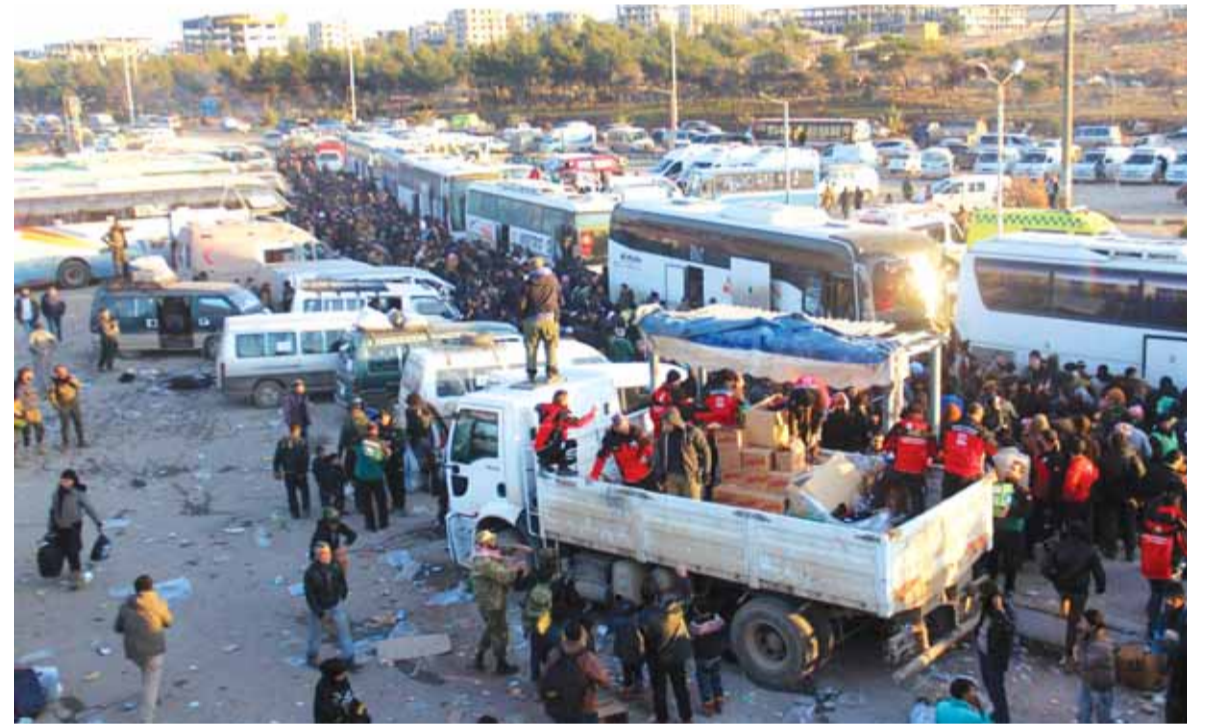
خروج المدنيين من وادي بردى

تبين من معلومات عسكرية ان الطائرات الاسرائيلية العدوة قصفت من اجواء البقاع بصواريخ بعيدة المدى مطار المزة وسببت اضرارا لم تعرف بعد، انما الهدف من القصف قد يكون قصف طائرات عسكرية هبطت في مطار المزة، ويريد العماد الإسرائيلي منعها من افراغ حمولتها.