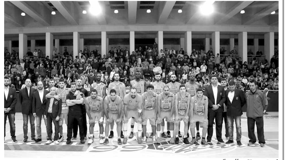
فريق هومنتمن للرجال

بذلك احرز لقب بطولة لبنان مع اربعة اندية مختلفة (سبق أن احرز اللقب المرموق مع الحكمة والرياضي والشانفيل). فلحظة كرة السلة بقيادة «المايسترو» غي مانوكيان تقوم بواجباتها على اكمل وجه وتتوجهات القيمين على هومنتمن وساكون صريحاً في القول انه لم نسمع يوماً ان ادارة النادي تاخرت في دفع الرواتب الشهرية للجهاز الفني ولاعبي الفريق اذ ان الأمور المالية مضبوطة بشكل تام مما يؤمن الاستقرار الفني والذهني للاعبين وهي من مفاتيح النجاح لكل فريق.