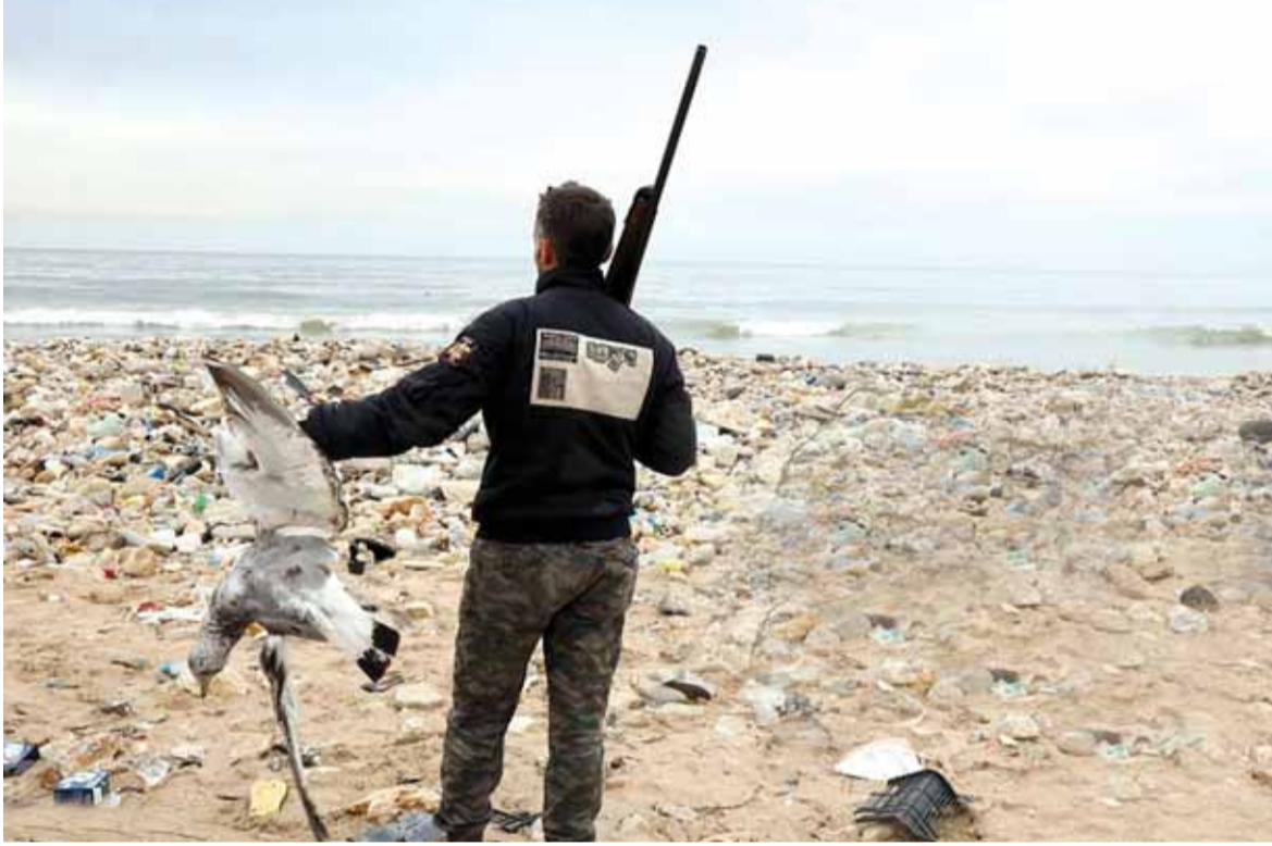
طيور النورس «دفعت الثمن»

وهذا يعيد لبنان الى الساحة العربية والدولية ليلعب لبنان دوره الدولي على افضل وجه، بعد ان غاب عن ذلك مدة ٣ سنوات. كذلك في الربيع القادم، قد يقوم العماد ميشال عون بزيارة دول الاغتراب في الولايات المتحدة ولاحقا في البرازيل والأرجنتين وفنزويلا. ويرافقه في زيارته وزير الخارجية جبران باسيل، وقد وزاري للقاء المغتربين (تتمة المانشيت ص ١٦)