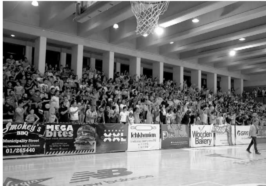
الجمهور الوفي لنادي هومنتمن

نادي هومنتمن من الأندية العريقة والفاعلة في وسطنا الرياضي وهدفه احراز لقب بطولة الرجال بعدما سبق واحرز لقب بطولة السيدات مع توافر جميع العوامل لتحقيق هذا الهدف الذي لن يكون سهلاً بوجود عدد من الأندية الطامحة لاحتلال لقب بطولة لبنان، فكما نبأ أبناء هومنتمن المناصب الرياضية ومنهم على سبيل المثال ولا الحصر وزير الشباب والرياضة السابق الدكتور سيبويه هوفانيان ومدير مكتبه «الديناميكي» ابراهيم منسى لفكرة خمس سنوات وهاغوب خاجيريان (أمين عام الاتحاد الآسيوي في كرة السلة) وميشال دو شادرافيان (رئيس اتحاد الدول الفرنكوفونية في كرة الطاولة والرئيس السابق للاتحاد اللبناني لكرة الطاولة) وفاتشيه زادوريان (عضو مجلس ادارة اتحاد البحر الابيض المتوسط للدراجات الهوائية ورئيس الاتحاد اللبناني الذي عاد الى عرينه) وآخرين مع الاعتقاد ان اي اسم لم نذكره.. فهل يرقص مشجعو نادي هومنتمن رقصة الفوز والظفر باللعب على الحان غي مانوكيان؟