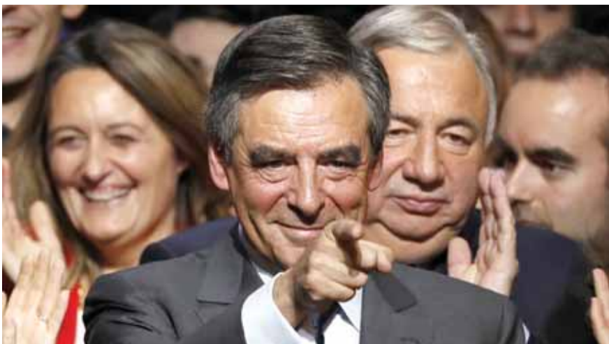
فيون بعد تبني ترشيحه من الجمهوريين

وأوضحت وكالة «فرانس برس» أن عملية تحديد ترشيح فيون جاءت خلال مؤتمر للمجلس الوطني للحزب. وقال فيون، حسب الوكالة، خلال المؤتمر، (تتمة الخبر الفرنسي ص ١٦)