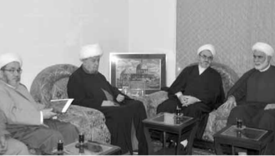
وفد علمائّي يزور قبلان

المسلمين والتقارب في ما بينهم، وكان بحث في القضايا والشؤون الدينية وامور الحوزة العلمية في لبنان وسوريا وقم المقدسة، وكان تأكيد لدور الحوزات الدينية في فد المجتمعات بالقيم والتعاليم الدينية التي تحفظ المجتمع من كل انحراف.