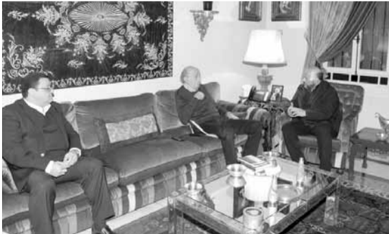
الرياشي عند جنبلاط

سبقى سائرين بتوجهاتكم رافعين رايتكم في وجه ما نشهده من تخلف بعيد المنطق بأسرها عشرات الستين إلى الوراء»، ودعت إلى «بذل الجهود لإقرار مشروع التعديلات التي نوقشت في المجلس المذهبي الدرزي والهيئات النسائية».