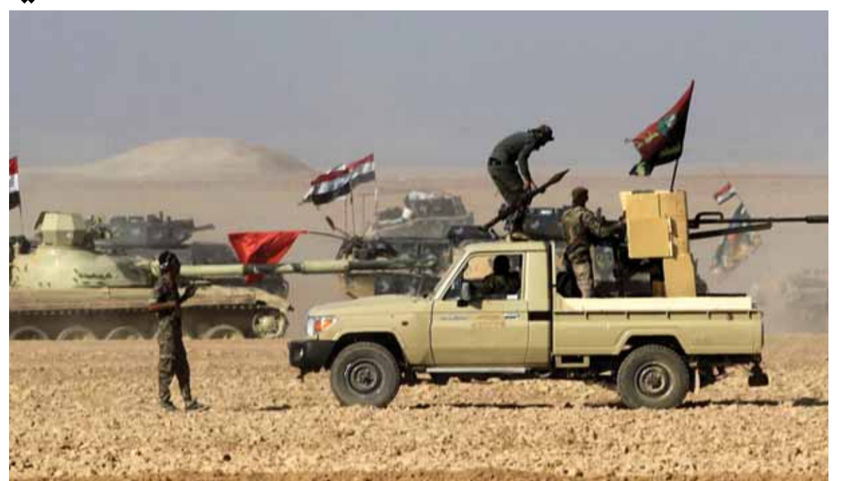
القوات العراقية داخل الموصل