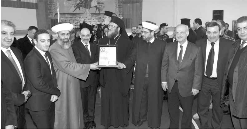
الصراف يتسلم الدرع التكريمي

وبالتعاون مع القوى السياسية كافة الحريصة على وحدة واستقرار هذا البلد، وان الزيارة الأخيرة التي قام بها الرئيس عون الى المملكة العربية السعودية والنتائج الإيجابية الكبرى التي تحققت قد فتحت افاقا جديدة في مسار العلاقات». وأكد ان «دولة قطر التي وقفت الى جانب لبنان ابان الاعتداءات الاسرائيلية في حرب تموز ستبقى كما عهدناها الى جانب بلدنا وزيارة الرئيس».