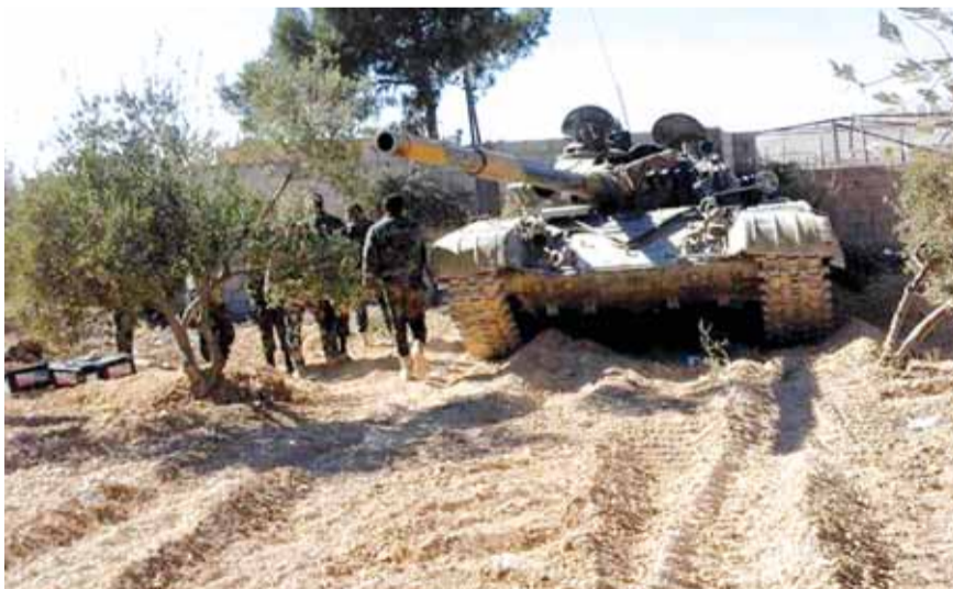
القوات السورية في وادي بردى

حقق الجيش العربي السوري مع حزب الله تقدماً مهماً في وادي بردى وضرب القوى التكفيرية وخاصة «جبهة النصرة» ودمر لها مواقع عديدة في وادي بردى، وقد بدأت القرى المحاصرة في الوادي، تقوم باتصالات مع ممثلين عن الدولة السورية لتحقيق الهدنة. كما اتصلوا بممثلين عن القوات الروسية لتأمين هدنة في وادي بردى.