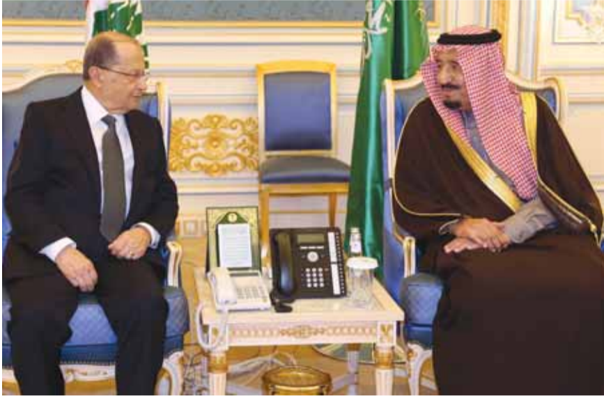
الرئيس عون والملك السعودي

وضعت كل القضايا العالقة بين المملكة السعودية ولبنان «تحت النظر» واكتفى المسؤولون السعوديون بمجرد اعطاء مؤشرات خجولة عن امكانية تحقيق نتائج عملية، سواء في موضوع الهبة للجيش او عودة الاستثمارات او السياحة. ففي الخلوة التي عقدت بين الملك سلمان والرئيس عون، طلب رئيس الجمهورية الاستمرار في دعم الجيش لمواجهة الارهاب والتحديات الامنية، ومن ضمن ذلك موضوع الهبة (تتمه المناشيت ص ١٦)